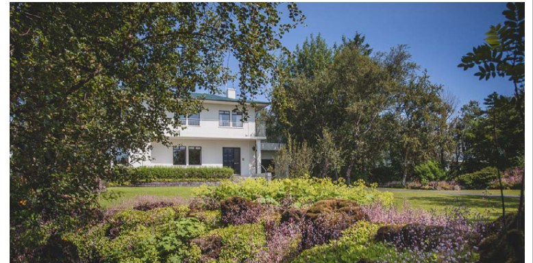
Stórt einbýlishús í Kópavogi með stórum og fallegum garði.

Borðstofa og stofa eru teppalögð, stórir gluggar sem snúa til suðurs. Á neðri hæð eru tvö herbergi.