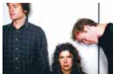
BANDARÍSKA HLJÓMSVEITIN LOW Spilar á Nasa 4. apríl.

Low kom síðast til Íslands árið 1999 og spilaði á eftirminnilegum tónleikum í Háskólabíói með Sigur Rós. Þá var hljómsveitin þekkt fyrir ofurljúfa og hæga tónlist (svokallað „slowcore“) en bandið hefur verið að keyra sig aðeins upp í rokkinu síðan þá. Nýjasta platan, Drums and guns, sú átt-