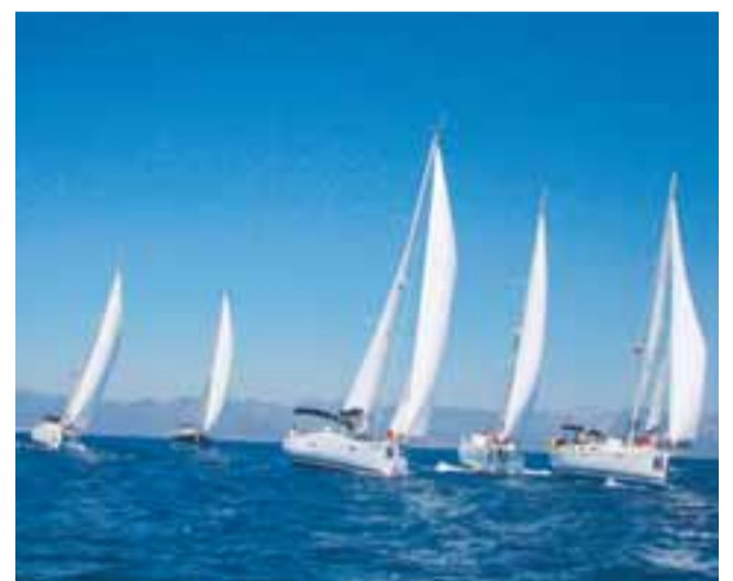
Seaways var með skútur í 8th International Göçek Regatta siglinga- keppninni síðastliðið vor og mun einnig taka þátt í ár.