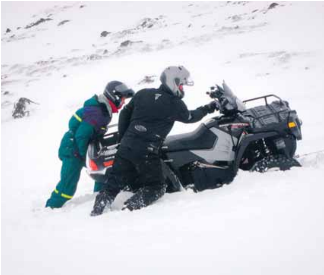
Sportinu geta fylgt mikil líkamleg átök.