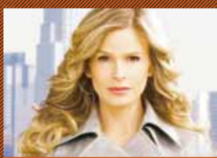
THE CLOSER - kl. 21:00