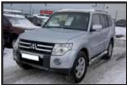
MMC Pajero Instyle, Nýr bíll, Diesel, bakkmyndavél. Verð 6.390.000.- Tilboð 5.900.000.-