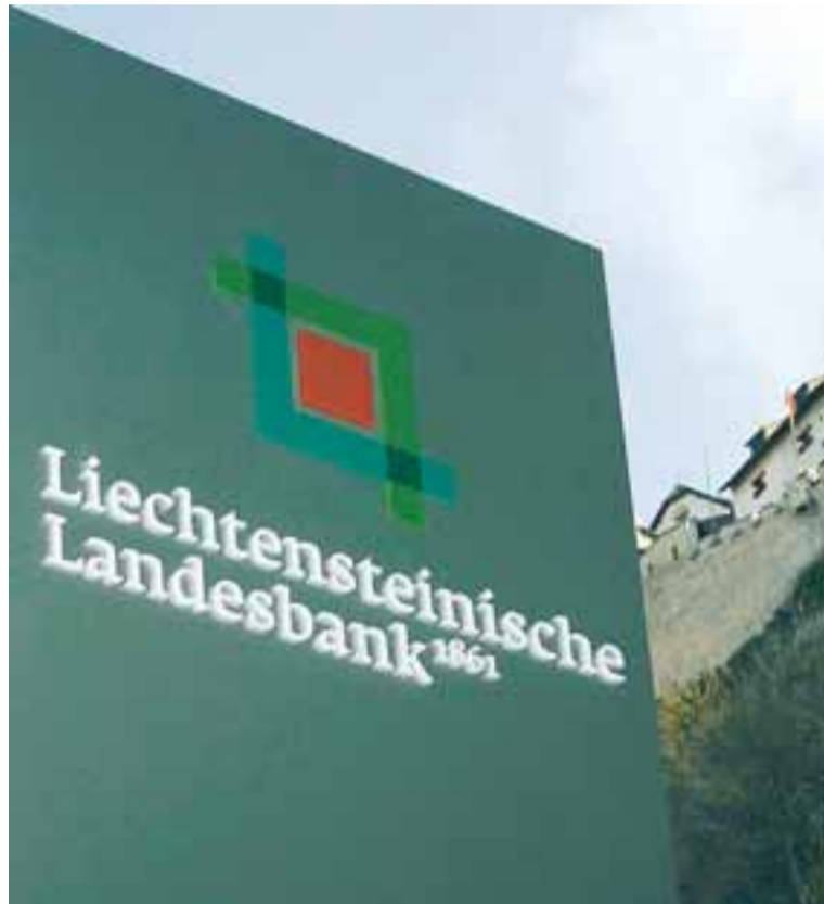
SKATTASKJÓL Banki í Vaduz með Liechtenstein-kastala í baksýn. FRÉTTABLAÐID/AP

stór sendinefnd frá Bandaríkjunum komið til landsins. - sdg