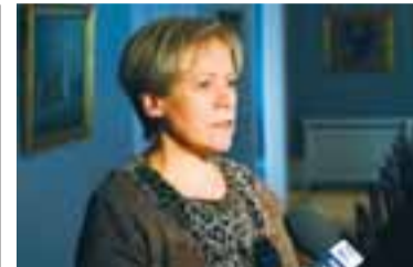
INGIBJÖRG SÓLRÚN Utanríkisráðherra hitti framkvæmdastjóra Sameinuðu þjóðanna í New York í gær.