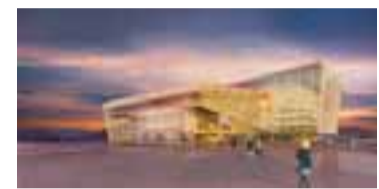
NÝJA TÓNLISTAR- OG RÁÐSTEFNUHÚSIÐ Betur þekkt sem..?

bandsins; Seybe Sunsicks Rock'n'Roll Circus og Deep Jimi and the Zep Creams ásamt glænýju efni sem Deep Jimi vinnur að um þessar mundir. Tónleikarnir hefjast kl. 21.00 og er miðaverð 1.000 kr.