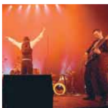
DEEP JIMI AND THE ZEP CREAMS Rokkararnir fagna fimmtán ára útgáfuafmæli Funky Dinasour með tónleikum á Organ.

Dagskráin hefst með leik sænsku blússveitarinnar Emil & the Ecstasics. Að leik þeirra loknum stígur Deep Jimi á stökk og flytur Funky Dinasour frá upphafi til enda. Í kjölfarið fylgja svo lög af tveimur seinni plötum