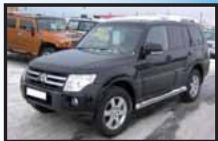
MMC Pajero Intense, Nýr bíll, dísel, 7 manna. Verð 5.550.000.- Tilboð 100% lán 5.168.000.-