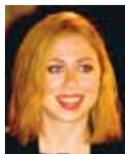
Chelsea Clinton er 27 ára.