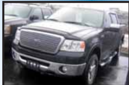
Ford F150 Crew Lariat, 2007, 24þ.km. Verð 3.990.000.- Tilboð 3.500.000.-