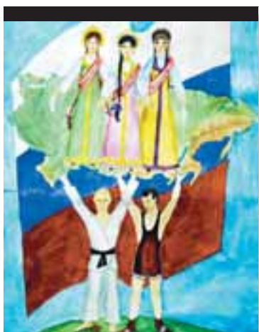
HALDA UPPÍ ÞJÓÐINNI Rússneskt barn gerði þessa teikningu þar sem sjá má Vladimir Pútín forseta í júðóbúningi og arftaka hans, Dimitrí Medvedev, í glímubúningi. Þeir halda uppi þremur rússneskum konum, sem bera borða með áletrunum „menntun“, „efnahagur“ og „menning“.

Bæjarstjórnin fellir tillögu minnihlutans um lækkun fasteignaskatts: