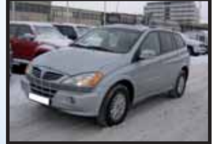
SsangYoung Kyron 2,7 dísel, 7 manna, 12/07, 2þ.km. sjálfskiptur, leður. Tilboð 3.990.000.-