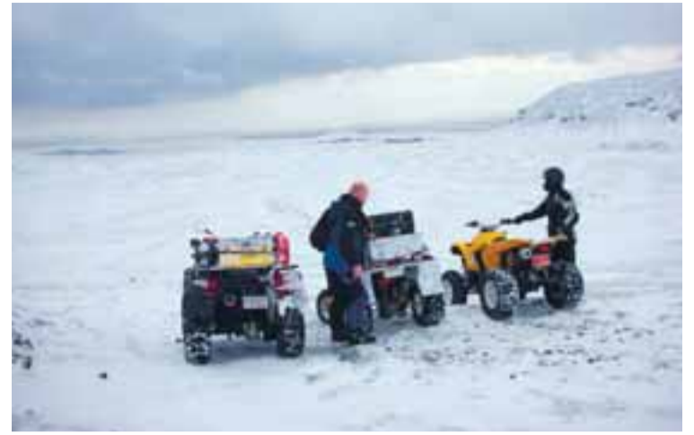
Fjórhjólamenn á Lyngdalsheiði.