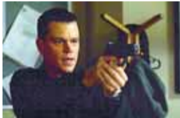
JASON BOURNE Matt Damon mun leika Jason Bourne í fjórða sinn.

Forsala á tónleikana fer fram á midi.is og í versluninni Mohawks.