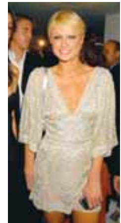
MEÐ HRING Á FINGRI Til Parisar hefur sést með hring á baugfingri, sem hefur komið af stað sögusögnum um mögulega trúlofun.

Af Paris er það annars að fréttu að hún er með nýjan veruleikaþátt í smíðum. Þar verður fylgst með leit hennar að „nýjum besta vini" og er búist við því að hann verði tekinn til sýninga á MTV eða VH1. Ef hamingjan með Benji er svo mikil sem slúður-blöðin vilja láta er þó ólíklegt að Paris vilji skila Nicole sem bestu vinkonu sinni í bráð.