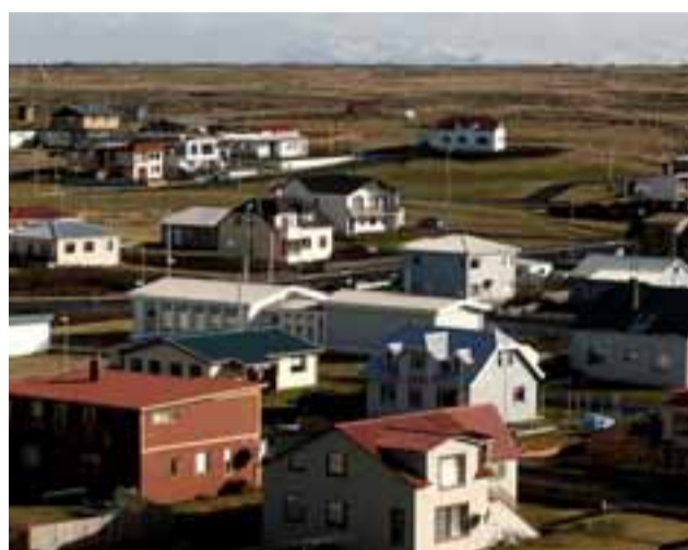
SANDGERÐI Bæjarbúar fá endurgreiddan hluta af útlögðum kostnaði við félagslíf, íþróttir og listnám barna og unglinga.