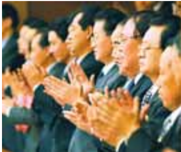
KLAPPAD Í PYONGYANG Tónleikarnir hófust á flutningi þjóðsöngva N-Kóreu og Bandaríkjanna.

Þetta er í fyrsta skipti sem menningarviðburður á vegum Bandaríkjamanna af þessari stærðargráðu er haldinn í N-Kóreu og aldrei fyrr hefur jafn