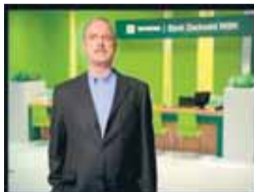
RANDVER HVERGI NÆRRI John Cleese sést hér í pólskri bankauglýsingu.