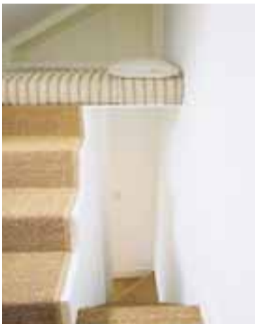
Sisel-teppin fara einkar vel á stigum innan íbúðar og eru hljóðeinangrandi.