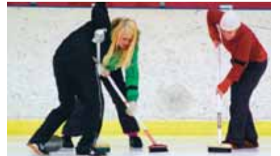
Vetrariþróttir eru fjölmargar. Krulla er ein þeirra og er stunduð bæði á Akureyri og í Reykjavík.

Hvort lið hefur átta steina og hver leikmaður rennur tveimur steinum í hverri umferð. Í leikjum