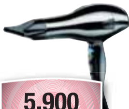
Remington hárbílastari D2009