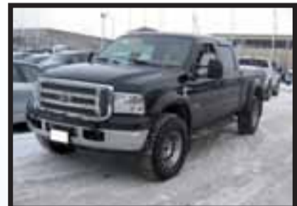
Ford F350 Crew King Ranch, 2006, 40þ.km. 35" Verð 4.290.000.- Tilboð 3.700.000.-