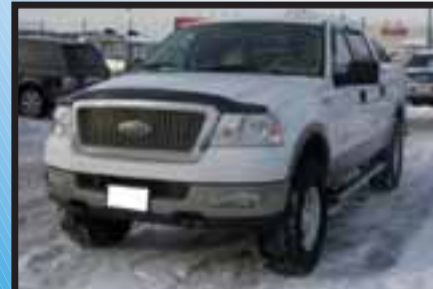
Ford F150 Crew Lariat 2/04, 51þ.km. 35", loftpúðar, camper festingar. Verð 2.800.000.-