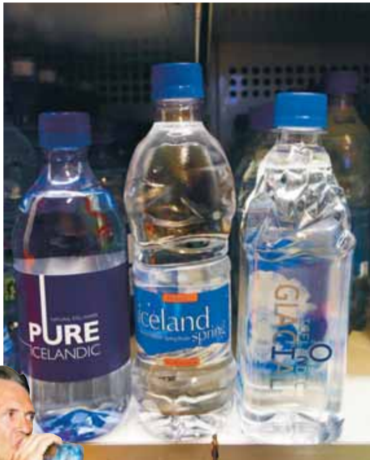
VINSÆL NEYSLUVARA Íslendingar kaupa vatn fyrir 40 milljónir króna á ári, jafnvel þó að óheftur aðgangur sé að sama vatni í öllum krönnum landsins.

Blávatnsdrykkjan á lítið í sykrðu gosdrykkina. Í fyrra seldust 30 milljón lítrar af gosi í íslenskum stórmörkuðum. Kolsýrt vatn, bæði með og án bragðs, er svo alltaf að verða fyrirferðarmeira á drykkjarmarkaðinum. Í fyrra varð 25 prósent aukning á sölu á því og búist er