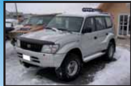
Toyota Land Cruiser 90, 33", 5/99, 190.þkm. sjálfskiptur. Verð 1.590.000.- Tilboð 1.400.000.-