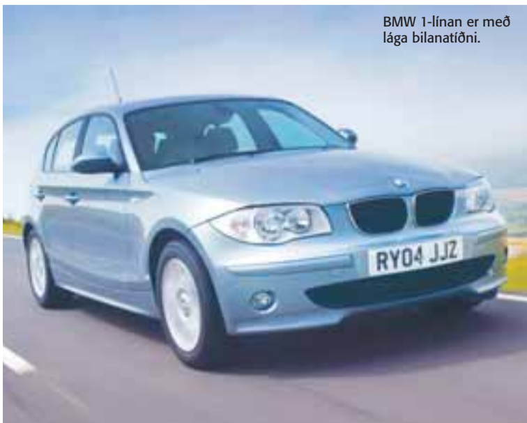
BMW 1-línan er með lága bilanatíðni.