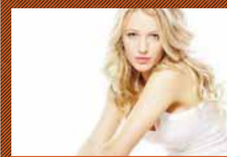
GOSSIP GIRL - kl. 20:15