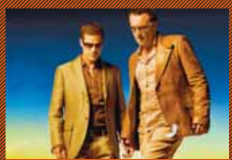
NIP/TUCK - kl. 21:45