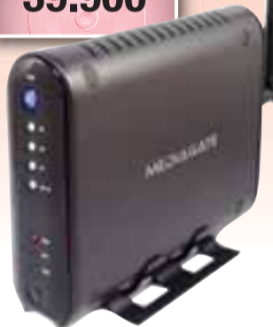
Medigate práðlaus flakkari ásamt 320GB hörðum diskum.