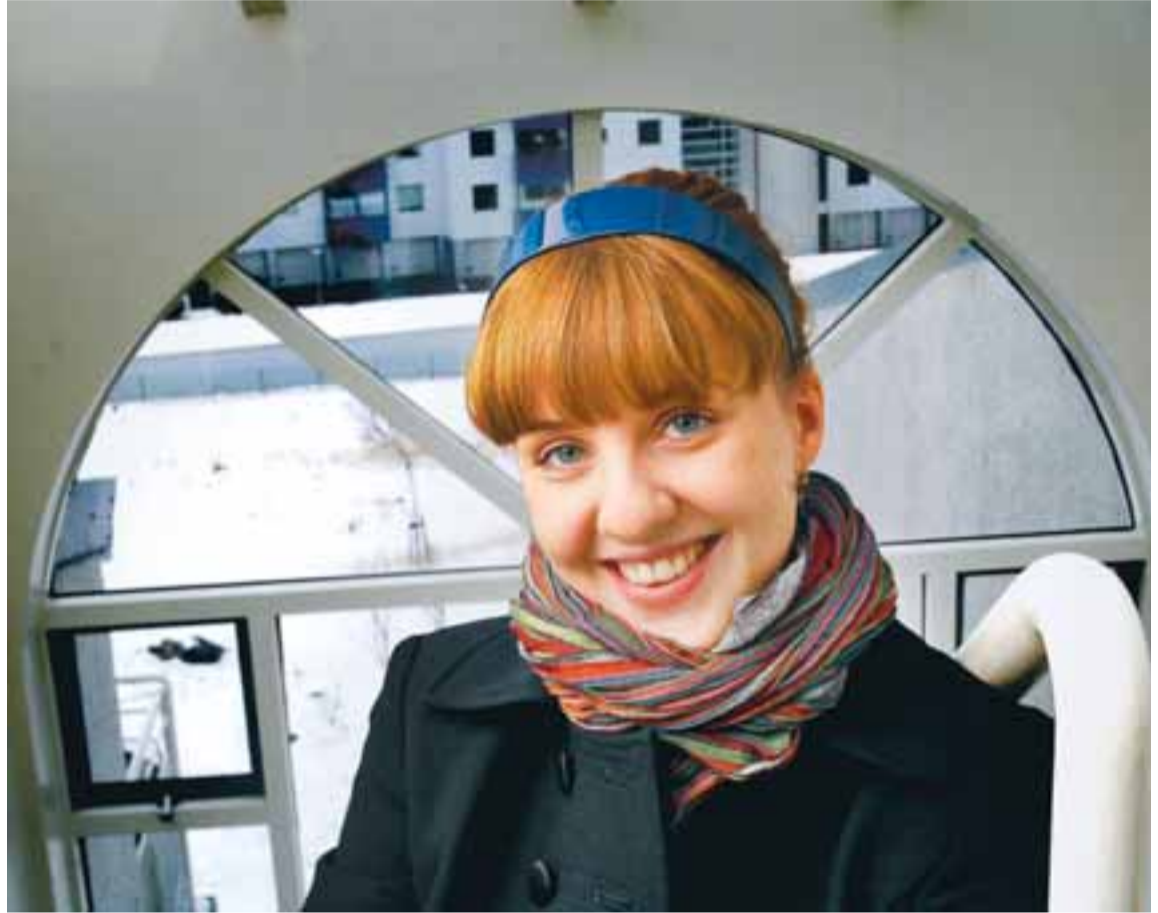
Unu finnst að flestir ættu að heimsækja Indland einhverntíma á lífsleiðinni.