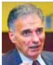
Ralph Nader for- setaframbjóðandi í BNA 74 ára.