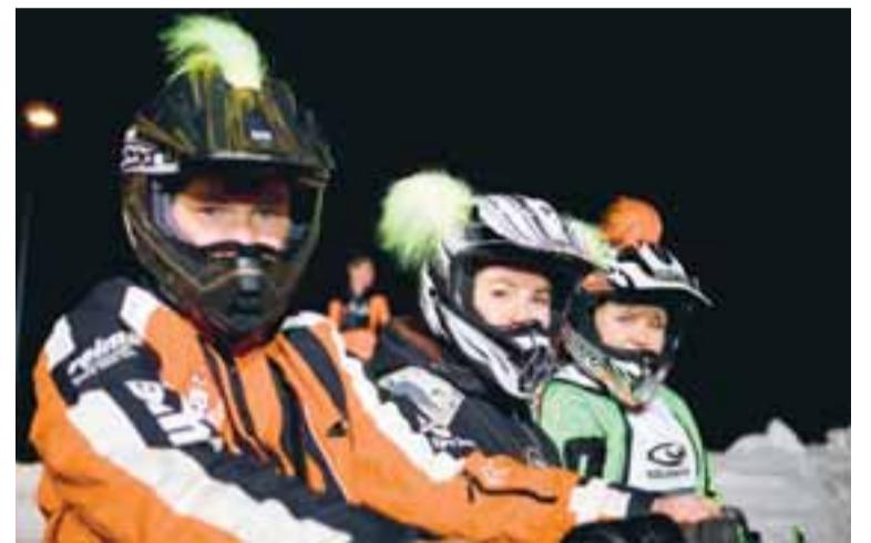
Kynning á keppendum fór fram á Akureyri föstudagskvöldið 22. febrúar klukkan 19 fyrir framan fyrirtækið K2Icehobby, sem er til húsa að Dalsbraut 1.

„Við byrjuðum nokkrar á að fara í Sleðaskóla Laxa á Grenivík.