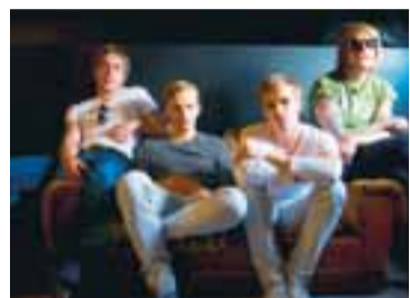
MÍNUS Fyrsta smáskífan af plötunni The Great Northern Whalekill er komin út.