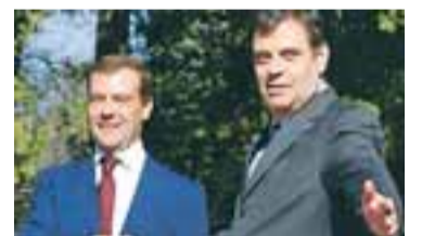
BANDAMENN Serbneski forsætisráðherra Vojislav Kostunica, t.h., heilsar gestinum frá Moskvu í Belgrad.