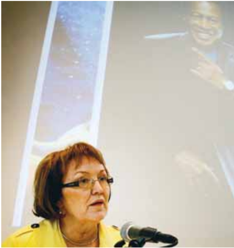
DAGSKRÁIN KYNNT Frá blaðamannafundi Listahátíðar í Hafnarhúsinu í gær.

Dagskrá Listahátíðar í Reykjavík 2008, sem fer fram dagana 5. maí til 15. júní næstkomandi, var kynnt á blaðamannafundi í Hafnarhúsinu í gær. Það verður margt um dýrðir á hátíðinni og verður myndlist gert sérlega hátt undir höfði.