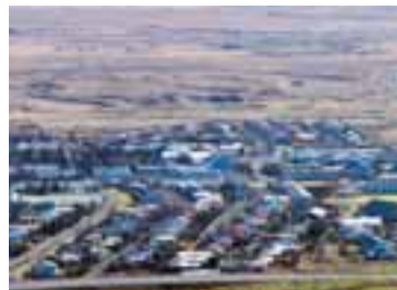
HVERAGERÐI Fasteignamat hækkaði um tólf prósent um áramót og minnihlutinn vill lækka fasteignaskatt um tæpan fimmtung.

Bæjarfulltrúar A-listans svöðu með ítrekun á því að tekjuforsendur myndu ekki breytast þar