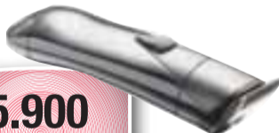
Remington skeggsnyrtir MB910