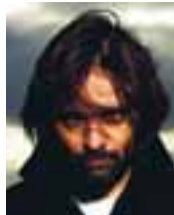
Baltasar Kormákur leikari og leikstjóri 42 ára.