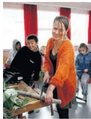
Helga segir að nemendurnir fá mikið að vinna með lifandi efni eins og nýjan við.

Í vetur eru 45 nemendur í skólanum en tveir árgangar eru í hverri bekkjardeild. „Það er auð-