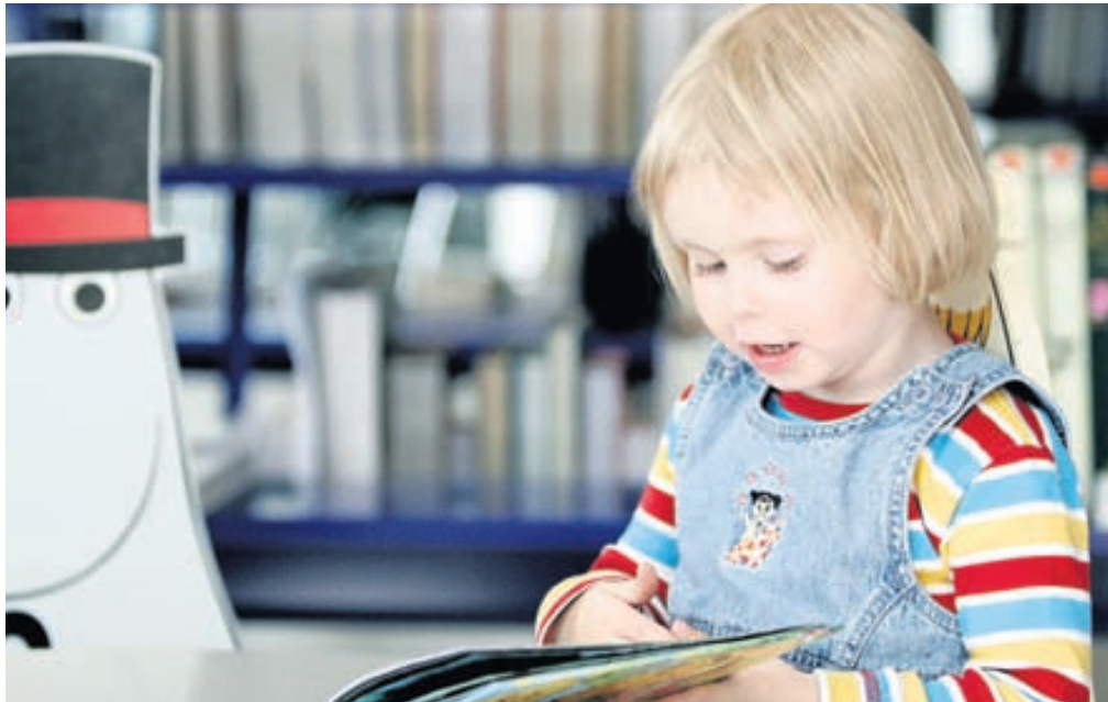
Gaman getur verið fyrir foreldra að rifja upp hvaða bækur voru eftirlæti þeirra í æsku og kynna sögurnar fyrir eigin börnum í dag.