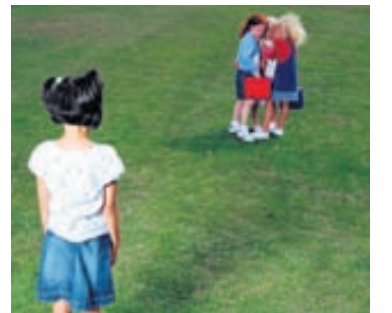
Einelti getur birst á ólíkan hátt og er mikilvægt fyrir foreldra að kynna sér málið og vera vel á verði.