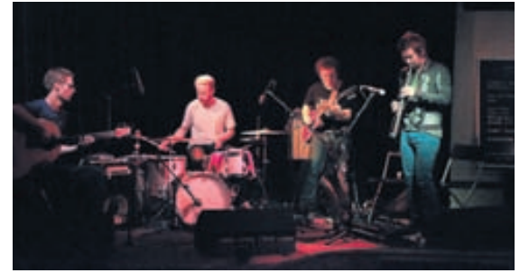
DEFEKT Hljómsveitin Defekt heldur tvenna tónleika hér á landi í vikunni.

Fyrri tónleikarnir verða á Rósenberg á miðvikudag en hinir seinni verða á Græna hattinum á