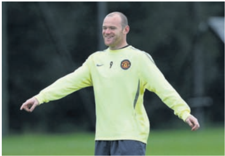
WAYNE ROONEY Brosmildur á æfingu Manchester United í gær.

Riðlakeppni Meistaradeildar Evrópu hefst í kvöld með átta leikjum: