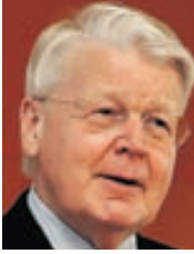
ÓLAFUR RAGNAR GRÍMSSON

STJÓRN MÁL Ólafur Ragnar Grímsson forseti Íslands fór ekki dult með þá skoðun sína, í viðtali við kínverska blaðið Global Times, að almenningur á Íslandi ætti ekki að borga brúsann fyrir Icesave-reikninga Landsbankans.