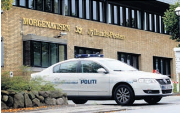
LÖGREGLUVAKT VIÐ SKRIFSTOFUR JÓTLANDSPÓSTSINS Ekki hefur verið útilokað að maðurinn hafi ætlað að ráðast á skrifstofur danska dagblaðsins Jyllandsposten, sem haustið 2006 birti skopmyndir af Múhamed spámanni.

fertugt, með evrópskt eða hugsanlega norður-afrískt útlit og hafði hann dvalið á hótelinu í nokkurn tíma áður en sprengjan sprakk.