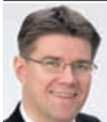
Gunnar Bragi Sveinsson alþingismaður

Málefni kirkjunnar eru mikið rædd sem von er. Ljóst er að æðsti maður hennar um tíma braut gegn þeim sem hann átti að verja og sýna trúnað og komst því miður upp með það í stað þess að svara fyrir gjörðir sínar. Kirkjan hefur brugðist við með því að skýra hvernig hún bregst við málum sem þessum. Fagna ég því að lærdir og leikmenn ætli að gera allt til að viðbrögð við glæpum sem þessum verði rétt. Ég trúir því að barátta þeirra sem brotið var á muni leiða af sér betri kirkju og betra samfélag.