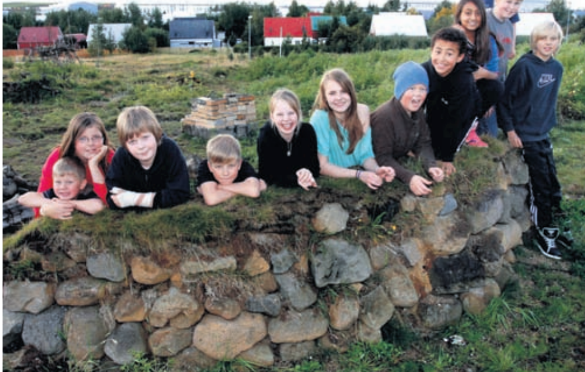
Nemendur skólans eru nú að búa sig undir árlega útikennsluviku sem fer fram upp í Kjós.