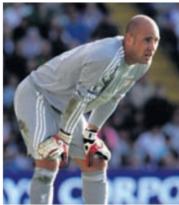
REINA Markvörðurinn öflugur í leik með Liverpool.

Fernandez var samningsbundinn Ciudad Real til loka tímabilsins en það um að verða leystur undir samningi strax. Hann hélt því fram í frönskum fjölmiðlum um helgina að fjárhagsstaða félagsins væri veik. - esá