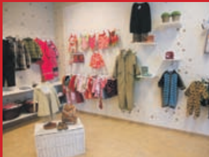
Á facebook: blómabörn barnafataverslun

Verslun með notuð barnaföt Sími 616 1412 Bæjarhrauni 10 Hafnarfirði