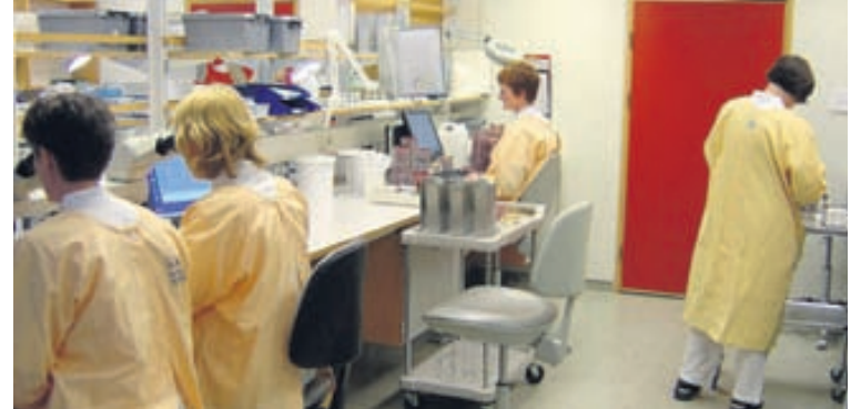
MIKILL LAUNAMUNUR Launakönnun SFR og VR sýnir að fólk á almennum vinnumarkaði þénar allt að 18 prósent hærri laun en þeir sem eru á þeim opinbera.

að kynbundinn launamunur meðal félagsmanna SFR hefur minnkað milli ára, úr 11,8 prósentum í 9,9 prósent. Þó hækkuðu heildarlaun kvenna hlutfallslega minna heldur en heildarlaun karla árið 2009, eða