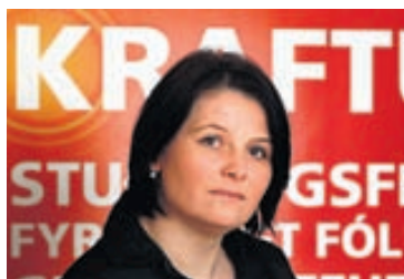
Frá undirritun samningsins.

hverja viku á fimmtudagskvöldum í vetur frá 19.30 til 21.30 og var fyrsti fundur vetrar haldinn síðasta fimmtudag. „Þetta er til-