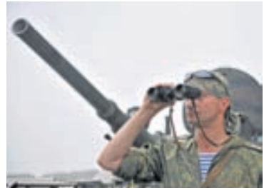
HERMENN Í ÚKRAÍNU Uppreisnarmenn reyna að koma í veg fyrir forsetakosningar.

3 ÚKRAÍNA Uppreisnarmenn í austanverðri Úkraínu hafa beitt hótunum í von um að geta truflað forsetakosningarnar, sem haldnar verða á sunnudaginn. Kjörnefndarmenn hafa fengið líflátshótanir, og nú er svo komið að veruleg hættu virðist geta steðjað að hverjum þeim sem kemur nálægt framkvæmd kosninganna. Jafnvel almennir kjósendur eru orðnir hræddir við að fara á kjörstað, því það geti kostað þá lífið.