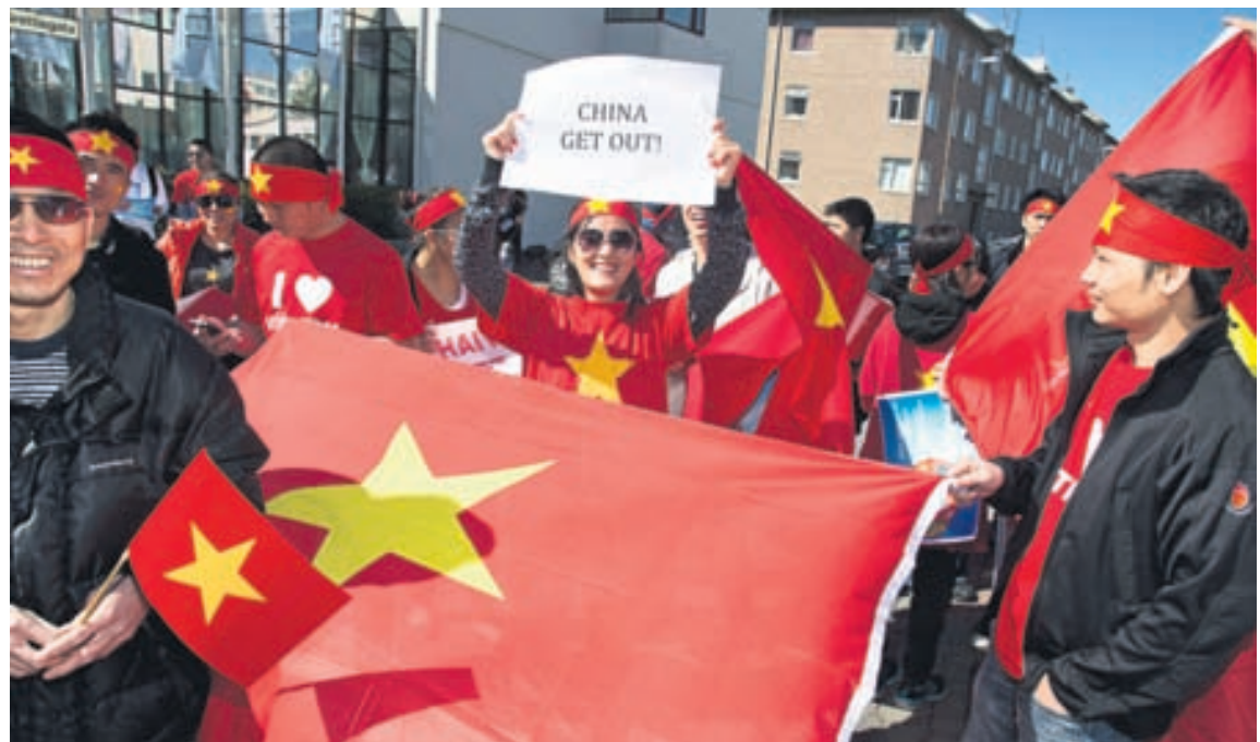
MÓTMÆLI GEGN KÍNVERJUM Vítarnar á Íslandi efndu í gær til mótmæla við utanríkisráðuneytið. Fara þeir fram á stuðning í deilunni vegna olíuborunar Kínverja nærri eyjum sem bæði ríkin gera tilkall til. Sjá síðu 6