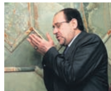
NÚRÍ AL MALÍKÍ Parf næst að mynda starfhæfa ríkisstjórn.

Þetta kemur fram á vefnum gjaldfrelsi.is en þar gefst fólk kostur á að reikna út hve mikið það greiðir í þjónustu borgarinnar við börn. Vinstri græn í Reykjavík opnuðu vefinn í gær en markmið hans er að koma á framfæri helsta kosningaloforði framboðsins sem snýr að gjaldfrjáls- um leikskóla, frístundaheimilum og skólamáltíðum. - sss