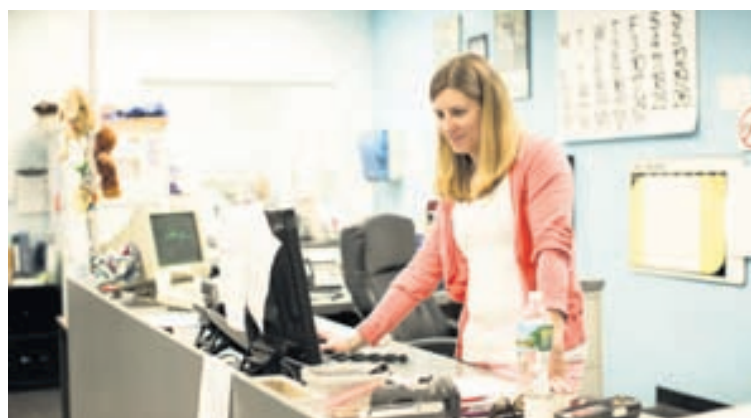
BETRA AÐ STANDA Þegar staðið er í vinnunni í stað þess að sitja verður líkamsstaðan betri og stífleiki í vöðvum minnkar.

Sú einfalda athöfn að standa í stað þess að sitja verður til þess að líkaminn getur brennt tuttugu til fimmtíu fleiri kaloríum á hverjum klukkutíma. Kona sem er sextíu kíló að þyngd brennir 78 kaloríum á klukkutíma á meðan hún situr í rólegheitum. Ef hún situr í átta tíma á dag brennir hún aðeins 624 kaloríum sem er minna en margir innbyrða í kvöldmatnum. Auk þess getur kyrrsetulífsstíll leitt til ofþyngdar og ýmissa heilsufarsvandamála. Jafnvel þeir sem eru duglegir að fara í ræktina utan vinnutíma eru í aukinni hættu ef þeir eyða meiri hluta vökustunda sinna sitjandi.