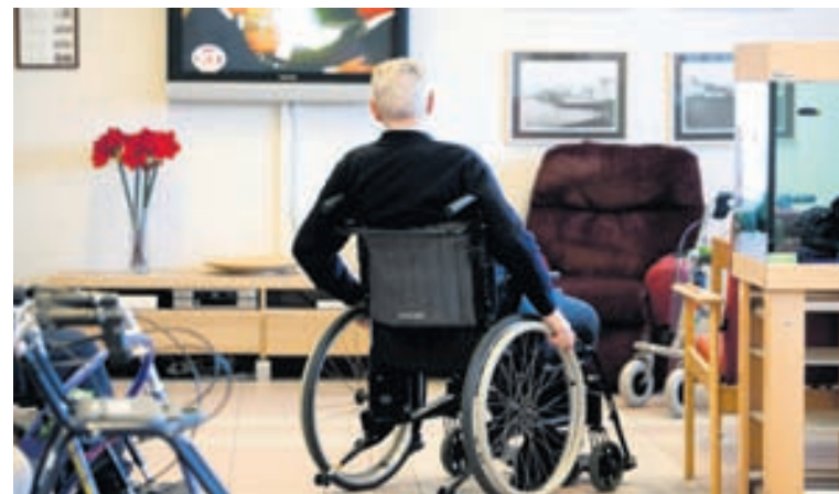
Á HJÚKRUNARHEIMILI 400 til 500 lögðu niður störf í gær.