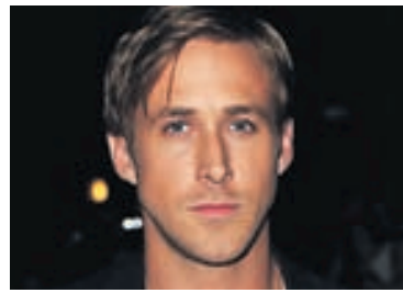
RYAN GOSLING