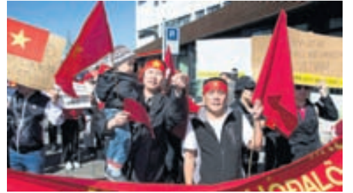
MÓTMÆLI Víetnamar komu saman við utanríkisráðuneytið í gær og mótmæltu meintum yfirgangi Kínverja.

Vegna óeirðanna hafa kínversk yfirvöld flutt yfir þrjú þúsund kínverska ríkisborgara frá Víetnam. Yfirvöld í Víetnam hafa nú hvatt til þess að óeirðunum verði hætt.