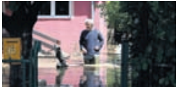
ALLT Á FLOTI Flóðin á Balkanskaganum eru þau verstu í manna minnum.