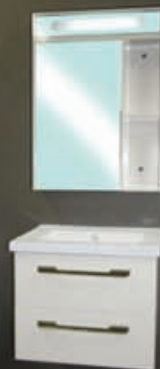
60x46 með handlaug, speglaskáp og ljósi.