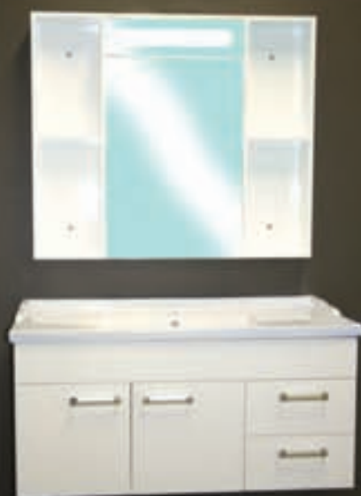
100x46 með handlaug, speglakáp og ljósi.