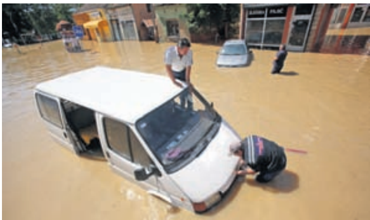
ALLT Á FLOTI Menn reyna að koma bifreið sinni í gang á götu í bænum Obrenovac.