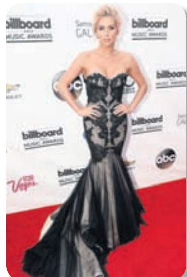
DRAMATÍSK SÖNGKONAN KESHA Í SVÖRTUM SÍÐKJÓL MEÐ SÍÐU SLÖRI.