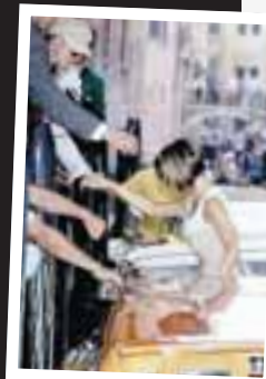
Erfitt Victoria komst varla upp úr síkjabátnum.