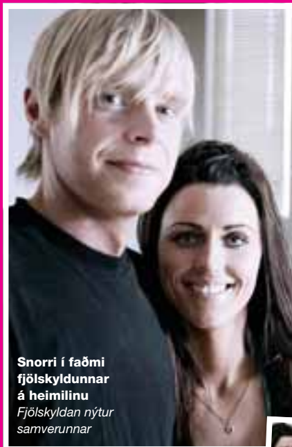
Snorri í faðmi fjölskyldunnar á heimilinu Fjölskyldan nýtur samverunnar

Þú ert léttur yfir því, heyrir ég. „Já, ég fíla það vel.“