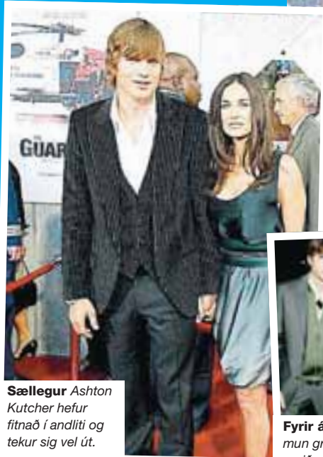
Sællegur Ashton Kutcher hefur fitnað í andliti og tekur sig vel út.

Skötuhiúin tóku sig vel út á rauða dreglinum og augljóst að hjónabandið hefur góð áhrif á kappann. Hann er hefur fitnað svolítið í framan og skeggið er horfið. Það er furðulegt að sjá hann án skeggs. Hann er soldið eins og þrýstinn táningur.