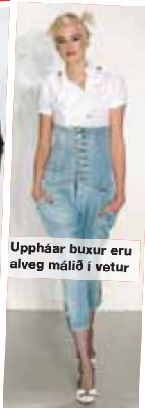
Uppháar buxur eru alveg málið í vetur