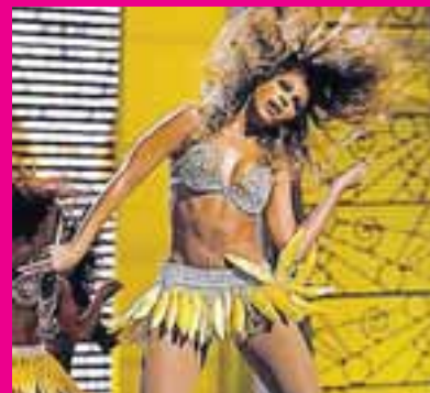
Bananastúlka Litlir og sætir bananar.