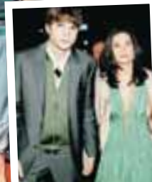
Fyrir ári Ashton var mun grennri áður en parið gifti sig.