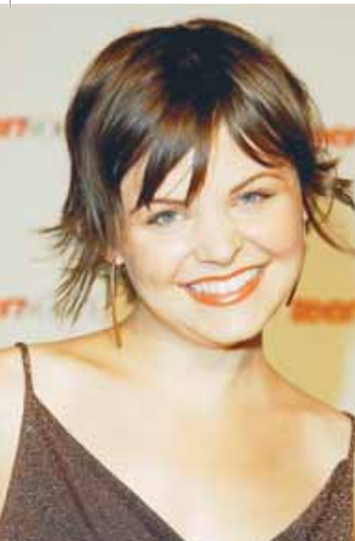
Ótrúlega létt og fersk, með fallega förðun og stelpulega klippingu.