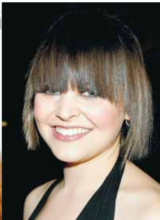
Þessi klipping fer Ginnifer hrikalega illa og förðunin er ekki að gera mikið fyrir hana.