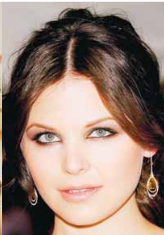
Virkilega elegant með fallega kvöldförðun og hárið í hnút.