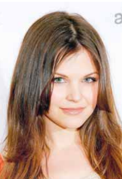
Henni fer mjög vel að vera soldið hippaleg, falleg og liðirnir í hárinu fara henni afskaplega vel.

Ginnifer Goodwin er rétt eins og við hinar, sumir dagar eru bara ekki góðir dagar, og það hvernig við förðum okkur getur skipt sköpum.