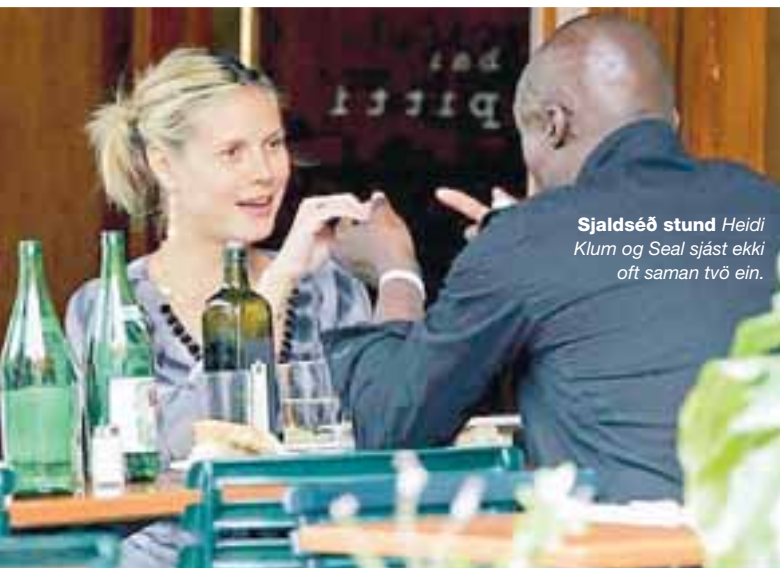
Sjaldséd stund Heidi Klum og Seal sjást ekki oft saman tvö ein.

Posh og Becks voru algjörlega í stíl sem kemur svo sem engum á óvart. Victoria átti í dálitlum erfiðleikum með að komast upp úr síkjabátnum, enda vaggaði hann allur til. Það er ekkert grín að ferðast um Feneýjar á háum hæðum. En daman fékk hjálp og var dregin upp úr bátnum á endanum.