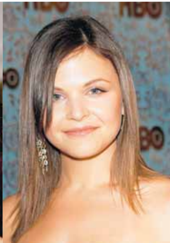
Hér er leikkonan mjög klassísk í útliti en spurning hvort sléttu hárið fer henni vel.