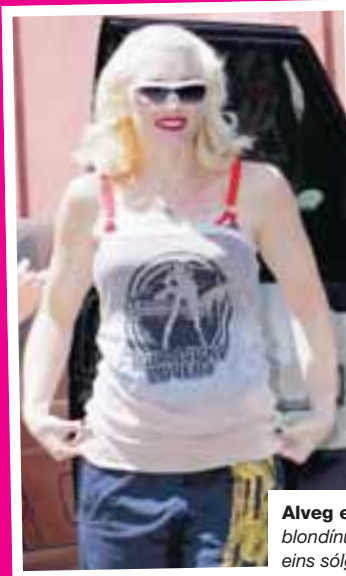
Alveg eins Platínu-blondínur með alveg eins sóglæraugu.

Gwen Stefani og Christina Aguilera eru alveg eins