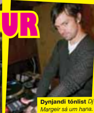
Dynjandi tónlist Dj Margeir sá um hana.