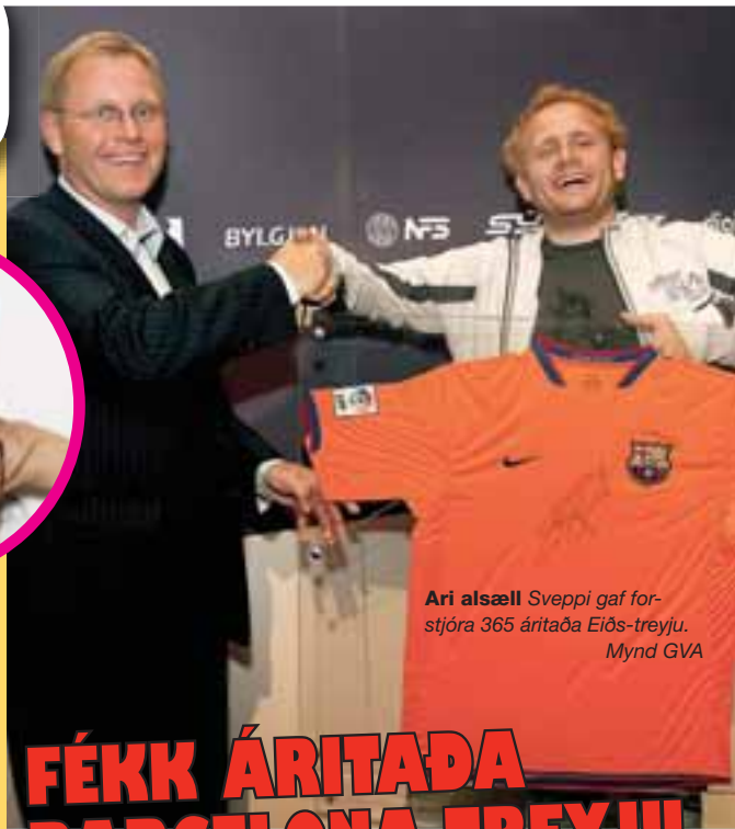
Ari alsæll Sveppi gaf forstjóra 365 áritaða Eiðs-treyju.

„Ég er nú bara búinn að hitta Ellý nokkrum sinnum í kringum undirbúning á X Factor. Hún er ferlega skemmtilegur karakter og hún skefur ekki utan af hlutunum. Það þarf svo ekki að segja neinum að hún fer ekki troðnar slóðir í einu eða neinu.“