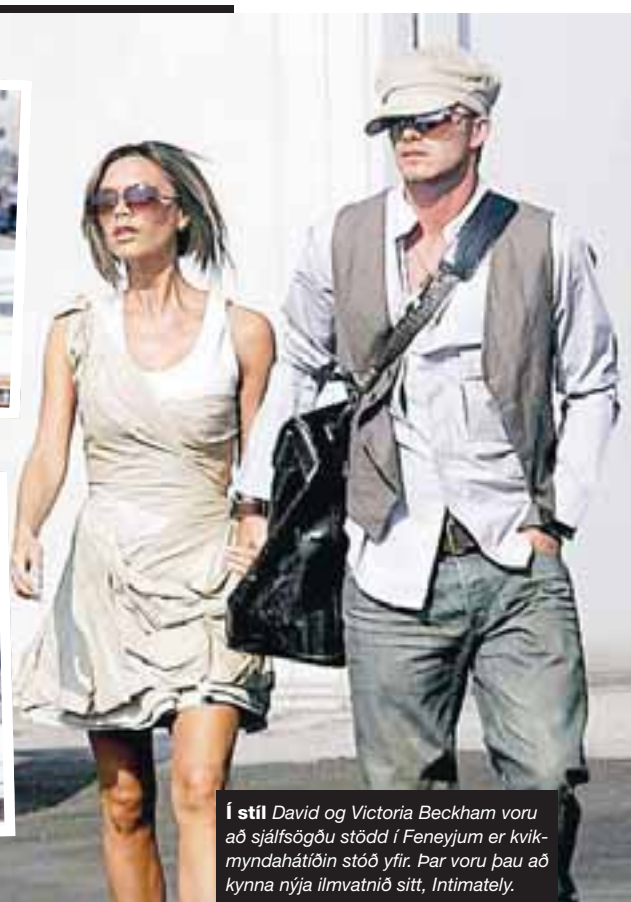
Í stíl David og Victoria Beckham voru að sjálfsgöðu stödd í Feneýjum er kvikmyndahátiðin stóð yfir. Þar voru þau að kynna nýja ilmvatnið sitt, Intimately.

Victoria og David Beckham vilja vera alls staðar og að sjálfsgöðu voru þau mætt á kvikmyndahátíðina í Feneýjum. Þar kynntu þau nýja ilmvatnið sitt, Intimately, sem er bæði fyrir karla og konur.