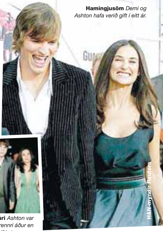
Hamingjusöm Demi og Ashton hafa verið gift í eitt ár.