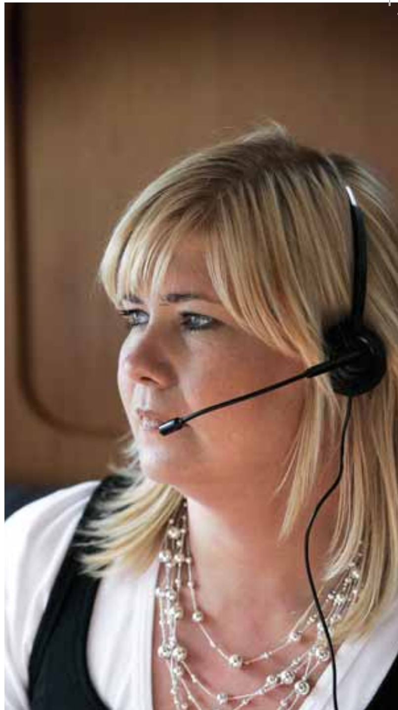
Í símanum Þjálfunin fer fram í gegnum síma, sem hentar vel fyrir fólk á landsbyggðinni.

„Fordómarnir geta orðið svo ríkjandi að for-