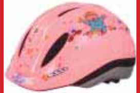
Baby Born kr. 3.660