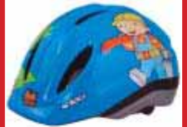
Bubbi byggir kr.