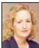
Texti >> Svala Jónsdóttir