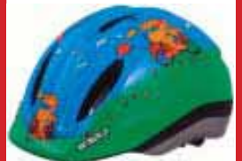
Felix kr. 3.660