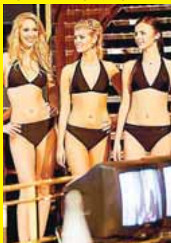
Keppendur komu fram á bikini á skemmtiferðaskipi við Finnland.