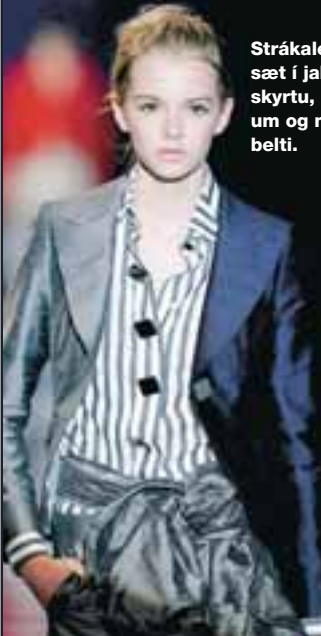
Strákalega sæt í jakka, skyrtu, buxum og með beltí.