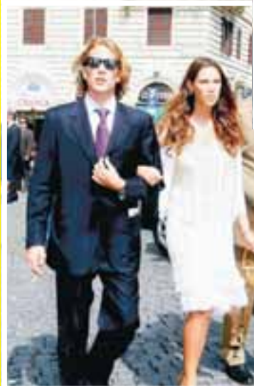
Ungi prinsinn Andrea Casiraghi, syni Karólínu Mónakóprinsessu var boðið í skírni. Hér er hann ásamt Tatiönu Santo Domingo.