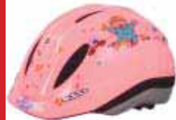
Baby Born kr. 3.660