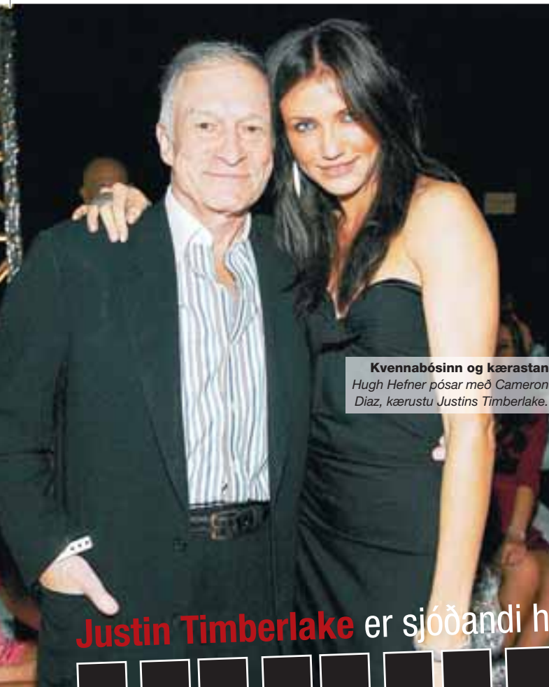
Kvennabósinn og kærastan Hugh Hefner þósar með Cameron Diaz, kærustu Justins Timberlake.