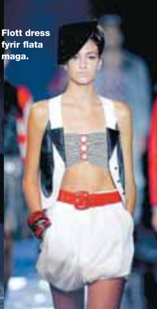
Flott dress fyrir flata maga.

London fashion week var haldin í síðustu viku og var margt og mikið í boði fyrir vor- og sumartískuna. Þar sýndu margir þekktir, hönnuðir, svo sem Julien Macdonald, Jasper Conran, Betty Jackson, Paul Smith og Armani. Armani notaði tækifærið og minnti á góðgerðarstarfsemi til styrktar alnæmissjúkum og fékk marga góða í lið með sér eins og sjá má á myndunum.