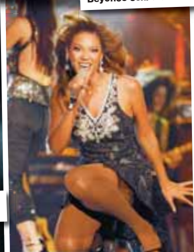
Beyoncé sexí á sviðinu.