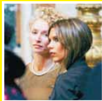
Vinkonurnar mættar Victoria Beckham og vinkona fylgdust grannt með athöfninni.