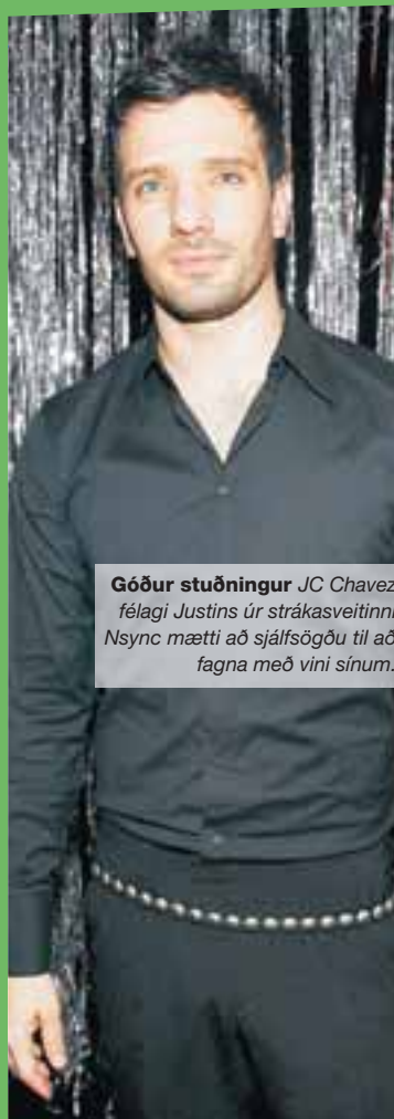
Góður stuðningur JC Chavez félagi Justins úr strákasveitinni Nsync mætti að sjálfsögðu til að fagna með vini sínum.