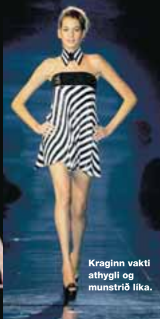
Kraginn vakti athygli og munstrið líka.