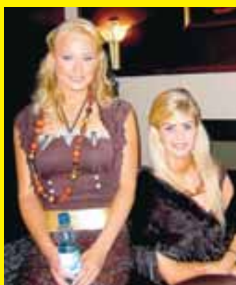
Ungfrú Finnland og Sif, ungrú Ísland.