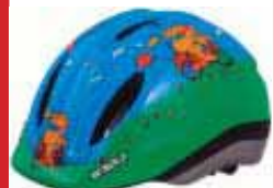
Felix kr. 3.660