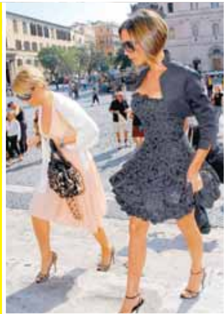
Drottningin Victoria Beckham og Elle MacPherson eru vinkonur og að sjálfsgöðu mætti drottningin. Það er ekki langt að fljúga frá Madrid til Rómar.