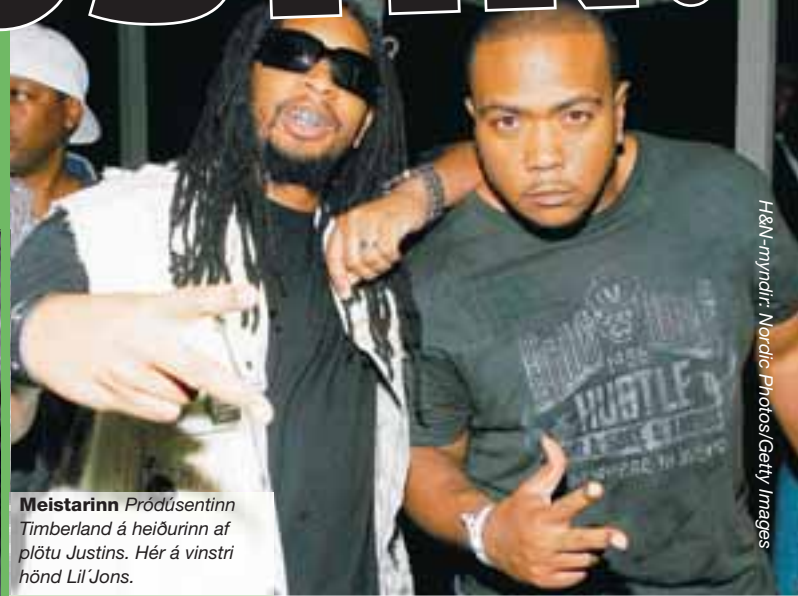
Meistarinn Pröðusentinn Timberland á heiðurinn af plötu Justins. Hér á vinstri hönd Lil'Jon.