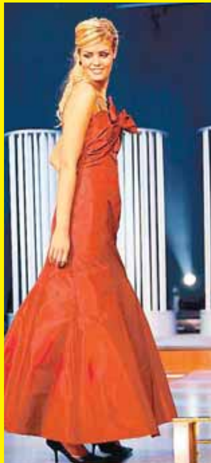
Stórglæsileg í rauðum kjól. Hefur eflaust vakið verðskuldaða athygli.