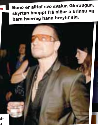
Bono er alltaf svo svalur. Gleraugun, skyrtan hneppt frá niður á bringu og bara hvernig hann hreyfir sig.