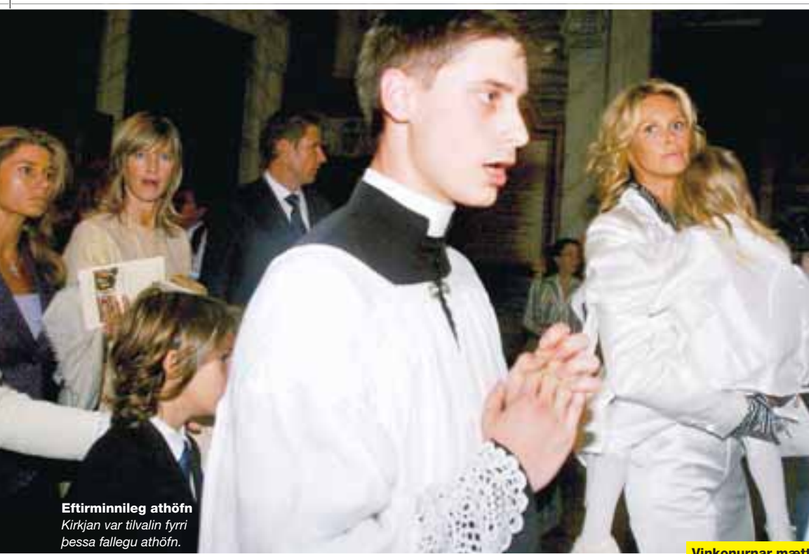
Eftirminnileg athöfn Kirkjan var tilvalin fyrir þessa fallegu athöfn.

E lle MacPherson, eða líkaminn eins og hún er kölluð, á tvö börn ásamt manni sínum Arpad Flynn Alexander Busson. Arpad er athafnamaður og á meiri pening en hann veit hvað á að gera við.