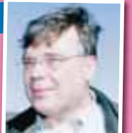
Geir H. Haarde, fæddur 8. apríl 1951.

Varðandi vikuna framundan ert þú minnt/ur á að rasa ekki um ráð fram í ástamáluum af einhverjum ástæðum og láta ekki ástríðuhitann blinda þig. Þú ert án efa sjálfum/sjálfri þér nægastur/nægust og viljasterkastur/viljasterkust en það eflir metnaðargirni þína án vafa. Þú hefur eflaust á tilfinningunni að þú sért fædd/ur til að sigra og það er vissulega staðreynd ef þú leggur þig fram við að hjálpa þeim sem minna mega sín. Hér birtist að sama skapi rólegt frí eftir annasama daga en hér gæti verið um að ræða upplifun eftir vinnudag/ skólalag jafnvel. Upplifðu fögnuð lífsins, sjálft lífsundrið, með þeim sem þú elskar sannarlega herna.