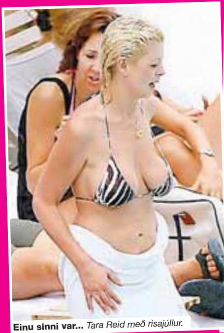
Einu sinni var... Tara Reid með risajúllur.