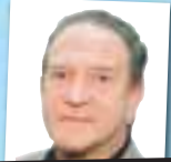
Erró (Guðmundur Guðmundsson), fæddur 19. júlí 1932.

Ef þú þráir eitthvað óhóflega verður þú án efa mjög skjótt óróleg/ur með sjálfínu en ef þú finnur fyrir umræddri líðan ættir þú að huga að því smáa sem þú upplifir daglega með þeim sem þú berð tilfinningar til. Atburðir framundan kalla á hugarfarsbreytingu hjá stömu þinni en þetta eru greinilega breytingar til batnaðar. Ekki flækja annarra máluum við þín eigin í nánustu framtíð er ráðið sem þér er gefið þessa vikuna. En á sama tíma er þér ráðlagt að gripa daginn og breyta tapi í ávinning. Vertu hreinskilin/n gagnvart öðrum og hugsaðu ekki einungis um eigin hag. Góður vinur þinn mun hjálpa þér umtalsvert ef þú gefur viðkomandi tækifæri og hlustar í stað þess að huga að því hvað aðrir aðhafast.