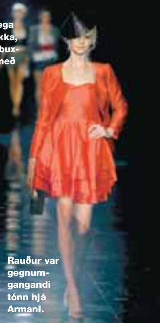
Rauður var gegnumgangandi tónn hjá Armani.