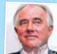
Haldór Ásgrímsson, fæddur 8. september 1947.

Röklega þenkjandi manneskja myndi leita að hlutlægum mælistikum hið ytra ef svo má að orði komast en Meyjan (sem er ávallt huglæg) leitar vikuna framundan til sjötta skilningarvitsins fyrst og fremst. Samhlíða því skaltu huga sérstaklega vel að eigin tilfinningum og samskiptum þínum við aðra (jafnvel átt við fjölskyldu þína hér). Ekki láta aðra hafa áhrif á jafnvægi þitt sem er gott um þessar mundir. Stjarna þín er fær um að skapa alla þá auðlegð sem hana dreymir um ef hún stjórnar orku sinni á jákvæðan máta. Ekki gleyma að hvíla þig þegar þreytan sækir að.