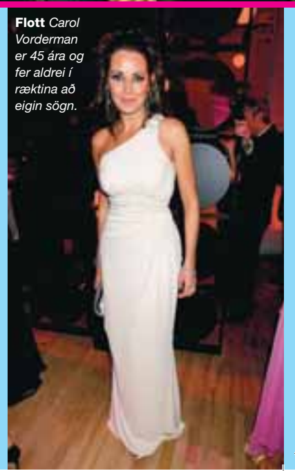
Flott Carol Vorderman er 45 ára og fer aldrei í ræktina að eigin sögn.

Breska sjónvarpsstjarnan Carol Vorderman hefur skrifað vinsælar bækur um hreinsunarkúrinn, en hún fór fyrst á þennan kúr árið 1998. Hún er núna 45 ára og hefur aldrei litið betur út, en eins og hún segir í bókinni Detox for life fer hún á 28 daga kúr tvisvar á ári og heldur sér þannig í formi. Hreinsunin byggist ekki á því að telja hitaeiningar og ekki er nauðsynlegt að einblína á vigtina. Til dæmis segist Carol aðeins vigta sig á þriggja mánaða fresti. Hún fer aldrei í ræktina, en er samt jafn grónn og