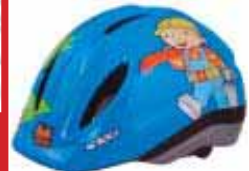
Bubbi byggir kr.