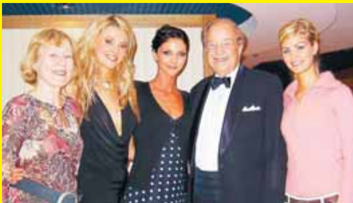
Sigurvegarnir ásamt forsvarsmönnum keppinnar.