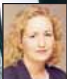
Texti >> Svala Jónsdóttir

„Stórt er ekki endilega betra. Maður á að hlúa vel að því sem maður er með, hvort sem það er verslunarrekstur, makinn, börnin eða námið.“