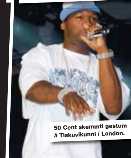
50 Cent skemmti gestum á Tískuvíkunni í London.