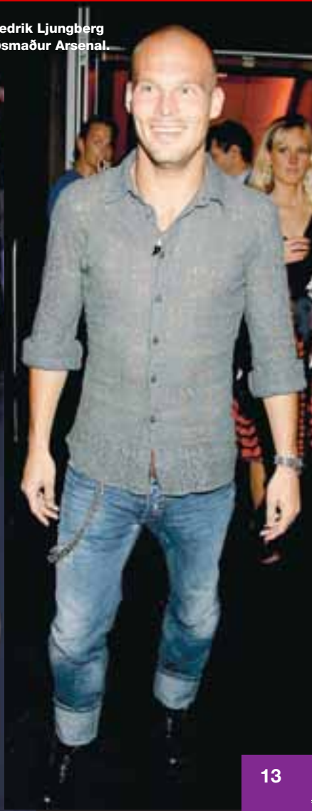
Fredrik Ljungberg liðsmaður Arsenal.