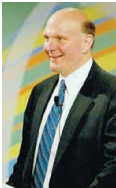
STEVE BALLMER, FORSTJÓRI MICROSOFT CORPORATION Nýjungar frá Microsoft verða kynntar í beinni útsendingu.

Hér á landi munu tæknimenn og forritarar koma saman á ráðstefnu í Smárabíói í Kópavogi þar sem meðal annars verður fylgst með frumsýningunni. Ráðstefnan er fyrst og fremst sniðin að þörfum forritara og tæknimanna sem starfa á vegum sölu- og þjónustuaðila vara frá Microsoft og þeirra sem hafa umsjón með tölvukerfum í atvinnulífinu. - hhs