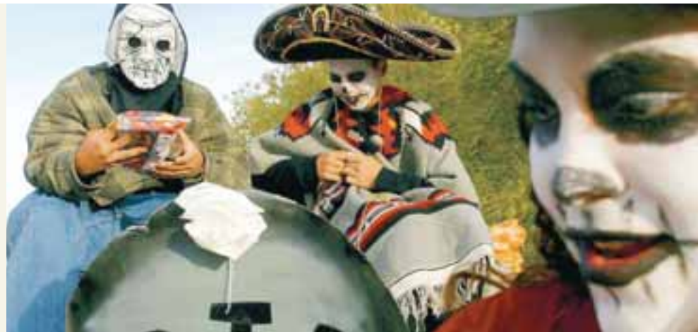
MEXÍKÓSKIR DRENGIR FAGNA HINUM DAUÐU Hauskúpur í hinum ýmsu myndum eru algeng sjón á degi hinna dauðu.

Undirbúningur fyrir hátíðina stendur yfir árið um kring og gjöfum er safnað til að færa þeim látnu. Þegar líður að hátíðinu eru grafir snyrtar og þær eru svo skreyttar með gjöfunum sem safnað hefur verið saman á árinu. Blómkransar eru lagðir á leiðin, leikföng eru færð látnum börnum og flöskur af tekíla eða öðru þeim fullorðnu. Allt er þetta gert til að lokka sálirnar að leiðunum. Sumir eyða jafnvel nóttinni allri við grafir ættingja sinna. Oft er matur eða drykkur sem hafði verið í uppáhaldi þeirra látnu líka fram-