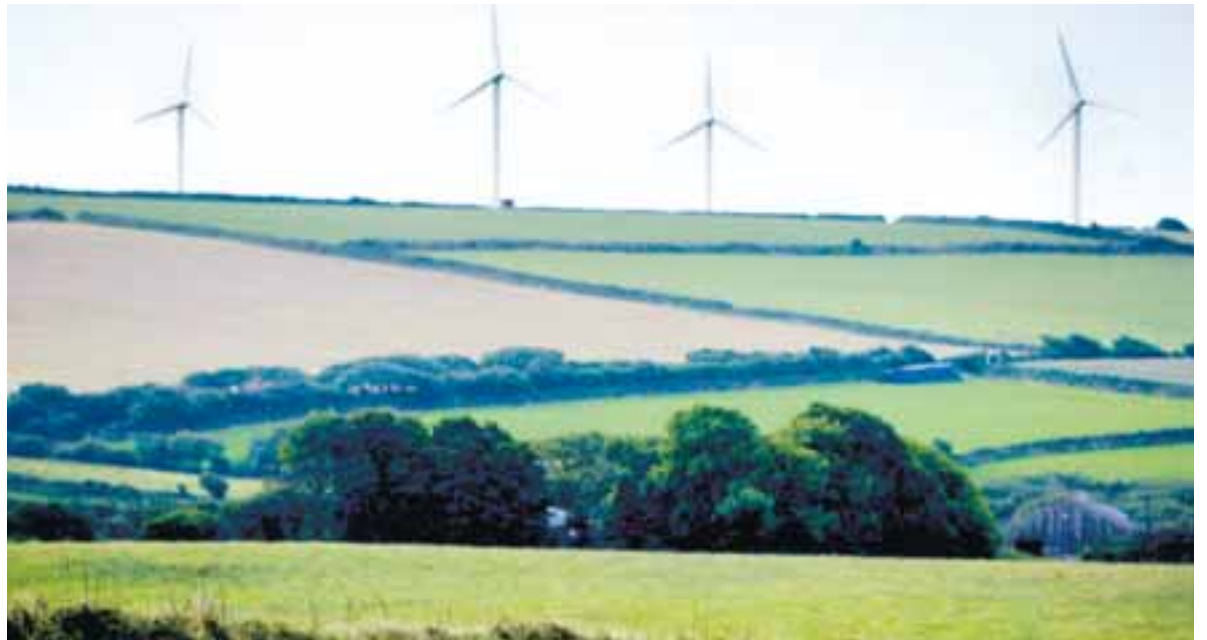
BREYTT HUGARFAR GAGNVART UMHVERFISVÆNNI TÆKNI Vindmyllur eru algengasta gerð umhverfisvænna orkugjafa.