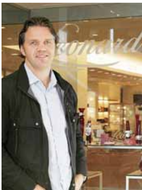
DAGSVERK AUGLÝSINGAR OG HÖNNUN - 5010001