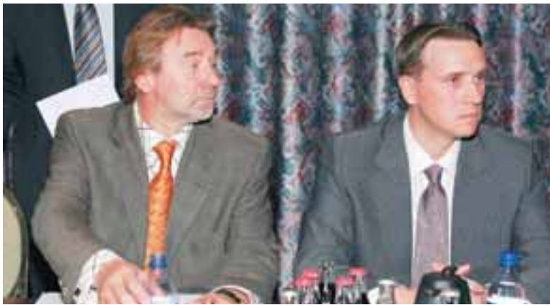
FYRSTA UPPGJÖR SAMEINADS FÉLAGS Straumi-Burðarási er spáð 4.351 milljóna króna hagnaði á þriðja árshluta.

Gengishagnaður spilar stórt hlutverk í uppgjöri félagsins.