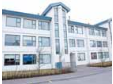
FJÖLBÝLISHÚS Í KÓPAVOGI Getur verið að verðbólga sé ofmetin hér á landi vegna skekkju við útreikninga á vísitölu fasteignaverðs?

„Það er alltaf hættu á að vísitölur ofmeti verðbreytingar, sérstaklega þegar verðmælingar eru miklar. Þessar tölur sem