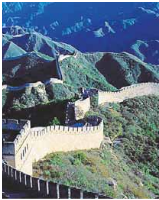
KÍNAMÚRINN Stjórnvöld hafa enn sterkt taumhald á gjaldmiðli landsins.

Fréttir hafa borist af því að Citibank hafi fengið samþykkt tilboð sitt í 85 prósent hlut í kínverskum ríkisbanka. Kínversk stjórnvöld þurfa hins vegar að gefa grænt ljós á kaupin þar sem kveðið er á um að erlend fyrirtæki geti ekki eignast meira en tuttugu prósent hlut í kínverskum bönkum. Kínverjar sækja það fast að ganga í Alþjóða viðskiptaráðið en til þess að það gangi eftir verða stjórnvöld að afnema kvaðir sem takmarka erlenda eignaraðild í kínverskum fjármálafyrirtækjum.