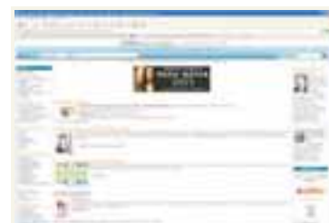
HEIMASÍÐA AMAZON Sala á netinu hefur aldrei verið meiri en í ár.

Umhverfisstofnun Evrópusambandsins hefur gefið út viðvörn þess efnis að löndin sambandsins muni aðeins ná að minnka útblástur gróðurhúsalofttegunda um 2,5 prósent fyrir árið 2012 ef fram heldur sem horfir.