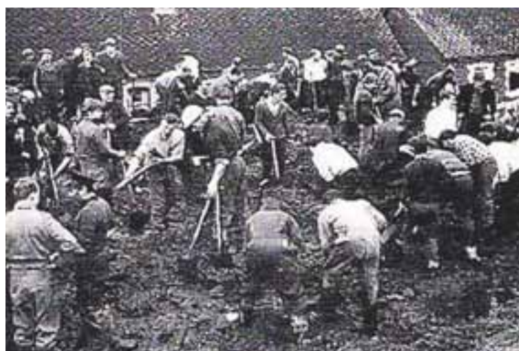
KOLAVINNSLA Stór hluti orkuvera Kínverja er knúinn með kolum.