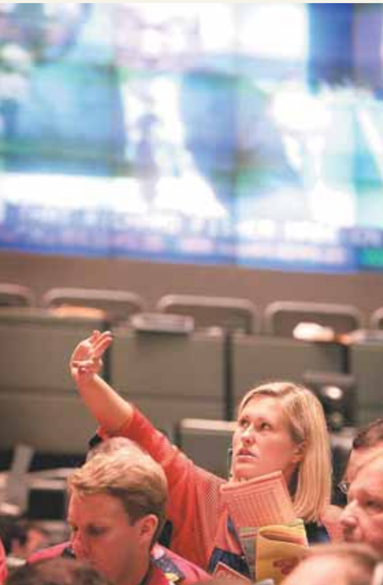
HUGMYNDAFRÆÐILEGUR GRUNNUR Alan Greenspan sagðist 1974 ennþá vera andstæðingur samkeppnislaga eins og kom fram í grein sem birtist í fyrst 1962.

Hlutverk ríkisvaldsins í algjörlega afskiptalausum kapitalíska hagkerfi er að gæta réttar borgaranna. Lögreglan á einungis að beita þá valdi sem brjóta á rétti annarra einstaklinga. Það á t.d. við um glæpamenn og þá sem ráðast inn í landið. Reyndar vildi Ayn Rand líka að ríkið ræki dómstóla til að leysa deilur sem risu milli manna. Í þessum tilvikum þyrfti að beita valdi.