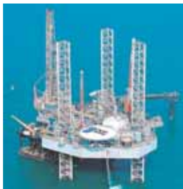
OLÍUBORPALLUR Stutt er í að Brasilíumenn verði sjálfum sér nógrir um olíu.

í Skotlandi verið 1,7 prósent á ári að meðaltali á meðan vöxturinn hefur verið 2 prósent að meðaltali í Evrópusambandinu.