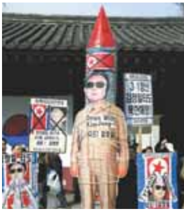
FORSETA N-KÓREU MÓTMÆLT Kim Jong-il hefur líf milljóna samlanda sinna á samviskunni.

Norður-Kóreumenn hverfi frá kjarnorkuvopnaáætlun sinni en takmarkaður árangur hefur orðið af viðræðunum. Kínverjar og Suður-Kóreumenn óttast upplausn Norður-Kóreu sem myndi leiða til þess að flóttamenn flyktust yfir landamærin í milljónavís. Það að Kim Jong-il hefur hafnað erlendri aðstoð mun líklega leiða til þess að íbúar landsins neyðist til að fara út í skóg í leit að hnetum og fræjum til að forðast að deyja úr sulti eins og gerðist fyrir áratug. Þá er talið að meira en milljón manns hafi dáðið úr hungri í landinu.