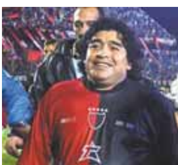
MARADONA Besti knattspyrnumaður heims fyrr og síðar er argentískur.

Einu ári seinna samþykkti dómstóll sjónarmið þeirra og starfsmennirnir hófu framleiðslu í verksmiðjunni að nýju.