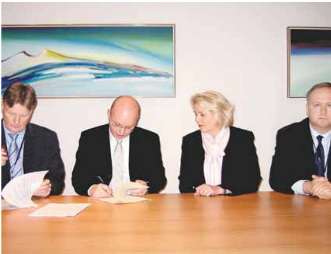
FRÁ UNDIRRITUN SAMNINGSINS Forsvarsmenn Saga Boutique og Flugstöðvar Leifs Eiríkssonar hafa gert með sér samstarfssamning um rekstur nýrra verslana í Fríhöfninni.