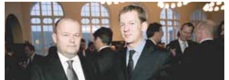
RÚFA 500 MILLJARÐA MÚRINN Markaðsvirði KB banka er komið yfir 500 milljarða.

Hlutabréf í bönkunum hækkuðu mikið á fyrsta viðskiptadegi árs-