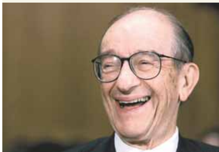
ALAN GREENSPAN Hugmyndafræðilegan grunn byggði Greenspan upphaflega á kenningum Ayn Rand.