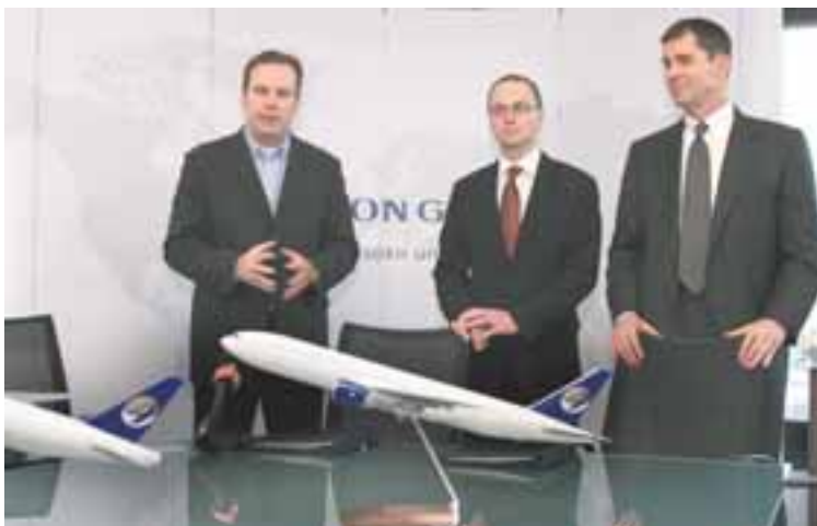
SKRIFAÐ UNDIR KAUPSAMNING Duldar eignir Avion í nýjum flugvélum af gerðinni Boeing 777 gætu numið fimm milljörðum króna.

Á Fjölmiðlavaktinni er gert ráð fyrir að hefja vöktun á netmiðlum á árinu og þá koma bæði til greina fréttamiðlar og einstaka bloggsgíður.