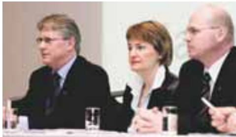
EXISTA SELUR Í SPRON Þriðji stærsti eigandinn hefur selt stofnfjárbréf fyrir 1,4 milljarða króna.

Gera má ráð fyrir að þessi ákvörðun hafi verið tekin þegar Exista fór yfir 20 prósent í KB banka. Eigendur Exista eru meðal annars SPRON og KB banki, sem eiga samtals yfir fjórðung hlutafjár, og þá hafi gagnkvæmt eignarhald verið orðið það