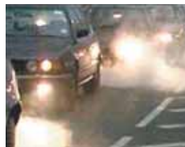
MENGUN Stór hluti gróðurhúsalofttegunda kemur frá bílum.

Bandaríkjamenn, sem búa til mest af gróðurhúsalofttegundum af þjóðum heims, hafa neitað að samþykkja Kyoto-bókunina, sem gerir samninginn að mati