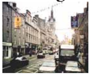
ABERDEEN Skotar þiggja háa styrki frá Englandi.

Síðan Verkamannaflokkurinn tók við völdum í Englandi hafa styrkir til Skotlands hækkað um helming. 4.500 milljarðar runnu til Skotlands á meðan skatttekjur ríkisins þaðan voru 3.700 milljarðar. Mismunurinn nemur 250 þúsund krónum á hvern íbúa í Skotlandi. Hlutfall ríkisútgjalda af heildarefnahag landsins er 52,2 prósent, sem er hærra en meðaltal Norðurlandanna og kemur Skotlandi í fjórða sæti yfir þau lönd sem hæstu ríkisútgjöldin hafa. Aðeins í Svíþjóð, Frakklandi og Danmörku er hlutfall ríkisútgjalda hærra. Frá árinu 1997 hefur hagvöxtur