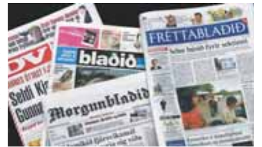
DAGBLÖÐ Fjölmiðlavaktin hefur bætt þjónustu sína með uppfærslu á leitarvél sinni.

Orðrétt handrit úr ljósvakmiðlum standa til boða frá október 2004 en rafrænt efni fjölmiðla frá mars 2005.