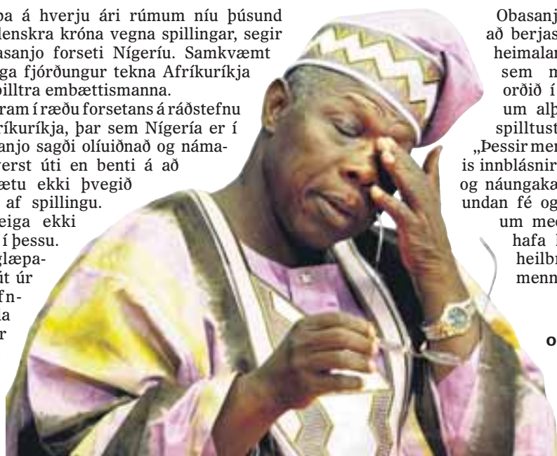
OLUSEGUN OBASANJO NÍGERÍUFORSETI

Yfirvöld gera ekki nokkra tilraun til að grípa í taumana.“