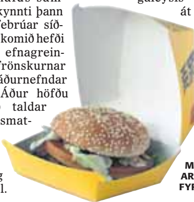
MACDONALDSHAMBORG-ARAKEÐJAN LÁTIN FINNA FYRIR ÞVÍ Hamborgari í kassa.