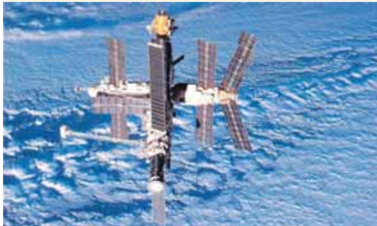
MIR GEIMSTÖÐIN Mir var á sínum tíma stolt Sovétmanna og gleði. Bandaríkjamenn voru í fyrstu grænnir af öfund og voru ekki í rónni fyrir en samningar um að Mir yrði alþjóðleg geimstöð voru undirritaðir.

Það fór svo að lokum að Mir gaf upp öndina. Ákvörðunin var þó umdeild enda hægara sagt en gert að koma viðlíka flykki út í geim. Skynsemin varð þó að lokum tilfinningunum yfirsterkari og Mir var sökk í Kyrrahafið þann 23. mars 2001 eftir fimmtán ára dygga þjónustu. - jsk