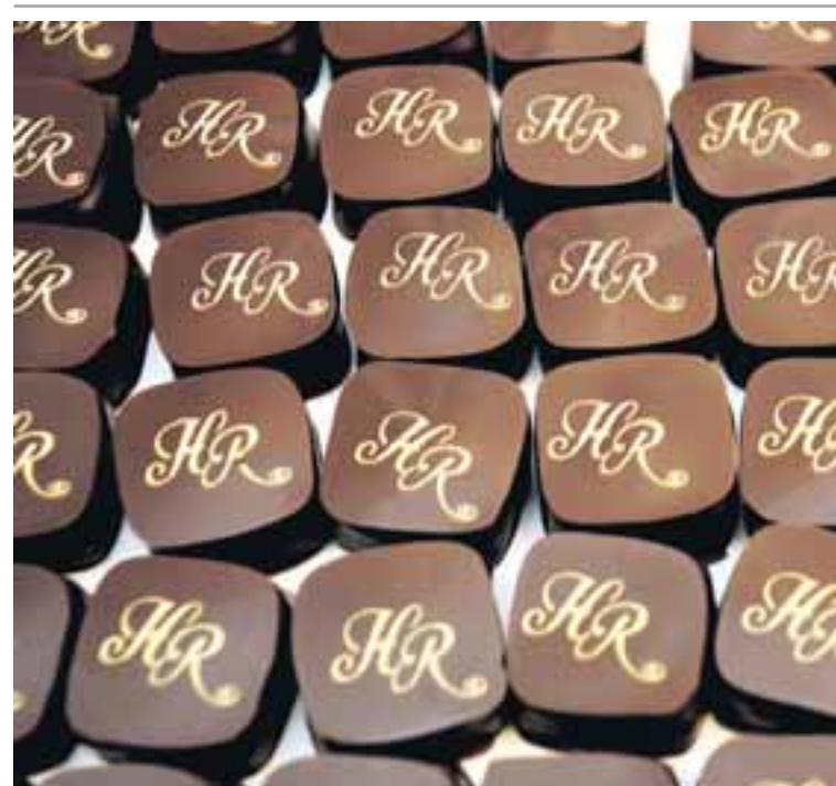
SÚKKULAÐI FRÁ HAFLIÐA RAGNARSSYNI SÚKKULAÐIMEISTARA Ef fram heldur sem horfir verður skortur á súkkulaði eftir tíu til fimmtán ár.