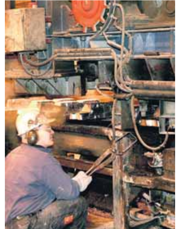
Í ÁLVERINU Á GRUNDARTANGA Árleg framleiðsla nemur nú um 90.000 tonnum á Grundartanga, en þar er fyrirhuguð stækkun um 170.000 tonn. Sú aukning, ásamt þeirri framleiðsluviðbót sem verður með álveri Reyðarfáls, verður til þess að auka árlega framleiðslu hér úr um 270.000 tonnum í 760.000 tonn.

ríkja í heiminum með 3 til 4 prósent af heimsframleiðslu.“