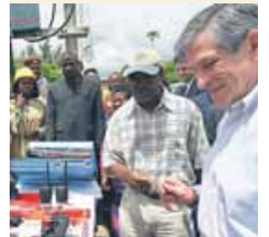
PAUL WOLFOWITZ HEIMSAEKIR OLÍUVINNSLUSTÖÐ Í NÍGERÍA Mikil ólga hefur verið kringum olíuvinnslustöðvar í Nígeríu og truflanir á framleiðslu tíðar. Árásir skæruliða öllu snörpum hækkuðum á heimsmarkaðsverði á mánudag.

Heimsmarkaðsverð á olíu stendur nú í rúmum 61 dal á fatið. -jsk