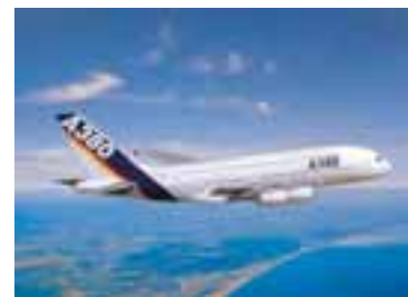
AIRBUS A380 FLUGVÉL Airbus og Indian hafa gert með sér risasamning. Indian mun kaupa fjörutíu og þrjár Airbus-flugvélar á rúma hundruð og fimmtíu milljarða íslenskra króna.

Airbus er að átta tíu prósent hluta í eigu hins franska EADS en breska fyrirtækið