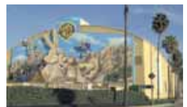
KVIKMYNDAVER WARNER BROS Kvikmyndarísinn ætlar að hefja sölu og dreifingu kvikmynda á netinu í sumar.

Búist er við að dreifing kvikmynda og sjónvarpsefnis með þessum hætti hefjist í sumar og verða 200 titlar í boði. Þegar hefur verið staðfest að á meðal þeirra mynda sem netverjar geta hlaðið niður eru sjónvarpsþáttur-