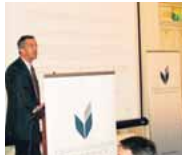
MISHKIN MESSAR YFIR MANNSKAPNUM Starfsmenn erlendra fjármálastofnana og greiningaraðilar lánshæfismatsfyrirtækja fjölmenntu á fund Viðskiptaráðs Íslands sem haldinn var í Lundúnum.

Mishkin áréttaði einnig mikilvægi þess að koma áleiðis til greiningaraðila upplýsingum um íslenskt hagkerfi, og lýsti þeirri skoðun sinni að gagnrýni síðustu missera hafi að stórum