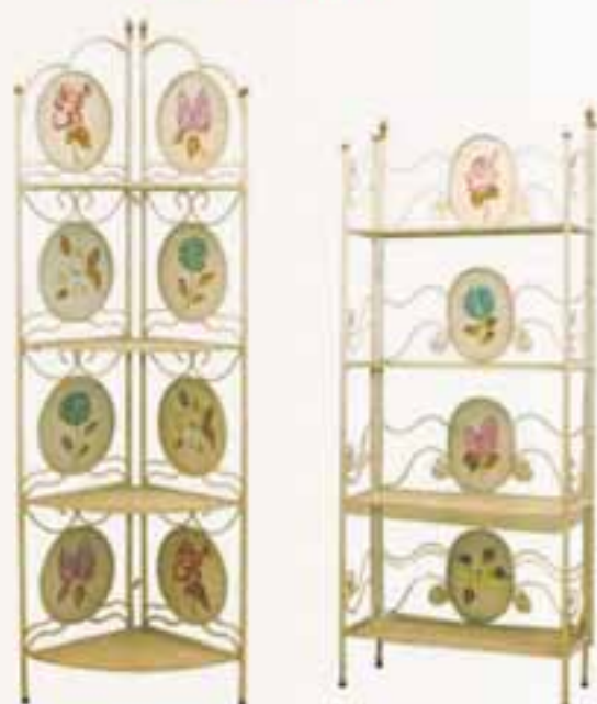
Hornhilla úr járni H 180 x B 60 Verð áður 17.500 Verð nú 13.900