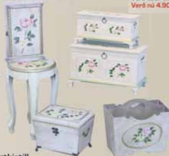
Skartkistill H 20cm x B 30 cm Verð áður 2.500 Verð nú 1.900