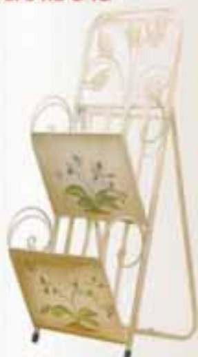
Blaðagrind úr járni H 81 x B 32 Verð áður 4.900 Verð nú 3.900