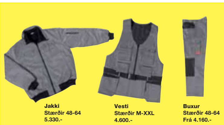
Jakki Stærðir 48-64 5.330.-