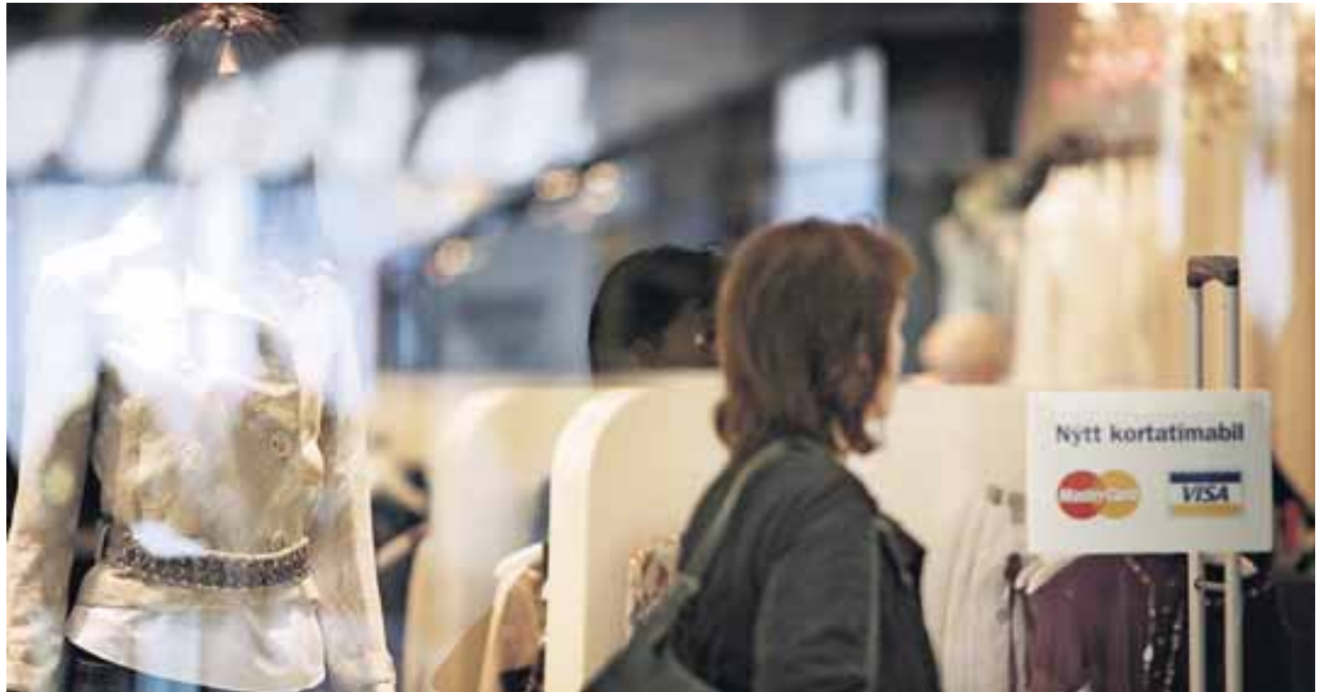
Í VERSLUNARLEIÐANGRI Sérfræðingar segja að með hækkandi verði dragi úr eftirspurn. Um þessar mundir má sums staðar sjá auglýst ný kortatímabil í verslunum, en þeir reikningar koma ekki til greiðslu fyrr en í júlí. Greiningardeildir bankanna spá því að verðbólga nái hámarki í næsta mánuði.