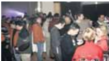
Í ELDBORG blaðamennirnir sem Nokia bauð hingað til lands til að vera við afhjúpun „sportsímans“ voru margir fulltrúar margvíslegrar útivistar og íþróttatimarita.

Síminn heitir 5500 Sport og er sérsníðinn að þörfum þeirra sem stunda íþróttir og útivist. Þannig er hann sérlega höggþolinn og