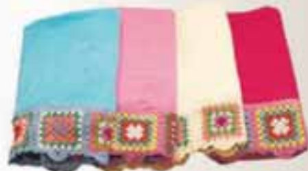
Handklæði með hekludum bekk, 110 cm X 60 cm Verð áður 1.400 Verð nú 840