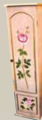
Hár skápur H 115 x B 30 Verð áður 9.800 Verð nú 3.900