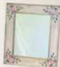
Spegill 55cmx67cm Verð áður 7.000 Verð nú 3.900