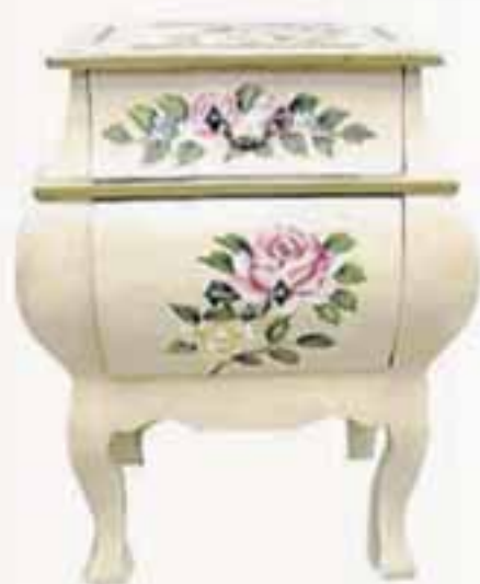
Náttborð : h70cmxd40cmxb50 Verð áður 11.900 Verð nú 5.900