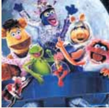
PRÚÐULEIKARARNIR Brúður Jims Henson slógu í gegn í sjónvarpi um allan heim á árunum 1976 til 1981.

Þegar sýningu þáttanna lauk ýtti hann úr vör fræðsluþáttum fyrir börn, Sesame Street, árið 1969 og voru þeir sýndir í sjó ár.