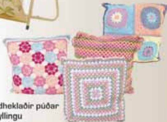
Handhekladír púðar m/fyllingu Áður 995 Verð nú 495