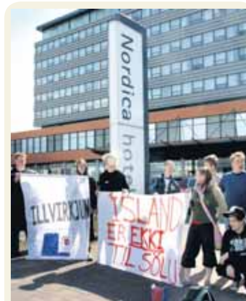
STÁL GEGN ÁLI Ungt fólk þandi stálstrengi gítara fyrir utan Nordicahótelíð þar sem hringborð Economist fór fram. Innandyra var allt með kyrrum kjörum.