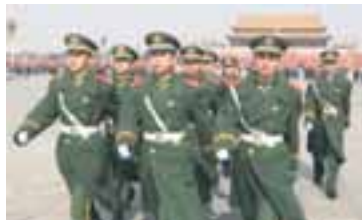
FRÁ TORGI HINS HIMNESKA FRÍÐAR Kínverjum er meinað að gagnrýna yfirvöld í skrifum sínum á netinu.

Robin Li, forstjóri Baidu.com, segir viðtökurnar við alfræðiritinu hafa verið afar góðar í Kína. Hins vegar sagðist hann ekki hafa neina vitneskju um að yfirvöld í Kína hefðu meinað fróðleiksfúsum Kínverjum aðgang að