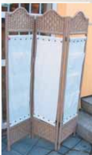
Ping Fang úr basti með lérefti og vösum 50%afsláttur Verð nú 2.900