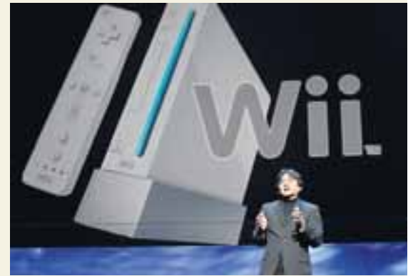
NÝJA LEIKJATÖLVAN Satoru Iwata, forstjóri Nintendo, kynnti gestum á E3 tölvuleikjasýningunni nýjustu tölvu fyrirtækisins.