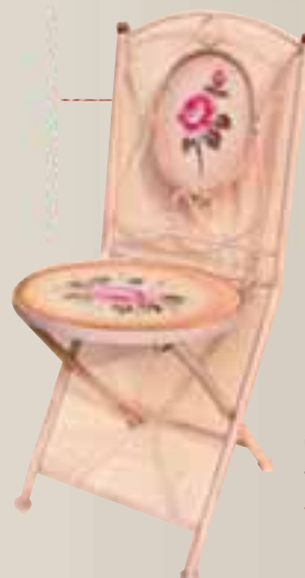
Járnstóll Verð áður 8.900 Verð nú 5.900