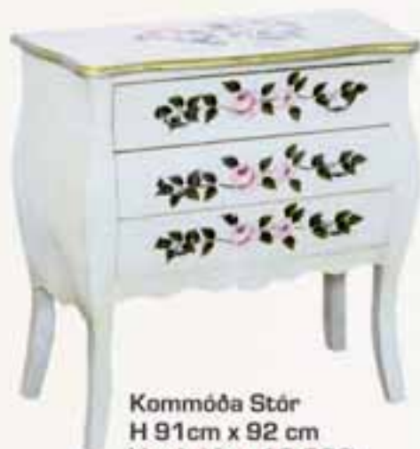
Kommóða Stór H 91cm x B 92 cm Verð áður 19.000 Verð nú 9.900