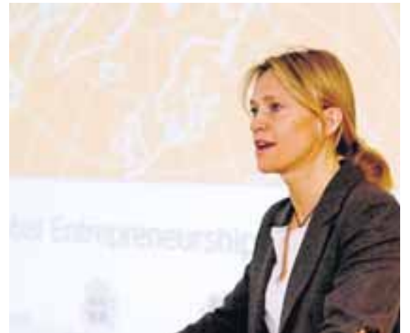
ÞORGERÐUR KATRÍN GUNNARSDÓTTIR Menntamálaráðherra ávarpaði gesti á morgunverðarfund í HR þar sem alþjóðleg skýrsla um umfang frumkvöðlastarfsemi hér á landi í fyrra var kynnt. Í skýrslunni kemur fram að 20.000 manns stunda frumkvöðlastarf á Íslandi.

Þorgerður Katrín Gunnarsdóttir menntamálaráðherra sagði niðurstöður rannsóknarinnar fagnadarefni. Sýni þær að marga Íslendinga dreymi um að verða sjálfs síns herrar og láti margir þann draum rætast. Þá sagði hún skýrsluna sýna að frumkvöðlar hér á landi ættu í samkeppni við útlönd. Sagði hún nauðsynlegt að styðja við frum-