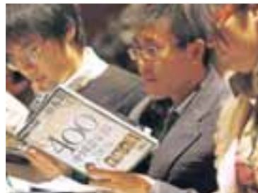
RÝNT Í LISTA FORBES 37 ára verslanakeðjueigandi er ríkasti maður Kína, að mati Forbes.

Bandaríska vikuritið Time segir ævisögu Hungs vera líkasta ævintýri um mann sem brýst úr fátækt til frama. Hann hætti í skóla 16 ára gamall, keypti raftæki frá verksmiðjum í suðurhluta Kína og seldi í götubási í Peking. Hung hafði betur í baráttunni við keppinautana um lægsta verðið og færði fljótlega út kvíarnar. Nú rekur hann um 420 verslanir víðs vegar