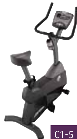
C1-5 kr. 129.000

Life Fitness þrekhjólin eru afar vönduð tæki og henta þeim sem vilja með einföldum hætti ná upp þreki og halda sér í formi án þess að leggja of mikið á liðamótin.