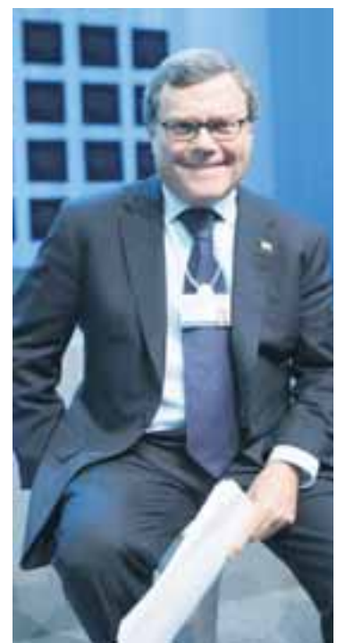
MARTIN SORRELL Forstjóri breska auglýsingafyrirtækisins WPP hefur ástæðu til að brosa. Forstjórnin Sir Martin Sorrell er launahæsti forstjóri Bretlands með 17,1 milljón pund eða rúmlega 2,2 milljarða krónur í árslaun.

Bónusgreiðslurnar eiga mestan þátt í hækkuninni. Í fyrra gátu bónusar forstjóranna tvöfaldað launin en nú nema þeir 130 prósentum. Hækkunin á síðastliðnum sex árum nemur hins vegar 102,2 prósentum hjá bresk-