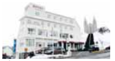
HÓTEL KEA AKUREYRI

Litið til síðustu níu mánaða fjölgaði gistinottum um ellefu prósent milli ára. Fjölgun varð á öllum svæðum en hlutfallslega var hún mest á samanlögðu svæði Suðurnesja, Vesturlands