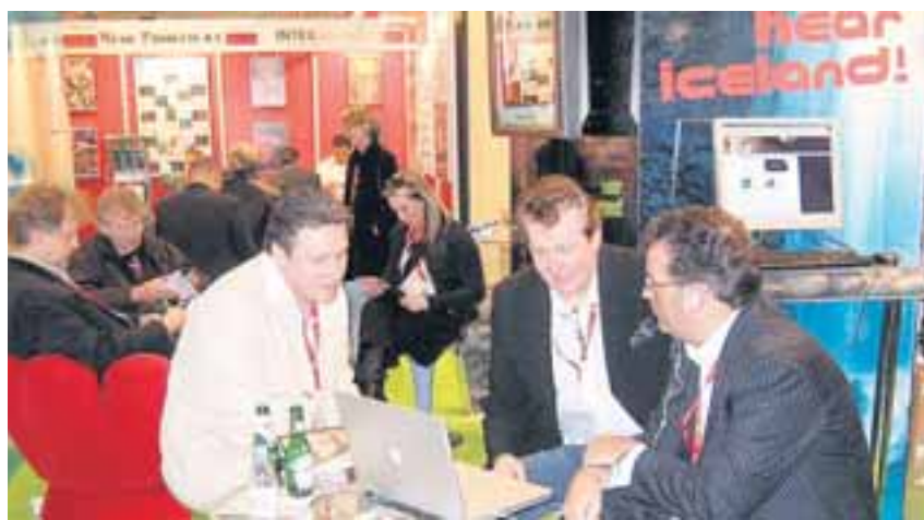
FRÁ TÓNLISTARRÁÐSTEFNUNNI MIDEM Í CANNES Undanfarin þrjú ár hefur Samtónn, samstarfsvettvangur tónrétthafa á Íslandi, í samstarfi við Útflutningsráð, staðið fyrir þátttöku íslenskra tónlistarmanna í einni stærstu tónlistarráðstefnu heims.

Það fyrsta af fimm sviðum sem hópurinn taldi að þörf væri á aðgerðum á er þekking og nýsköpun innan skapandi atvinnugreina. Hópurinn taldi jafnframt nauðsynlegt að auka samstarf, annars vegar milli skapandi atvinnugreina og hins vegar milli þeirra og annarra atvinnugreina. „Þegar tölvuleikur er búinn til tengjast til að mynda nokkrar skapandi atvinnugreinar. Við teljum möguleika fólga í því að tengja betur þekkingu atvinnuveganna á milli og milli þeirra og hefðbundinna atvinnugreina.“ Þá þykir hópunum stuðning skorta við að hasla sér völl á erlendum mörkuðum þar sem kostnaður við að ná til heimsins sé gífurlegur og töluverða stærðarhagkvæmni þurfi í þeirri dreifingu. Telja þau meðal annars að hægt sé að ná henni fram með því að byggja á norrænu viddinni. Í síðasta lagi nefna þau að hvetja þurfi til fjárfestinga í skapandi atvinnugreinum.