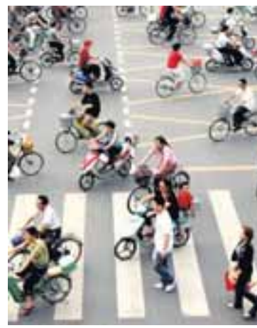
GÖTUMYND FRÁ KÍNA

Aukinn hagvöxtur í Kína og þar með meiri neysla sjávarafurða hefur ekki einungis jákvæð áhrif fyrir íslensk fyrirtæki því