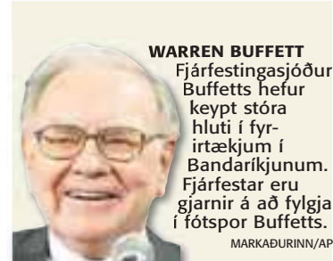
WARREN BUFFETT Fjárfestingasjóður Buffetts hefur keypt stóra hluti í fyrirtækjum í Bandaríkjunum. Fjárfestar eru gjarnir á að fylgja í fótspor Buffetts.

inn keypti í var stór hlutur í bandarísku lágvörversluninni Target, þeirri næststærstu á eftir verslanakeðjunni Wal-Mart, og hreinlætisvöruframleiðandanum Johnson & Johnson.