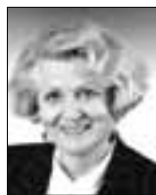
Salome Þorkeldsdóttir fyrrv. forseti Alþingis