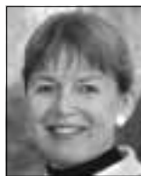
Sigríður Anna Þórðardóttir þingmaður