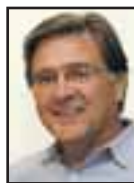
Þorsteinn Pálsson, ritstjóri Fréttablaðsins og fv. forsætisráðherra