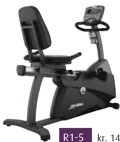
R1-5 kr. 149.000