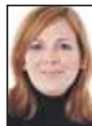
Stjórnandi pallborðsumræðna Halla Tómasdóttir, frkvstj. Viðskiptaráðs Íslands