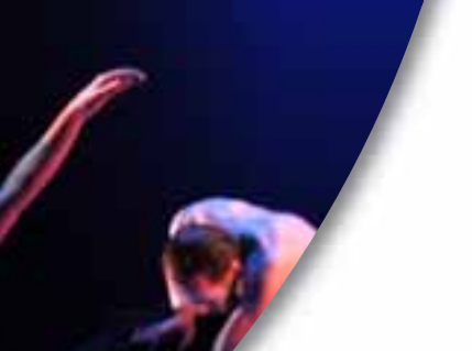
SKAPANDI ATVINNA Umfang menningar í atvinnulífinu fer ört vaxandi og stendur hún nú undir um fjórum prósentum af landsframléiðslu.