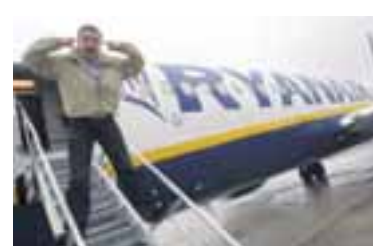
MICHAEL O’LEARY Forstjóri Ryanair hefur boðað uppsagnir á starfsfólki kaupi flugfélagið Aer Lingus. Stjórnarformaður Aer Lingus biður hluthafa um að skrifa ekki undir neitt.