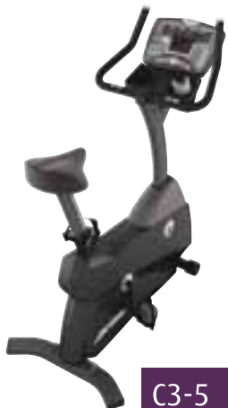
C3-5 kr. 199.000