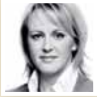
Hanna Birna Kristjánsdóttir forseti borgarstjórnar, Reykjavík

„Allt frá því ég kynntist Ragnheiði Elínu hef ég dáðst að krafti hennar, bjartsýni og baráttugleði. Ég hef lengi vonað að hún tæki ákvörðun um að nýta þessa eiginleika sína, auk viðtækrar þekkingar og reynslu, enn frekar í þágu samfélagsins, stjórnmalanna og Sjálfstæðisflokksins. Nú hefur það gerst og ég er sannfærð um að Ragnheiður Elin mun standa undir öllum okkar væntingum og verða þingmaður og forystumaður sem mikið munar um.“