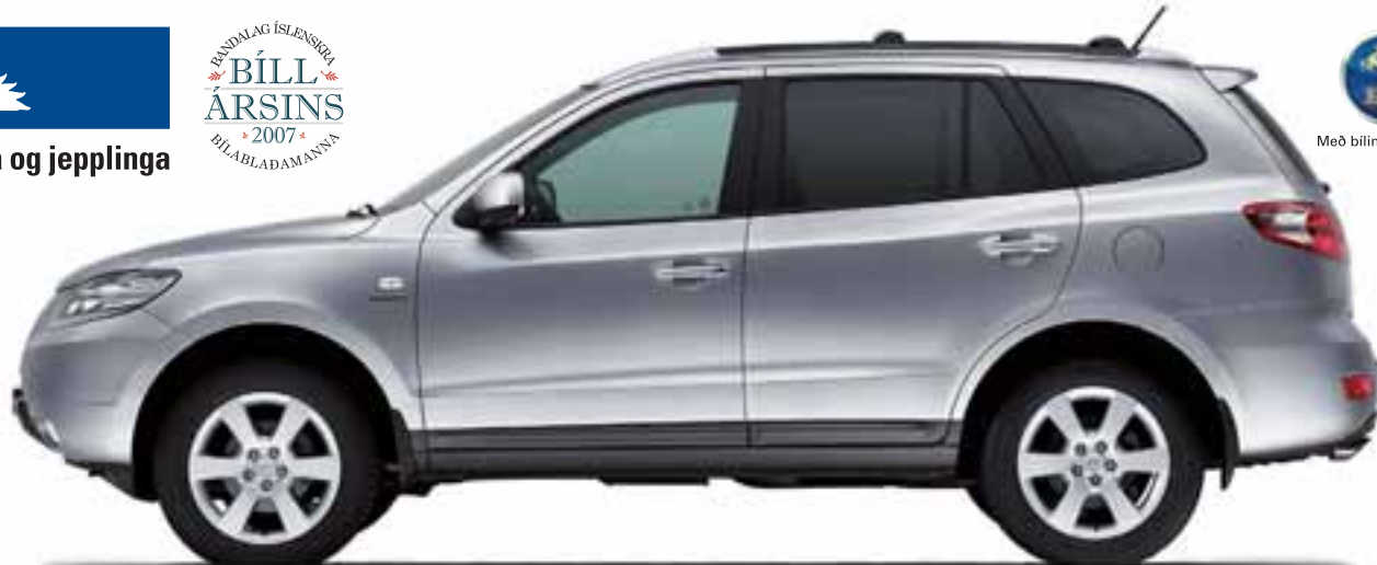
Bíll á mynd: Santa Fe GLS lux, 2,2 dísel - 7 manna.

Verð frá kr. 3.460.000 Hlaðinn staðalbúnaði Upplifðu bíl ársins 2006 Komdu í reynsluakstur