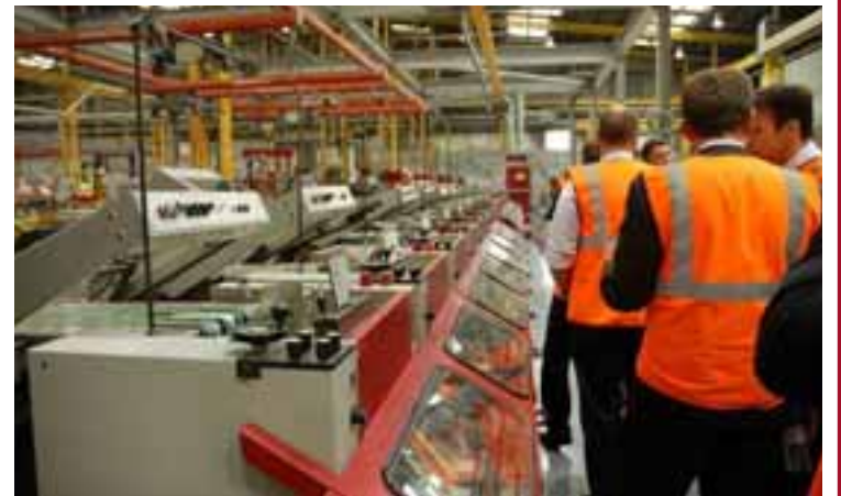
WYNDEHAM Tíu milljarða fjárfesting sem skilaði Dagsbrún miklu tapi á skömmum tíma.

Greiningardeild Landsbankans gaf lítið fyrir skýringar stjórnenda Dagsbrúnar: „Tilkynningin kemur töluvert á óvart og þá sérstaklega í ljósi þess að það hefur legið fyrir að starfsumhverfi á breska prentmarkaðinum hefur verið mjög erfitt undanfarin 10 ár. Verðþessa og mikil samþjöppun hefur einkennt þennan markað í