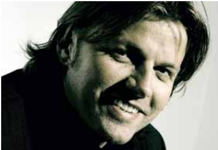
JÓN ÁSGEIR JÓHANNESSON Viðburðaríkt ár að baki og ekki að furða að forstjóri Baugs Group hafi verið valinn annar áhrifamesti maðurinn í breskum tískuiðnaði af tískurítinu Drapers Fashion í desembermánuði.

Jón Ásgeir Jóhannesson, forstjóri Baugs Group