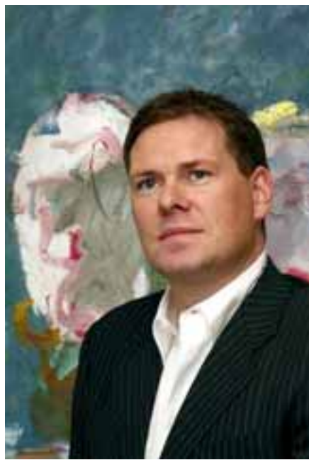
EITT STÆRSTA FJÁRFESTINGARFÉLAG EVRÓPU FL Group hefur á skömmum tíma vaxið úr ferðaþjónustufyrirtæki með átta milljarða í eigin fé í eitt af stærstu fjárfestingarfélögum í Evrópu með 150 milljarða í eigin fé.

Annað flugfélag er í eigu FL að hluta og var í 100 prósent eigu þar til í gær. Það er Sterling. Samkeppnisaðilinn er SAS sem er í eigu þriggja ríkja. „Það