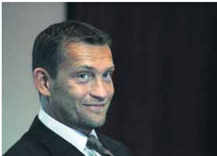
BJÖRGÓLFUR THOR BJÖRGÓLFSSON FJÁRFESTIR Segir óvissu í alþjóðlegri fjárfestingastarfsemi framundan. Helsta tryggingin sé að hafa aðgang að varanlegu fjármagni sem gefur fjárfestum möguleika á að kaupa og selja á eigin forsendum.

ingum og heildarlausnum á því sviði hvort sem er í lofti, á sjó eða landi. Ég horfi mjög björtum árum til ársins 2007 og tel miklar líkur á því að árið verði hluthöfum félagsins til framdráttar. Á heildina litið er ég bjartsýnn á nýtt ár fyrir land og þjóð og vil nota tækifærið og þakka öllum en þó sérstaklega starfsfólki Eimskips og Atlanta, fyrir árið sem er að líða og ég óska öllum gæfu og gengis á nýju ári.