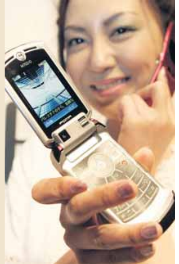
MEÐ ÞRIÐJU KYNSLÓÐAR FARSÍMA Sjó af stærstu farsímafélögum í Evrópu og Bandaríkjunum ætla að ræða saman um gerð nýrrar leitarvélar fyrir farsíma í næstu viku.

Ekki liggur nákvæmlega fyrir hver næstu skref farsímafyrirtækjanna verða. Þá er í gildi samningur á milli nokkurra af fyrirtækjunum, meðal annars Vodafone og Hutchison við Google um innbyggðar leitarvélar í farsímum fyrirtækjanna. Leitarvélin í símunum er ekki að fullu virk