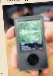
ZUNE-SPILARI Microsoft hefur selt færri Zune-spílara frá því í nóvember í fyrra en vonir stóðu til. MARKAÐURINN/AF

Microsoft batt miklar vonir við Zune-spílarann, sem etja átti kappi við iPod-spílarann frá Apple. Þær vonir hafa ekki ræst enda hefur Microsoft einungis