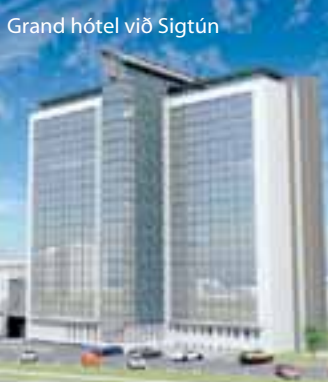
Grand hótél við Sigtún

ÍAV óskar eftir gæðastjóra, en fyrirtækið stefnir að vottuðu gæðakerfi.