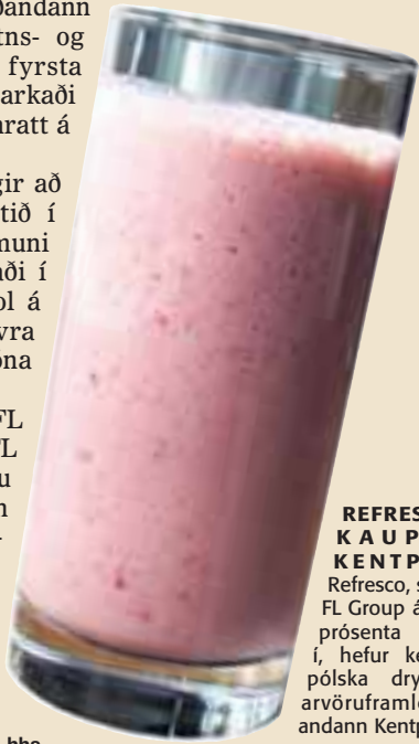
REFRESCO KAUPIR KENTPOL Refresco, sem FL Group á 49 prósentu hlut í, hefur keypt pólska drykkjarvöruframleiðandann Kentpol.

Á afkomufundi hjá FL Group í síðustu viku boðaði FL Group tvö- til þreföldun veltu Refresco á næstu tólf til átján mánuðum. Félagið hefur skilgreint drykkjarvöruíðnaðinn sem einn af þeim mörkuðum sem félagið leggur mesta áherslu á í fjárfestingum. Því væntir greiningardeild Glitnis frekari fjárfestinga hjá félaginu á næstu vikum. - hhs