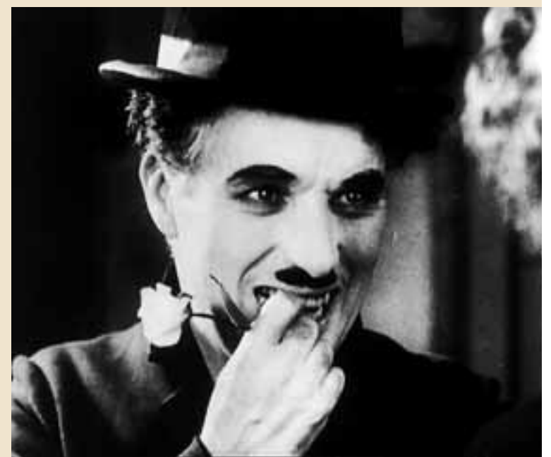
CHARLIE CHAPLIN Fimmti febrúar var mikilvægur dagur í lífi gamanleikarans Charlie Chaplin.

Leikarinn tók sér fjögurra ára hlé eftir þetta. Næsta mynd hans var Einræðisherrann, fyrsta talmynd leikarans, þar sem grín var gert að Adolf Hitler.