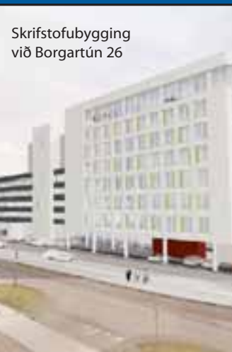
Skrifstofubýgging við Borgartún 26