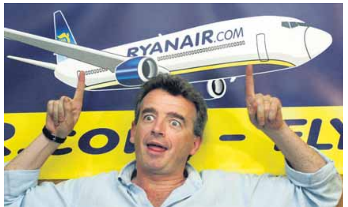
KÁTUR FORSTJÓRI RYANAIR Michael O'Leary, forstjóri írsku lággjaldaflugfélagsins Ryanair, hefur ástæðu til að gleðjast enda var hagnaður flugfélagsins talsvert yfir væntingum greinenda.

Gengi Google hefur margfaldast frá stofnun fyrirtækisins fyrir níu árum en einungis vantar 10 Bandaríkjadali, tæpar 70 íslenskra króna, upp á að gengið farið í 500 dali á hlut. Það yrði nýtt met í sögu netleitarfyrirtækisins. - jab