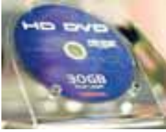
HD-DVD DISKUR Afritunarvörn HD DVD háskerpu-diska var rofin um áramótin.

Afritunarvörn á nýju HD DVD-háskerpu-diskunum hefur verið rofin. Þetta segir staðlanefnd stuðla að því að tryggja varnir sem þessar svo ekki verði hægt að afrita mynddiska að vild.