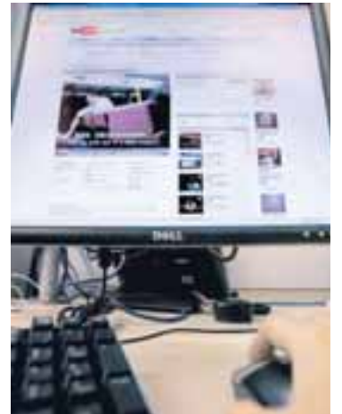
YOUTUBE Í TÖLVUNNI Bandaríska affreyngarfyrirtækið Viacom hefur krafist þess að YouTube fjarlægji 100.000 myndskrár.