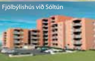
Fjölbýlishús við Sóltún