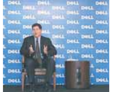
MICHAEL DELL Stofnandi bandaríska tölvurísans Dell hefur sest að nýju í forstjórstól fyrirtækisins til að snúa rekstri fyrirtækisins til betri vegar.

Gengi hlutabréfa í fyrirtækinu hefur hækkað um fimm prósent frá forstjóraskiptunum. Greinendur segja engu að síður að Michael Dell verði að spýta í lófana eigi honum að takast að laga til í rekstrinum og hindra að Hewlett-Packard, helsti keppi-