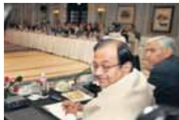
FUNDAÐ MEÐ FJÁRMÁLAMÖNNUM Palaniappan Chidambaram, fjármálaráðgjafi Indlands, á fundi með fulltrúum fjármálastofnana á Indlandi á mánudag.

Í rökstuðningi bankans kemur fram að eftirspurn hafi aukist í hagkerfi Indlands. Sýnt sé að meira magn peninga sé í umferð nú en áður, skuldir hafi aukist og verð á húsnæði fari upp á við.