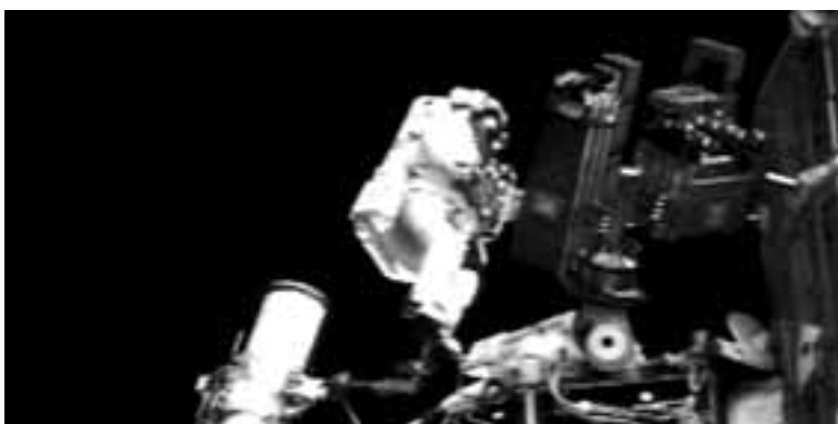
UTAN Á GEIMSTÖÐINI Sunita Williams við störf utan á Alþjóðlegu geimstöðinni. Allt stefnir í að hún slái eigið heimsmet í geimgöngu á ný á morgun.