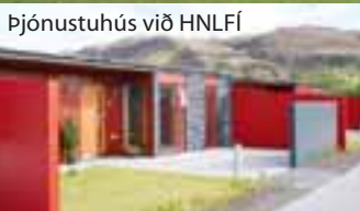
Þjónustuhús við HNLFI