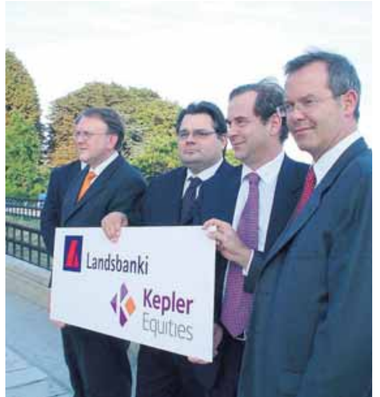
STJÓRNENDUR LANDSBANKANS OG KEPLERS Kepler-Landsbankinn stóð fyrir viðamikilli ráðstefnu á dögunum um nýtingu endurnýjanlegra orkugjafa.

Á ráðstefnunni kynntu 22 fyrirtæki í fararbroddi í Evrópu, Bandaríkjunum og Kanada starfsemi sína og mögulega fjárfestingarkosti fyrir rúmlega 200 sérhæfðum stofnanafjórðingum. Þrjú íslensk fyrirtæki voru á meðal þeirra sem kynntu starfsemi sína. Það voru Hitaveita Suðurnesja hf., Jarðboranir hf. og Enex hf. Í fréttatilkynningu frá Landsbankanum segir að sérstaða Íslands í nýtingu endurnýjanlegra orkulinda hafi vakið áhuga stórra fjárfestingaraðila á ráðstefnunni.