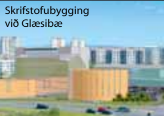
Skrifstofubýgging við Glæsibæ

ÍAV er eitt stærsta og öflugasta verktakafyrirtæki landsins og býr yfir áratuga reynslu í mannvirkjagerð. Verkefni ÍAV eru á öllum sviðum byggingariðnaðar, hvort sem um er að ræða íbúðarhúsnæði, atvinnuhúsnæði, opinberar byggingar eða aðra mannvirkjagerð sem og jarðvinnuframkvæmdir. Hjá fyrirtækinu starfa á sjötta hundrað manns og þar af eru um 80 háskólamenntaðir.