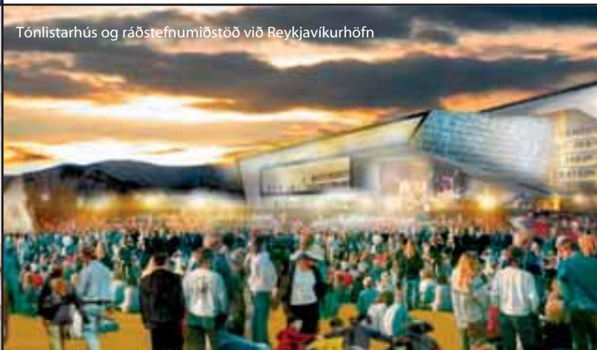
Tónlistarhús og ráðstefnumiðstöð við Reykjavíkurbörn