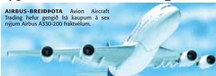
AIRBUS-BREIÐPOTA Avion Aircraft Trading hefur gengið frá kaupum á sex nýjum Airbus A330-200 fraktvélum.

Listaverð vélnanna sex er um 6,7 milljarðar íslenskra króna. Samkvæmt fréttatilkynningu frá AAT er kaupverðið þó umtalsvert lægra og trúnaðarmál milli kaupanda og seljanda. Fjármögnun fyrir kaupunum hefur að fullu