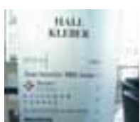
KEPLER EQUITIES Í PARIS Kepler Equities, sem heyrir undir Landsbankanum, hefur verið valið fremsta greiningarfyrirtæki Frakklands.

Þetta er í annað skipti á þremur mánuðum sem Kepler er í fyrsta sæti yfir bestu verðbréfafyrirtækin því í nóvember í fyrra varð Kepler efst í könnun fjármálátímaritsins Bloomberg yfir bestu verðbréfafyrirtæki í Evrópu. - jeb