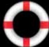
GAGNABJÖRGUN MEÐ EINUM TAKKA