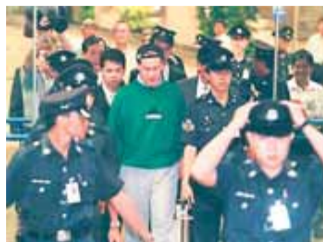
VERÐBRÉFAMIÐLARINN HANDTEKINN Nick Leeson var handtekinn í Þýskalandi þegar hann flúði þangað ásamt þáverandi eiginkonu sinni og var framseldur til Singapúr fyrir aðild sína að gjaldþroti Barings-banka.

Þótt Barings-banki hafi flaggað gamalli og virðulegri sögu vandar Leeson stjórnendum hans ekki söguna, sérstaklega ekki þegar kom að uppbyggingunni í Asíu. „Það var mikið lagt upp úr því að greiða há laun og gera ímyndina út á viðtrausta. Hæfustu einstaklingarnir fóru auðvitað þangað sem launin voru hæst.