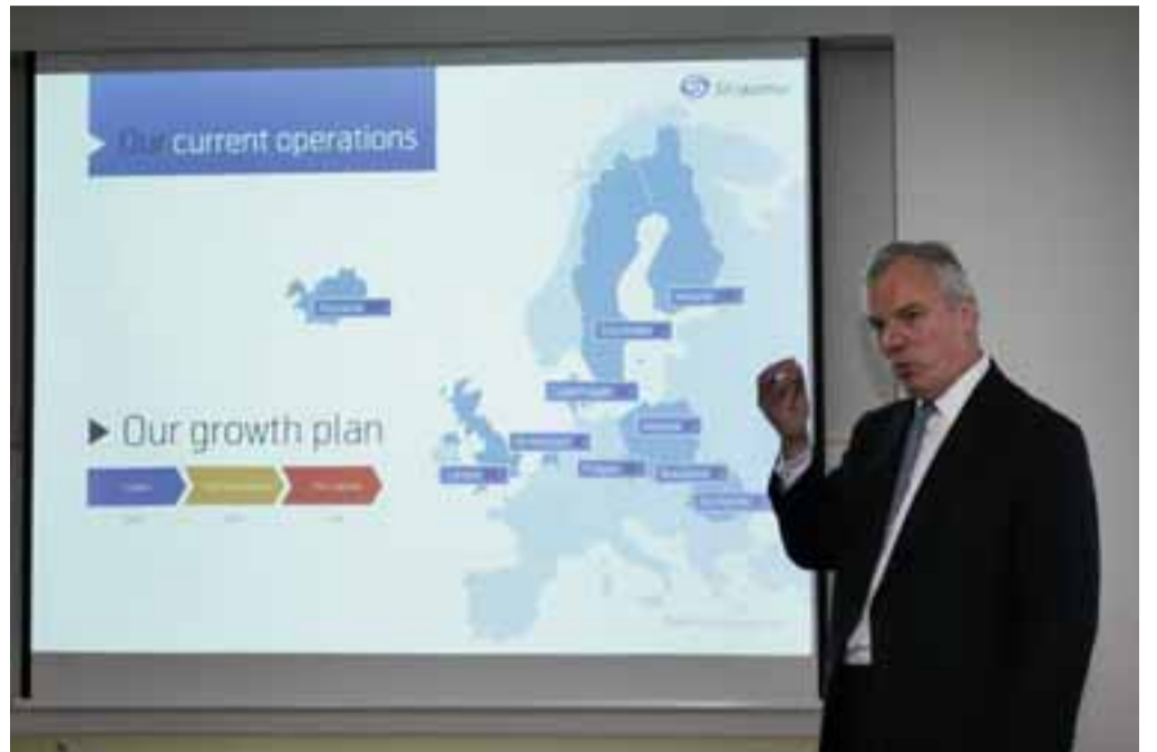
FRAMTÍÐIN SKÝR Níutíu dögum Williams Fall undir felldi er lokið. Hann kynnti framtíðarsýn bankans á blaðamannafundi á mánudag.

Ætlunin væri að bankinn yrði fyrsti kostur í hugum viðskiptavina bankans, á öllum starfssvæðum hans.