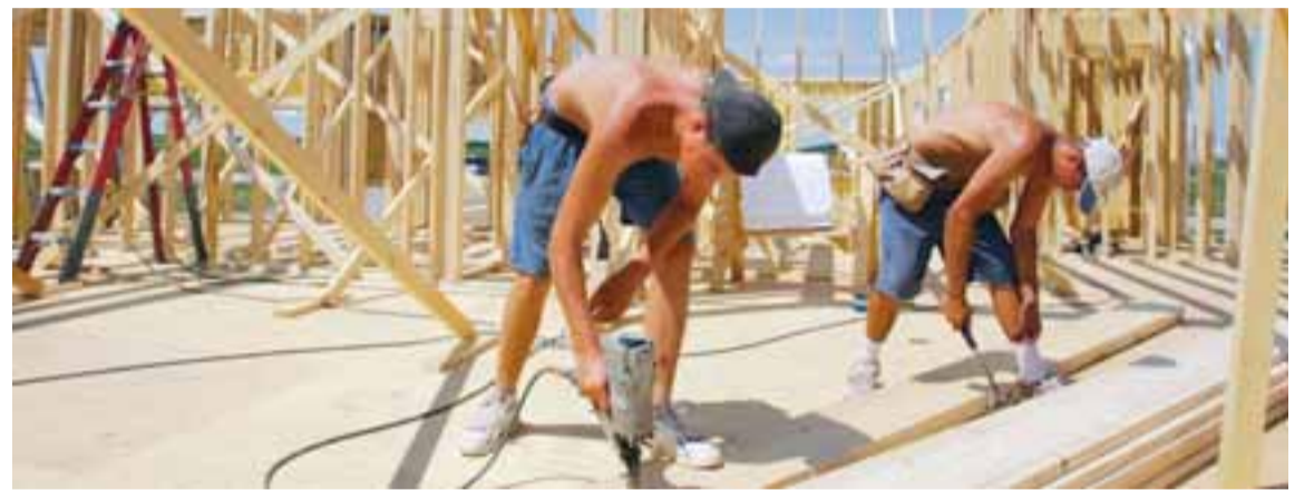
UNNIÐ AÐ NÝSMÍÐI Forstjóri stærsta fasteignalánafyrirtækis Bandaríkjanna segist sjaldan hafa séð það svartara á húsnæðismarkaði vestan hafs en nú.

SÚKKULAÐI Dökkt súkkulaði er sagt heilsusamlegt í höf. Á morgun skrifa stærstu verslanir landsins undir yfirlýsingu þar sem lagst er á árar með þeim sem stuðla vilja að auknu heilbrigði þjóðarinnar.