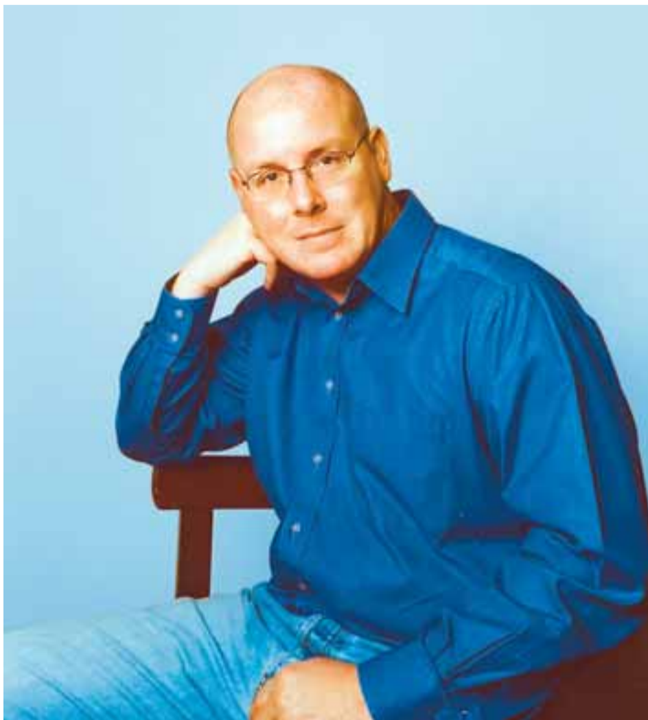
NICK LEESON Verðbréfamiðlarinn fyrrverandi hefur helstu tekjulind sína í dag af fyrirlestur um sögu sína hjá Barings-banka, sem varð gjaldþrota af hans sökum árið 1995.

Hins vegar var litlum fjármunum varið í stjórnun og öryggisþætti, svo sem í endurskoðun og bakvinnslu,“ segir hann og bendir á að þetta eigi við um marga aðra banka, jafnt þá sem nú. „Þetta átti sérstaklega við í uppbyggingu bankans í öðrum löndum í Asíu.“