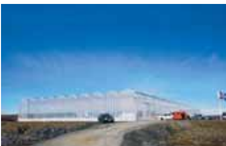
GRÆNA SMÍÐJAN Hátæknigróðurhúsið ORF Líftækni stendur rétt utan við Grindavík, en lítill hætta er á að byggingin fari framhjá vegfarendum á vinstri hönd þegar þeir renna inn í bæinn.