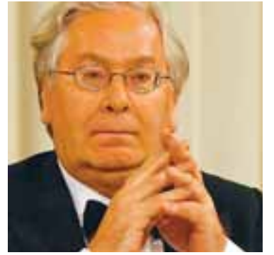
BRESKI SEÐLABANKASTJÓRINN Mervyn King, seðlabankastjóri Bretlands, óttast að verðbólga eigi enn eftir að aukast. Hún mældist 3,0 prósent í síðasta mánuði.