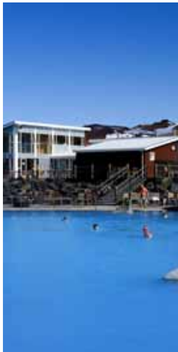
FRÁ JARÐBÖÐUNUM Rekstur Jarðböðanna skilaði ellefu milljóna króna hagnaði í fyrra.