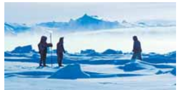
ERFIÐAR AÐSTÆÐUR Hlýnun jarðar felur í sér möguleika til aukinnar jarðvinnslu og leitarskilyrði batna á Grænlandi eftir því sem jöklar hropa. Þetta er meðal þess sem Grænlandingar benda fjárfestum á þessa dagana.

Að auki sjá Grænlandingar tækifæri í hlýnun jarðar því með bráðnun jökla vænkast hagur þeirra sem kunna að vinna þar úr jörðu olíu og gas, auk verðmætra málma á borð við gull, platínu, demanta, blý, sink og kol.