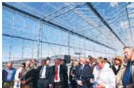
UNDIR GRÓÐURHÚSAÁHRIFUM Í Grænu smiðjunni fengu fjölmargir gestir opunarinnar fyrir helgi að reyna „gróðurhúsaáhrifin“ á eigin skinni, því innandyrnar var vel hlýtt.