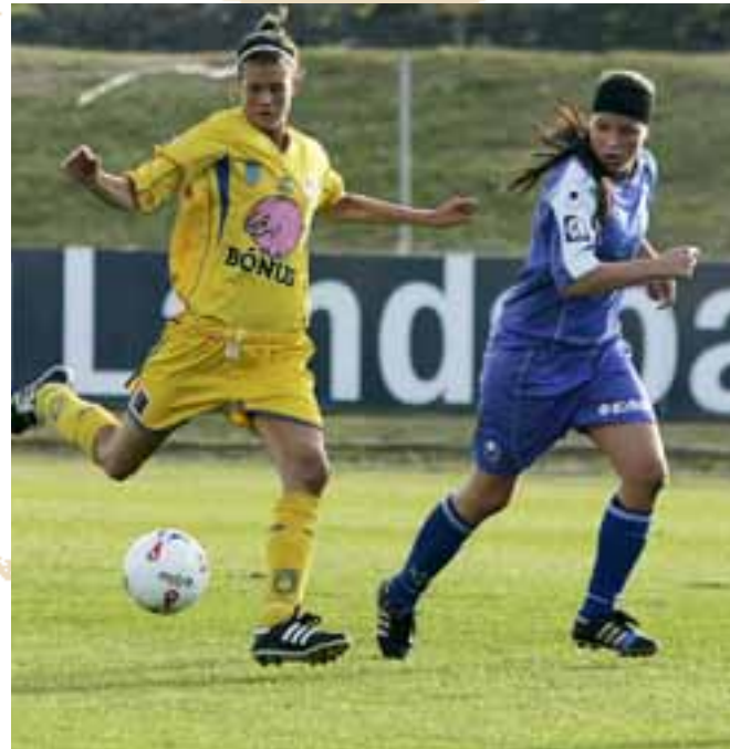
KVENNAKNATTSPYRNAN Íslenskar knattspyrnukonur hafa náð góðum árangri, en reksturinn er ekki jafn umfangsmikill og í karlaboltanum.