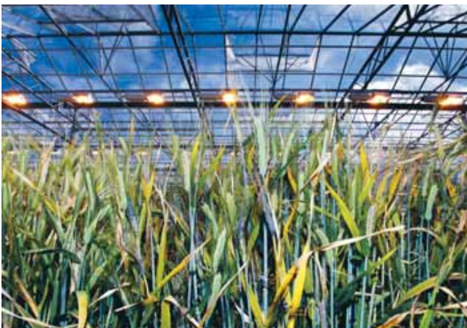
FRAMLEIÐSLAN Byggið sem notað er í próteinframleiðslu ORF Líftækni í Grænu smiðjunni er sömu tegundar og notað er í framleiðslu á finustu maltvískium veraldar. Úr hálfu kíló af fræjum, af einum fermetra færbandi, voru framleiddir tveir þúsundustu hlutar úr grammi vaxtarþáttar, sem svo seldist á þrjár milljónir króna. Þar fær ORF Líftækni trúlega meira úr sínu bygg en viskíframleiddandinn.