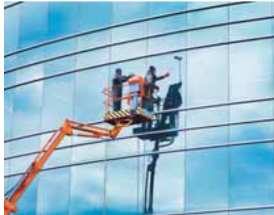
KAUPHÖLLIN FEGRUÐ Ekki er lítið verk að hreinsa glerhýsi þessa lands svo sem gluggavottarmenn fengu að reyna á Kauphöll Íslands fyrir skömmu.

Þá bendir Viðskiptaráð á að þótt frumvarpið geri bara ráð fyrir umsagnarrétti Seðlabankans með uppgjörskerfum fyrir verðbréf og greiðslur í fjármálaviðskiptum til Fjármálaeftirlitsins (FME) hafi bankinn í raun neitunarvald, því hann eigi jafnframt að gera tillögu að greiðslukerfi til ráðherra. Það muni bankinn ekki gera ef hann lýsi sig andsnúinn tilteknu greiðslukerfi. Viðskiptaráð leggur til að skýrðar verði fremur skyldur FME og Seðlabankans til samráðs vegna uppgjörsgleina verðbréfamíðstöðva. „Í ljósi einarðrar afstöðu Seðlabankans gegn uppgjöri sem og skráningu hlutabréfa tiltekinn fyrirtækja í erlendum myntum og