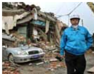
FRÁ BJÖRGUNARSTARFI Viðskipti voru stöðvuð í gær með bréf fyrirtækja sem starfa í Sichuan-héraði í Kína.

Gengi hlutabréfa lækkaði almennt lítillega í Kína í gær. Á sama tíma hækkaði gengi bréfa