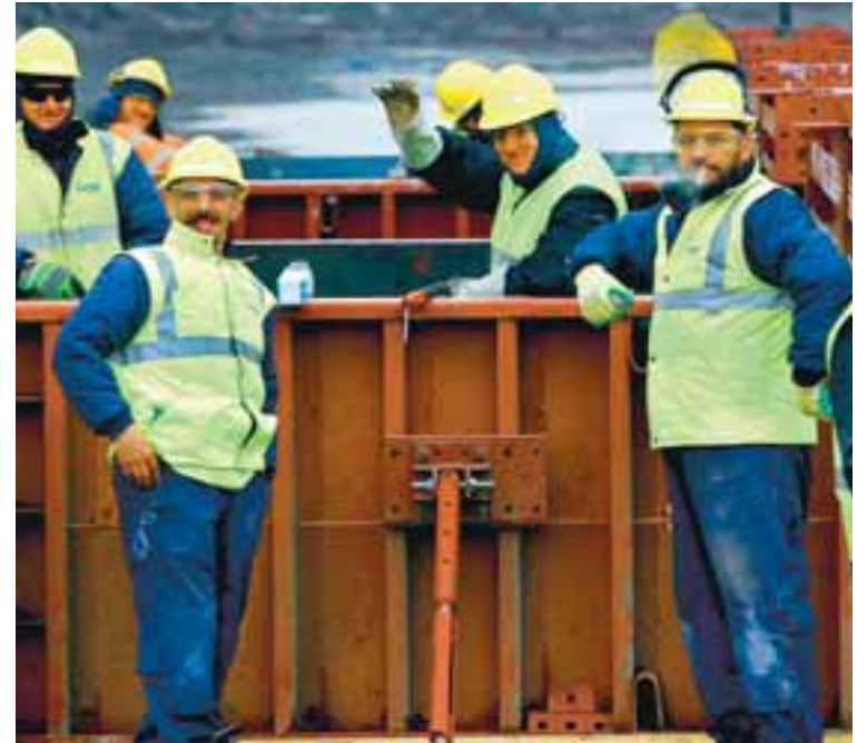
Á HEIMLEIÐ? Pólskir farandverkamenn vinna við íslenskar byggingar.

Fram kemur í danska viðskiptablaðinu Børsen að flykkist Pólverjar heim á leið geti það kostað danska þjóðarþúið milljarða danskra króna. Hins vegar