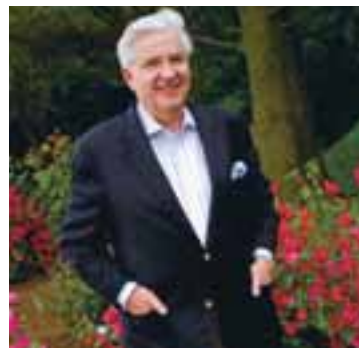
BJÖRGÓLFUR GUÐMUNDSSON Félag í eigu þeirra Björgólfs Guðmundssonar og sonar hans og nafna fékk rúma 1,7 milljarða í arð frá Straumi-Burðarási í formi hlutabréfa í gær.