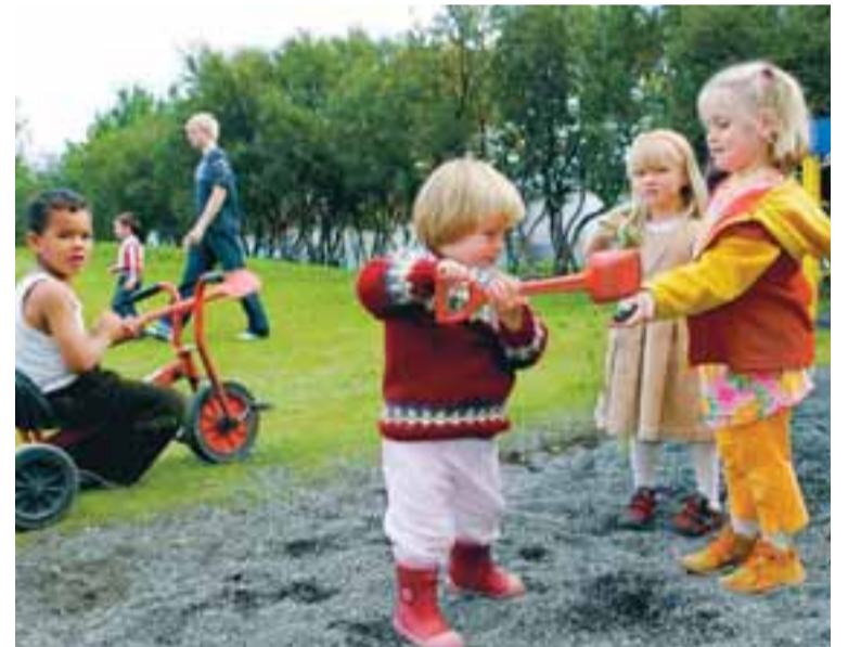
MOKAÐ Í LÍFEYRISSJÓÐINN Deilt er um frumvarp sem heimilur lífeyrissjóðum að lána allt að fjórðung eigna sinna, verði það að lögum. Ekki var hægt að afgreiða það úr efnahags- og skattanefnd í upphafi vikunnar. Óvíst er að það verði að lögum í vor.