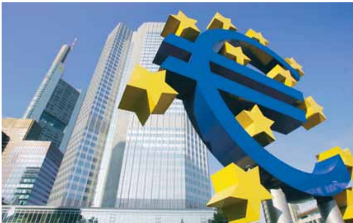
EVROTURNINN Í FRANKFURT Umræða um kosti og galla aðilar að Evrópusambandinu og Myntbandalagi Evrópu hefur aukist hér á landi. Greinarhöfundur vísar til reynslu Finna af samdrætti áður en kom til inngöngu í Evrópusambandið.

Þótt Finnar hafi litið á tiltekta eftir síðasta samdráttarskeið sem góðan undirbúning fyrir inngöngu í Evrópusambandið og EMU má það ekki draga úr áhuga fyrir því að svona hreingerning fari fram hérlendis. Óháð afstöðu okkar til ESB eigum við að líta á núverandi samdrátt sem tækifæri til þess að gera strax þær breytingar sem bætt geta samkeppnisstöðu okkar og gert okkur snjallari á næsta uppgangsskeiði.