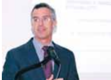
FREDERIC MISHKIN Íslandsvinurinn og bankastjórnir Frederic Mishkin segir bandaríska seðlabankann verða að bregðast við eignabólum.

Mishkin segir seðlabankann verða að gera greinarmun á því hvers konar bólu bankinn eigi að beina sjónum að. Þannig telur hann að bankinn hafi átt að fylgjast betur með verðhækkun á fasteignamarkaði og bregðast við. Netbóluna, sem sprakk með látum um síðustu aldamót, hafi átt að láta í friði. Muninn segir hann felast í víðtækari áhrifum fasteignalána á efnahagslífið en