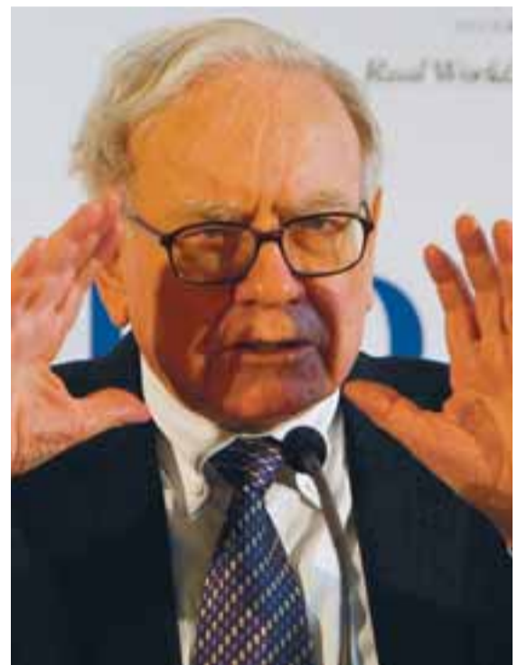
SVONA STÓRT FYRIRTÆKI? Ríkasti maður heims, bandaríski öldungurinn Warren Buffett, er í verslunarleiðangri í fjórum stórborgum í Evrópu. Hann er með heimild upp á tæpa 2.600 milljarða króna.

Ekkert hefur verið gefið upp um hvort ein-