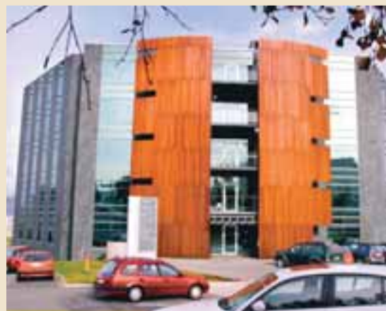
NASDAQ/OMX KAUPHÖLL ÍSLANDS Þegar eignarhald eða atkvæðisréttur vegna skráðra félaga fer umfram fyrir fram skilgreind mörk ber að tilkynna það á markaði.

Tilfellið er nefnilega að eignarhlutir í félögum á markaði skipta oft hratt um hendur. Við hver viðskipti breytist hlutfallslegt eignarhald á viðkomandi félagi og við stærri viðskipti getur eignarhald eða atkvæðisréttur breyst svo mikið að skylt sé að tilkynna um það til Kauphallarinnar og hlutfélagsins sem um ræðir. Flöggunarskylda er svo við ákveðin mörk sem dregin hafa verið í þessum efnunum og ber að flagga í sérhvert sinn sem farið er yfir þau. Mörkin liggja við 5, 10, 20, 33,33, 50 og 66,75 prósent hlut.