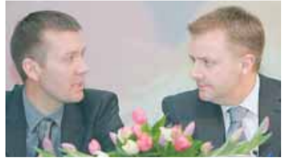
BAKKABRÆÐUR Forstjóri Greencore, sem Bakkavör á tæp ellefu prósent í, spár hærra hráefnisverði í haust en nú.

Aðspurður sagði Coveney erfitt að segja til um áhrif aðkomu Bakkavara í hluthafahóp Greencore. Málið væri eðlilega viðkvæmt, ekki síst þar sem fyrirtækin etja kappi á breskum samlokumarkaði.