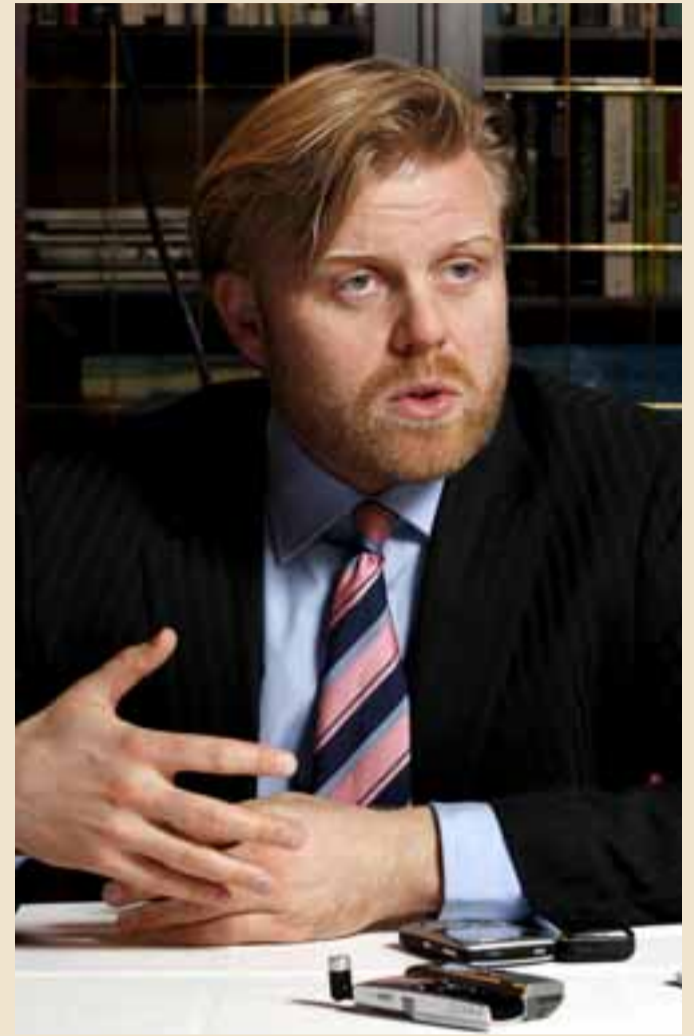
ÁKVEÐIN MISTÖK Ásgeir segir það hafa verið ákveðin mistök að hækka vexti.