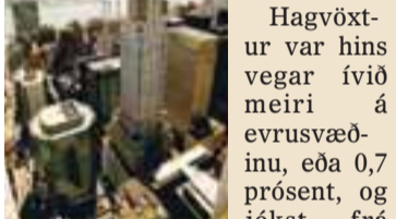
NEW YORK Í BANDARÍKJUNUM Hagvöxtur í Bandaríkjunum stendur í stað milli ársfjórðunga.

Hagvöxtur var hins vegar ívið meiri á evrusvæðinu, eða 0,7 prósent, og jókst frá því í fyrra, en á síðasta fjórðungi 2007 var hagvöxtur evrulandanna 0,4 prósent. Í Bandaríkjunum nam vöxturinn hins vegar ekki nema 0,1 prósent, eins og á lokafjórðungi 2007. Vöxtur á milli ársfjórðunga var mestur í Þýskalandi, 2,7 prósent, en minnstur í Japan, 1,1 prósent.