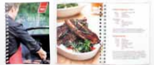
Fylgir frítt með seldum grillum