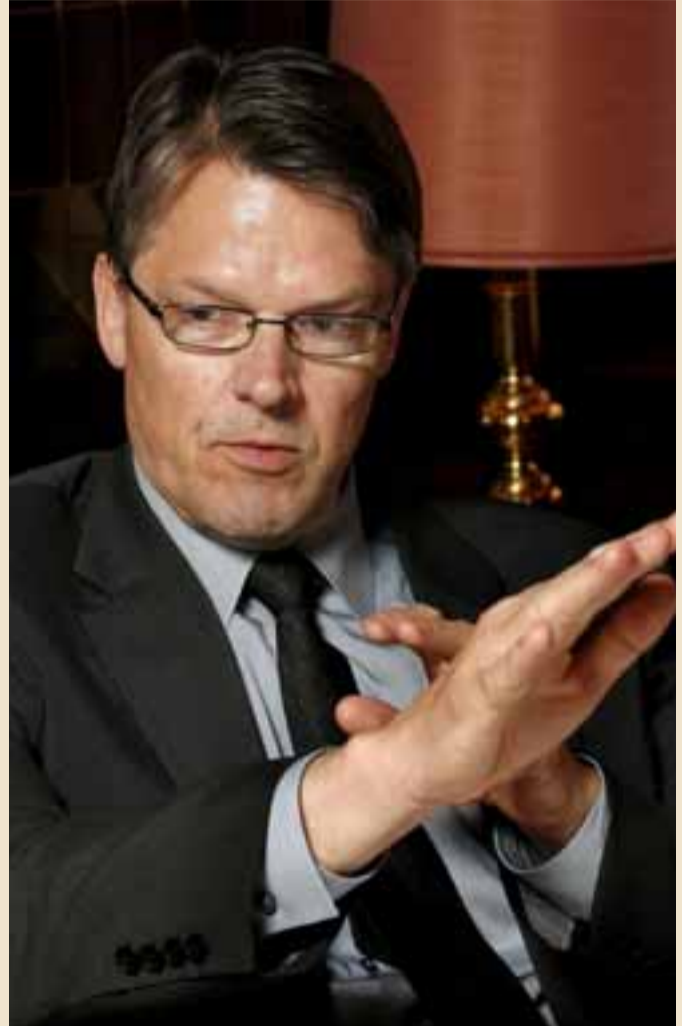
EINFÖLD ÁKVÖRÐUN Þórður segir ákvörðun um stýrivexti nú til þess að gera einfalda.