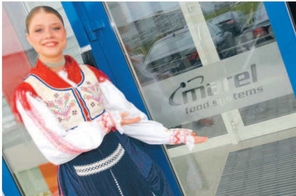
VIÐ INNGANGINN Stúlkur íklæddar þjóðbúningi Slóvaka buðu gesti velkomna í nýju framleiðsluhúsnæði í bænum Nitra á föstudag. Húsið, sem er 9.500 fermetrar að flatarmáli, er agnarsmátt í samanburði við tæplega tíufalt stærra húsnæði Sony sem er skammt frá.

Marelhúsið, sem sést vel frá einum af aðalvegum til Nitra, stendur á nýlegum og stórum iðnaðarskika. Þar hefur fjöldi erlendra fyrirtækja numið land, þekkt sem óþekkt. Tveimur lóðum frá er Promens, eitt dótturfyrirtækja Atorku, langt komið með að reisa hús.