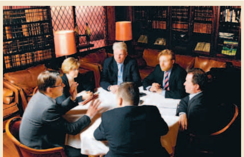
FYRSTI FUNDURINN Skuggabankastjórn vildi þá halda vöxtum óbreyttum.