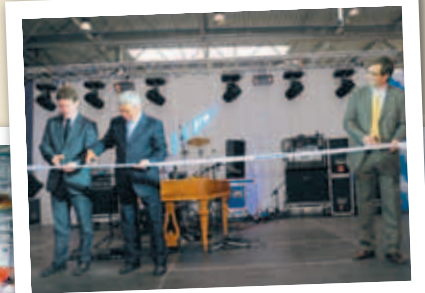
KLIPPT Á BORDANN