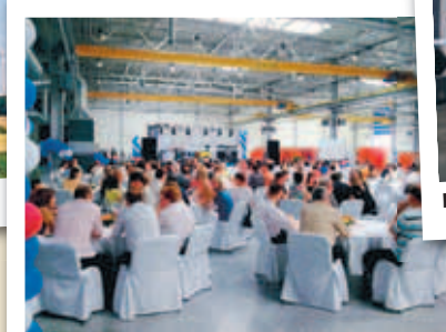
GESTIR MÆTTIR Á STAÐINN