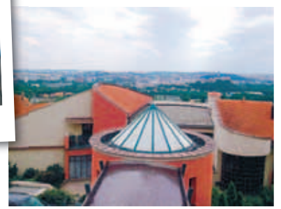
HORFT TIL NITRA