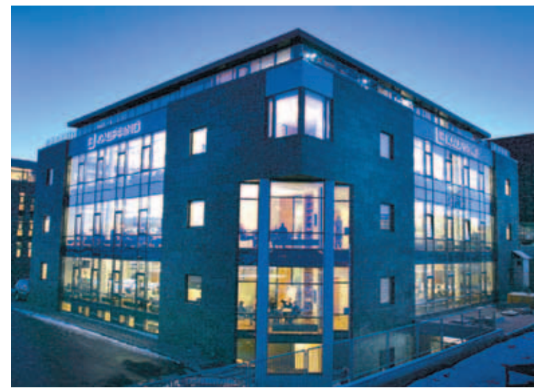
HÖFUÐSTÖÐVAR KAUPÞINGS Í BORGARTÚNI Rætt er um að lífeyrissjóðirnir kunni að eignast 51 prósentu hlut í Kaupþingi, en ótilgreindir fjárfestar það sem eftir stendur.