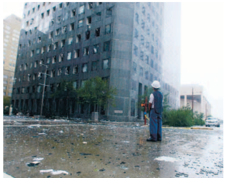
HAMFARIR VIÐ BANKA Verkamaður virðir fyrir sér hvernig umhofs er við JP Morgan Chase Turninn í Houston í Texas í Bandaríkjunum eftir að fellibylur fór þar yfir í byrjun síðasta mánaðar. Segja má að ofsaveður hafi áfram ríkt á fjármálamárknaði síðan þá þótt í óeiginlegri merkingu sé.

Deyr fé, deyja frændur, deyr sjálfur ið sama. En orðstír deyr aldregi hveim er sér góðan getur.