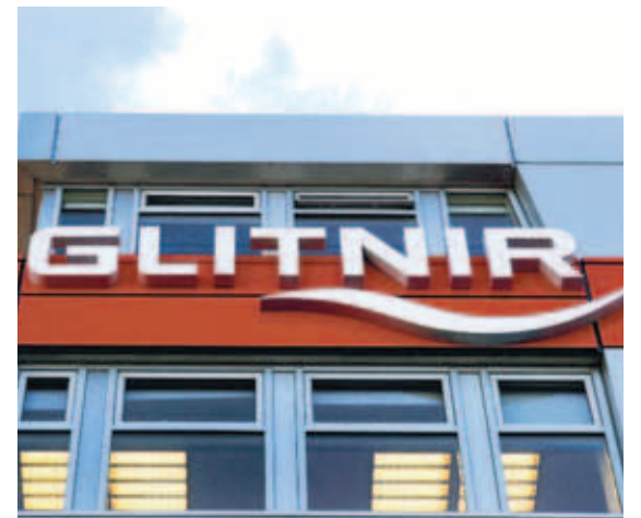
GLITNIR Formaður skilanevndar Glitnis segir mikilvægt að standa við skuldbindingar gamla bankans og tryggja hagsmunum hans. Verkefni sem ekki tengjast bankastarfsemi verða ekki seld í bili.