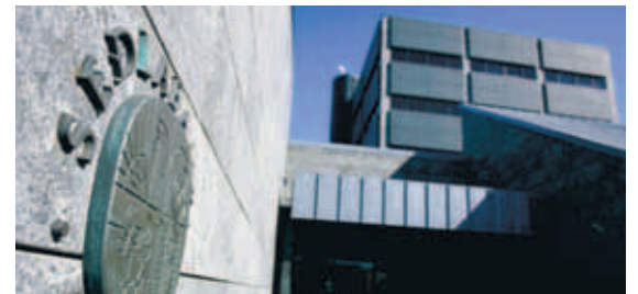
SEÐLABANKI ÍSLANDS Upphaflega stóð til að Seðlabankinn hefði forgang á veðskuldbindingar „gömlu“ bankanna en fallið var frá því þar sem sú skipan var ekki talin standast lög.

Straumur lagði fram viðbótarveð í gær, sama gerði Askar Capital. VBS fjárfestingarbanki segir