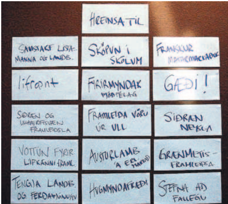
HUGMYNDR Á BLAÐI Niðurstöður af hugmyndavinnu þátttakenda Hugsprettu voru hengdar upp á vegg þegar vinnuhóparnir höfðu lokið sér af. Hér er lítið brot af þeim.