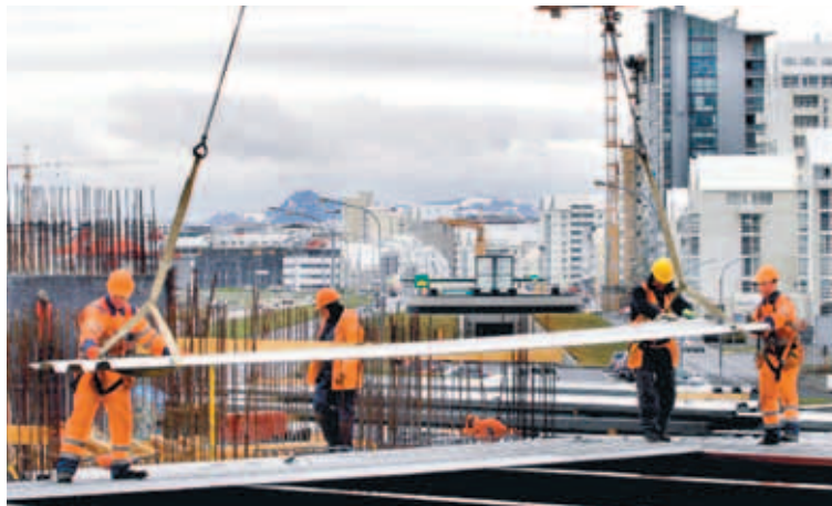
TÓNLISTARHÚS BYGGT Í REYKJAVÍK Greinarhöfundur bendir á að þær aðstæður sem íslenskt viðskiptalíf er búnar þessa dagana séu með öllu óásættanlegar og segir þær jafnvel mun verri en stjórnvöld virðist gera sér grein fyrir.

Að sama skapi er mikilvægt að skýr stefna verði mótuð um framtíð nýrra ríkisbanka og