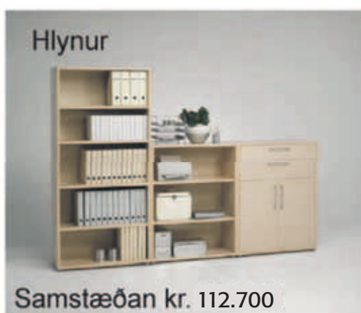
Samstæðan kr. 112.700