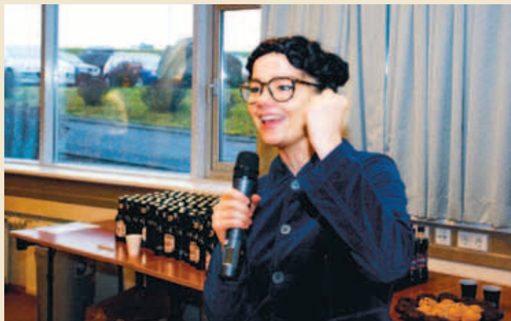
REIFAÐI HUGMYNDIR Söngkonan Björk Guðmundsdóttir ræddi um helgina við sérfræðinga og leikmenn um nýsköpun og fjölbreytileika í samfélags- og atvinnusköpun til að leggja grunn að framtíðaruppbyggingu landsins.

Hann segir alla þá sem komið hafi að verkefnunum um helgina vilja halda þeim áfram. „Það er frumlegur kraftur í þjóðfélaginu,“ segir hann.