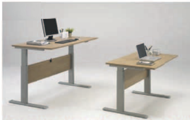
Hæðarstillanleg skrifborð frá kr. 60.600