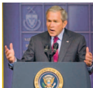
BUSH BANDARÍKJAFORSETI Neytendur vestanhafs hafa ekki verið svartsýnni frá því mælingar hófust. Margir eru sagðir svefnlausir af fjárhagsáhyggjum.