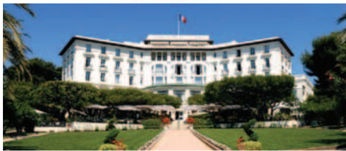
Grand Hotel du Cap-Ferrat