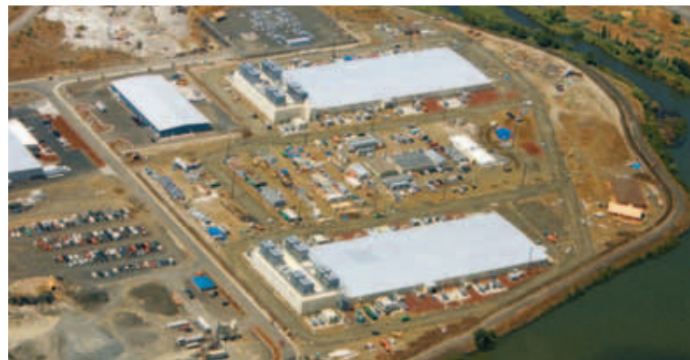
HÁTÆKNISTÓRIÐJA Hér sjást tvö af netþjónabúum bandaríska netleitarisins Google, hvort um sig á stærð við knattspyrnuvöll. Greinarhöfundur bendir á að nú sé mikilvægt að missa ekki sjónar á nýsköpun í íslensku atvinnulífi sem stuðli að auknum útflutningi.

Nú skiptir sköpum að bregðast hratt við og nýta vel þann mannaúð sem losnar og finna honum nýjan farveg. Ýmsar mögulegar aðgerðir má nefna s.s. að gera