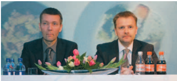
BAKKABRÆÐUR Gengi Bakkavarar fimmtánfaldaðist frá skráningu árið 2000 til júlí 2007. Það fór undir útboðsgengi í gær og hefur aldrei verið lægra.

„Þarna gefst tækifæri til að hitta framvarðarsveitina í vefmálum,“ segir Þórlaus en á ráðstefnunni halda nokkrir heimsþekktir sérfræðingar erindi. - jab