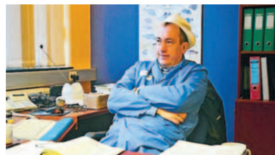
BINNÍ Í VINNSLUSTÖÐBINNI Tveir stjórnendur útflutningsfyrirtækja í sjávarútvegi segja of áhættusamt að fara fram hjá Seðlabankanum í viðskiptum við útlönd. Það borgi sig að bíða eftir erlendu fé heldur en eiga á hættu að tapa því öllu.

Hjáleiðin felur í sér að útflutningsfyrirtækið semur við íslenskt fjármálaafyrirtæki um stofnun yfirdráttareiknings í erlendum banka, jafnvel samstarfsbanka eða dótturfélagi hans á erlendri grund. Fjármálaafyrirtækið tekur síðan veð í eign