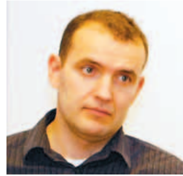
GUÐNI TH. JÓHANNESSON í mars er stefnt að því að út komi bók um bankahrunið. Guðni Th. Jóhannesson sagnfræðingur skrifar.

Bókin er væntanleg með vor-mánuðum, en útgefandi hennar er JPV forlag. - msh