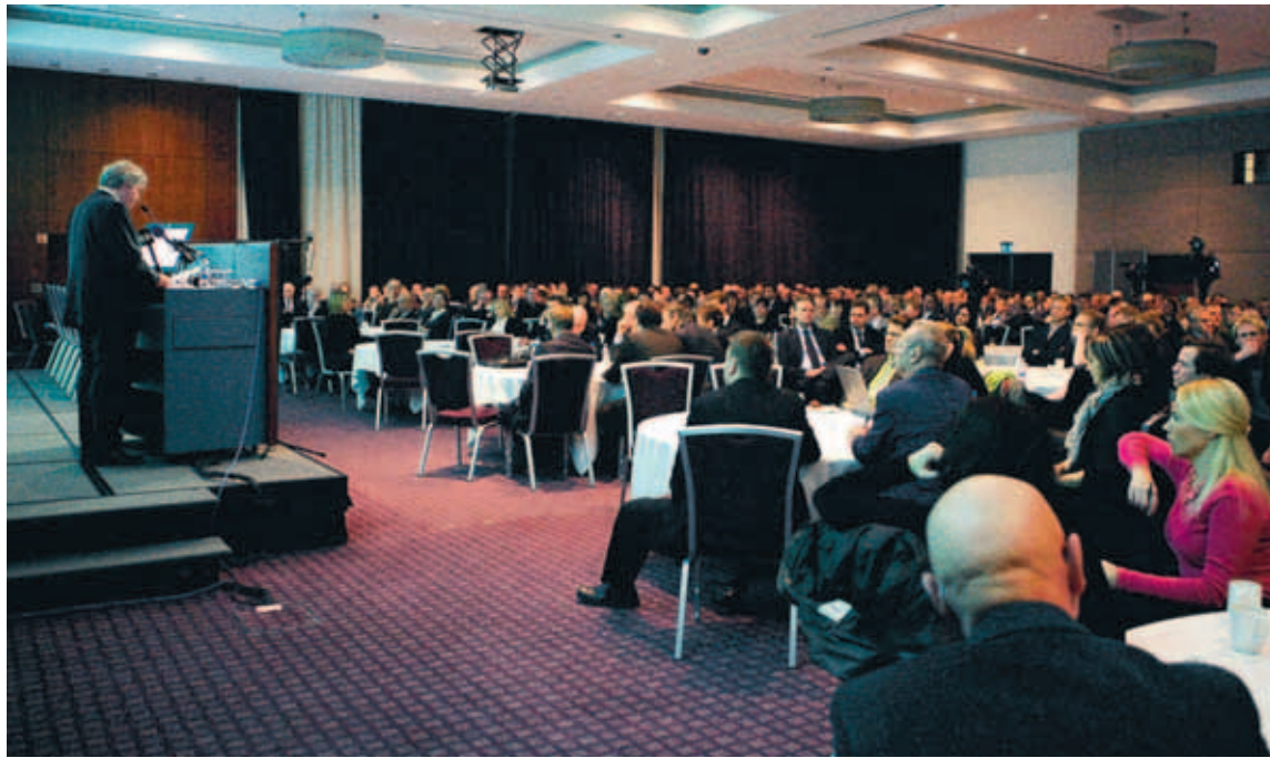
FORMAÐURINN OG VIÐSKIPTALÍFIÐ Davíð Oddsson, formaður bankastjórnar Seðlabankans, flytur ræðu á fundi Viðskiptaráðs. Ýmis gagnrýni kom fram á aðra en Seðlabankann og jafnframt ósk um rannsókn á aðgerðum bankans.

Hann sagði enn fremur að bankaleynd ætti ekki lengur við um stöðu mála og aðdraganda bankahrunsins. „Ábendingar sem bærust um að kalla til lögreglu strax í upphafi hafa ekki fengið brautargengi. Eru menn að bera fyrir sig bankaleynd í þessu sambandi?“ spurði Davíð.