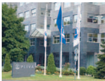
HÖFUÐSTÖÐVAR PLIVA Fyrir árslok er stefnt að því að sameina tvö lyfjafyrirtæki sem kepptu við Actavis í fyrirtækjakaupum.

Tilboð Teva í Barr, sem lagt var fram í júlí í sumar, hljóðar upp á 7,46 milljarða Banda-