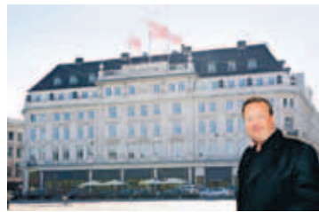
GÍSLI VIÐ D'ANGLETERRE Flottasta hótél Norðurlandanna stendur í hjarta Kaupmannahafnar við Nytorv.

Danska dagblaðið Berlingske Tidende sagði í gær verðið hafa verið nálægt einum milljarði danskra króna. Í kjölfar bankahrunsins hafi orðrómur farið