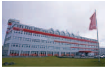
HÖFUÐSTÖÐVAR GLITNIS Í REYKJAVÍK.