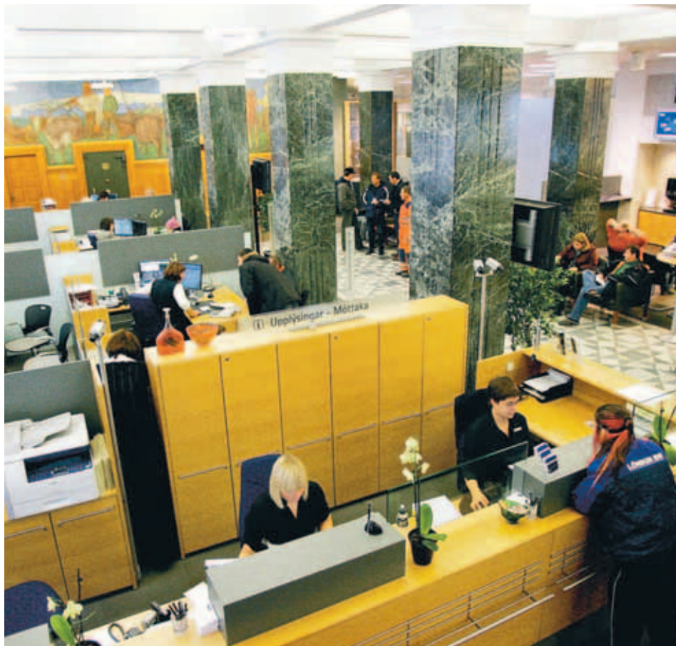
VIÐ GJALDKERABORÐIÐ Trúnaður banka við viðskiptavini kann að hafa skírskotanir við annan trúnað, svo sem lækni við sjúkling sinn, eða prests við sóknarborn. Eftir hrun bankanna hefur ágerst umræða um hvort aflétta beri bankaleynd.

Rætt var um bankaleynd á fjölmönnum borgarafundi í Háskólabíói í fyrrakvöld. Einn fyrirsprjandi undraðist að hún væri nú fyrir hendi. Fyrirsprjandinn tók þar undir með Davíð Oddssyni seðlabankastjóra, og raunar dómsmálaráðherra einnig. Davíð sagði á fundi Viðskiptaráðs fyrir viku, að bankaleynd ætti ekki við vegna gömlu bankanna. Upplýsa þyrfti hvers vegna þeir hefðu hrúnið. Björn Bjarnason