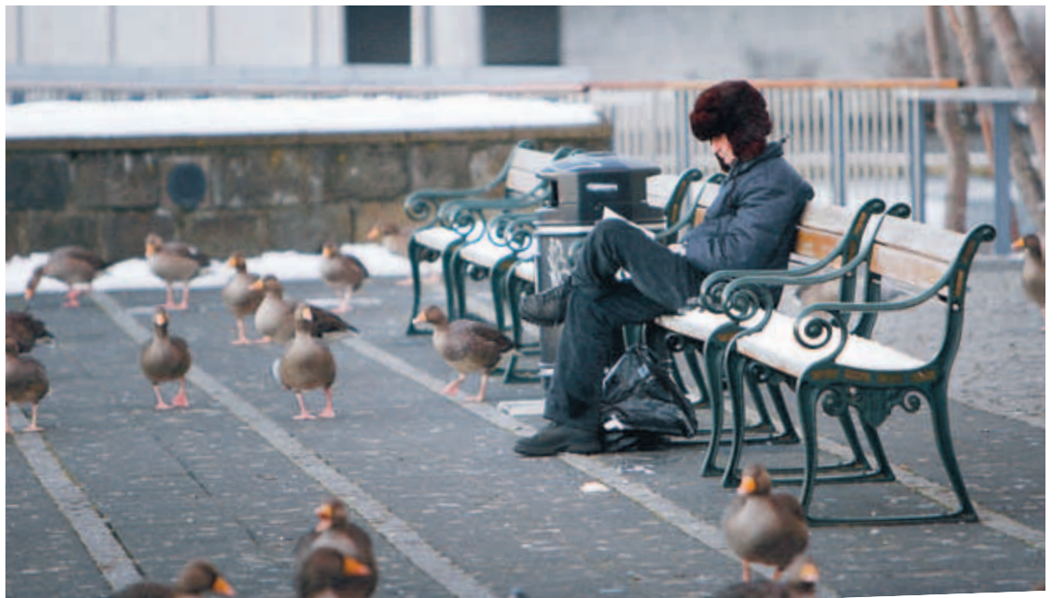
VIÐ TJÖRNINA Að líkindum hefur þessi ekki tyllt sér á bekk við Tjörnina í Reykjavík til að losa stein úr skónum, heldur til að lesa í félagskap gæsanna. Greinarhöfundur líkti jöklabréfum fyrir nokkru í Markaðnum við stein í skó, en segir nú engu líkara en efnahagslífið sé nú með hnullung í skónum.

Það verður nokkuð djúp dýfa sem við tökum hér á næstu mánuðum en við höfum alla burði til að rífa okkur upp á nýjan leik, jafnvel með hnullunginn í skónum.