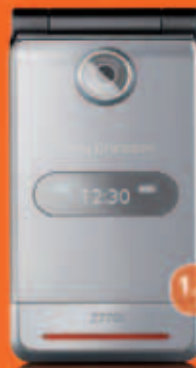
Sony Ericsson Z770i útborgun