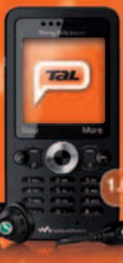
Sony Ericsson W302 útborgun