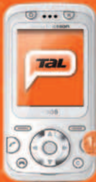
Sony Ericsson F305 útborgun