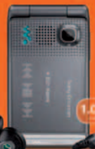
Sony Ericsson W380i útborgun