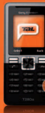
Sony Ericsson T280i útborgun