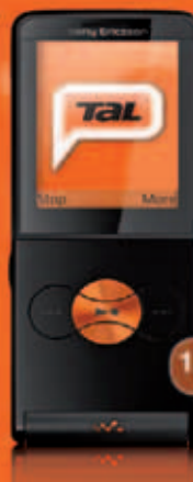
Sony Ericsson W350i útborgun