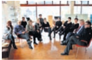
EFTIR LOKUN Starfsfólk SPRON við Skólavörðustíg á fundi skömmu eftir að isjóðurinn var tekinn yfir.

„Innistæðurnar sem færðust yfir í Nýja Kaupþing að beiðni stjórnvalda eru í raun skuld bankans við viðskiptavini SPRON. Þar sem innistæður eru