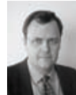
Hr. Gylfi Magnússon Viðskiptaráðherra