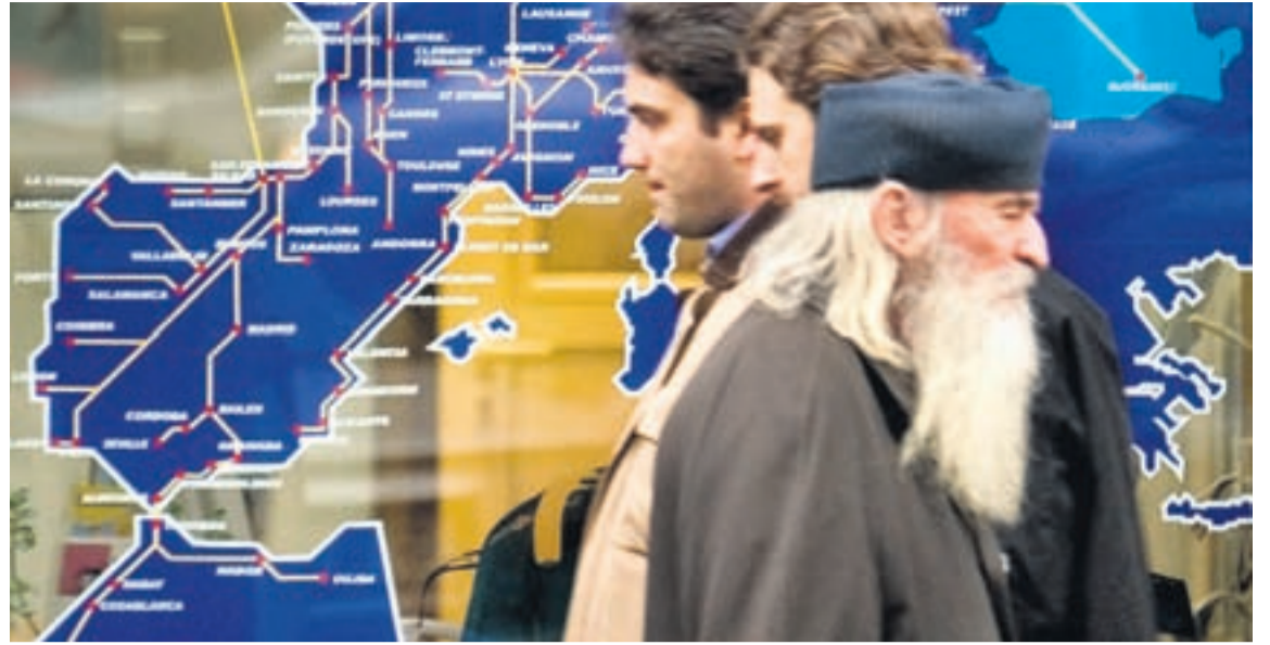
VIÐ EVRÓPUKORT Myndin er tekin í Rúmeníu um það bil sem landið gekk í Evrópusambandið. Greinarhöfundur segir mikilvægt að hlusta sé á ákall atvinnulífs hér á landi og skýrra svara leitað um áhrif aðildar að Evrópusambandinu.

Alþjóðlega lausafjárekreppan og vandræði sem hlutust af undirmálslánnum í Bandaríkjunum eru hins vegar ekki nema hluti af þeim þáttum sem aukið hafa á vandkvæði í fjármála- og efnahagsstjórn hér á landi. Ísland var þegar á leiðinni inn í krefjandi samdráttarskeið og búið var að birta ófáar greinar og skýrslur um möguleika þjóðarinnar á að ná „mjúkrri lendingu“.