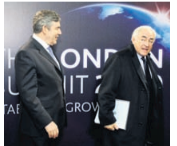
GORDON BROWN OG DOMINIQUE STRAUSS-KAHN Forsætisráðherra Breta og framkvæmdastjóri Alþjóðagjaldeyrissjóðsins ræðast hér við um leið og þeir ganga inn í ráðstefnusal Excel miðstöðvarinnar í Lundúnum þar sem G20-fundurinn fór fram í byrjun mánaðarinnar.

Meðal þátta sem fjallað er um í skýrslunni er samþil skuldatryggingarálags (e. CDS spread) fjármálafyrirtækja og þjóðríkja. Eðli skuldatryggingar-