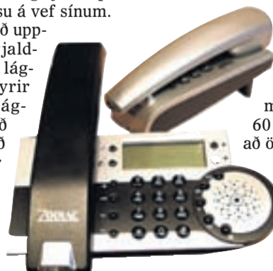
SÍMTÆKI Póst- og fjarskiptastofnun vekur á vef sínum athygli á rétti neytenda til að fá endurgjaldslaust sundurlíðun símtala. Á grundvelli slíkra gagna geti þeir svo valið þá áskriftarleið sem hagkvæmest er fyrir þá.

Önnur fyrirtæki en Síminn og Vodafone hafa ekki tilkynnt PFS um breytingar á tímamælingum. Tal hefur notað fyrirkomulagið 60/60 og Nova 30/30. - óka