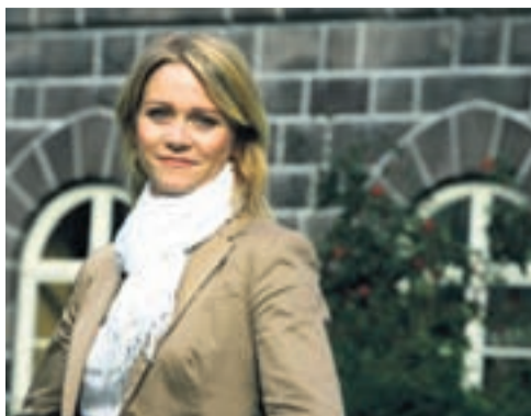
KATRÍN JÚLÍUSDÓTTIR Iðnaðarráðherra segir allar skammtímalausnir út úr kreppunni fela í sér að við lokumst inni í samfélagi hafta og skömtunar.

„Íslensk fyrirtæki þurfa að njóta bestu vaxtar- og samkeppnisskilyrða og þar eru hindrunarlaus millirikjaviðskipti og aðgangur að er-