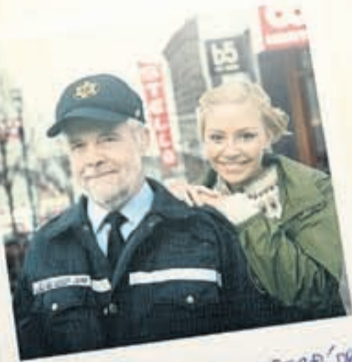
REYKJAVÍK VERSLUNAKFERÐ '08