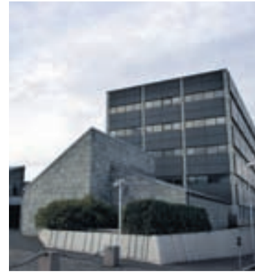
SEÐLABANKINN Ekkert fyrirtæki er enn komið með heimild til að taka erlend lán í íslenskum krónum.

Ekkert fyrirtæki hefur sent Seðlabankanum ítarlegri upplýsingar og því enginn kominn með heimild til lántökunnar, að sögn Tómasar.