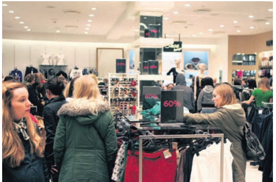
Í BÚÐINNI Greinarhöfundur bendir á að Bandaríkin gangi nú í 23. sinn í gegnum efnahagssamdrátt, að vísa óvenju mikinn og langvinnan. Á tímum sem þessum sé mikilvægt að missa ekki sjónar á langtímamarkmiðum fyrirtækja.

Mistök bankamanna og almennings í að velja sér fólk til stjórnarstarfa breytir því þó ekki að landið hefur undirgengist skuldbindingar á alþjóðavísu [...] Fráleitt er að ætla að stilla sér upp í einhverju fórnarlambshlutverki og skæla sig frá ábyrgð sinni.