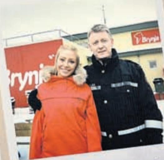
AKUREYRI SKÍÐAFERÐ 2009