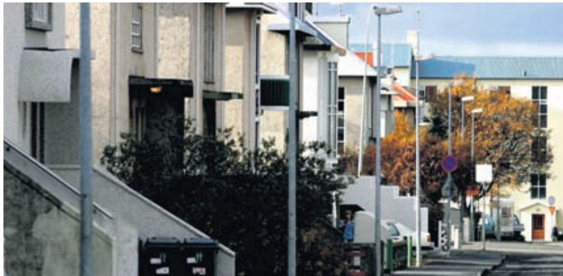
Í HLÍÐUNUM Í REYKJAVÍK Greinarhöfundur bendir á að nokkur tímamót hafi orðið með útgáfu ríkisins á flokki óverðtryggðra ríkisbréfa með gjalddaga árið 2025. Nú geti fólk vegið og metið hvort henti betur verðtryggt eða óverðtryggt húsnæðislán.

Nauðsynlegt er að gera sér grein fyrir að staðan sé erfið, en um leið er algjör óþarfi að mála hlutina of dökkum litum.