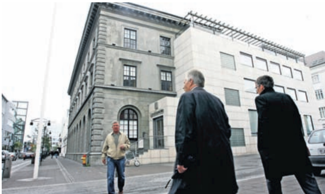
Í AUSTURSTRÆTI Í REYKJAVÍK Bankafólk og almenningur halda áfram að sinna sínum málum í fjármálafyrirtækjum landsins þótt landslag hafi þar allt tekið miklum breytingum við hrun stóru bankanna í október síðastliðnum. Viðhorf fólks til banka og sparisjóða hafa hins vegar breyst og algengara en ekki að fólk láti markaðsstarf þeirra eftir hrun fara í taugarnar á sér.

Hálftu ári eftir hrúnið, þegar könnunin var gerð er fólk enn efst í huga vonbrigði, angist og reiði þegar það hugsar til bankanna. Þar á eftir kemur kvíði, vonleysi, óryggi og vanmáttur. En jafnframt bærast með fólkí von um mannlegri áherslu í starfsemi banka og mögulegar breytingar til hins betra. „Stóra breytingin sem orðið hefur á viðhorfum fólks til bankanna er sú að viðhorfin eru nú eru mótuð af mjög mikilli tilfinningasemi í stað þess að vera mótuð af rökréttum hugsunum eins og var mjög