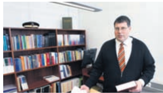
SÉRSTAKUR SAKSÓKNARI Þeir sem rannsaka efnahagshrunið þurfa stundum að leggja mál frá sér þegar önnur brýnni koma upp.

Hann bendir á að starfsmenn embættisins hafi stundum þurft að leggja önnur mál tímabundið til hliðar þegar beina hafi þurft kröftunum að öðrum og brýnni. Við húsleitina á föstudag hafi nær allir starfsmenn lagst á eitt enda hald lagt á meira magn gagna en í fyrri húsleitum.