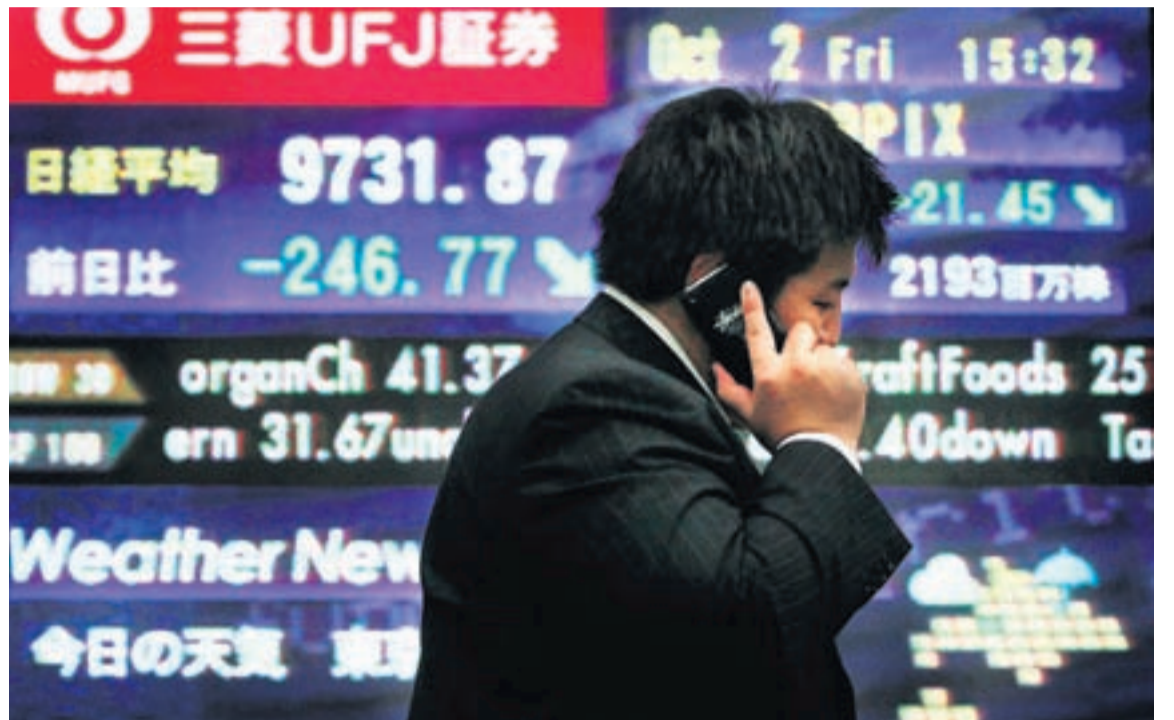
TALNASÚPUR Á VEGG Verðbréfamarkaðurinn í Japan tók svoltið stökk upp á við í gær, rétt eins og í Bandaríkjunum. FRÉTTAÐIÐ/AF