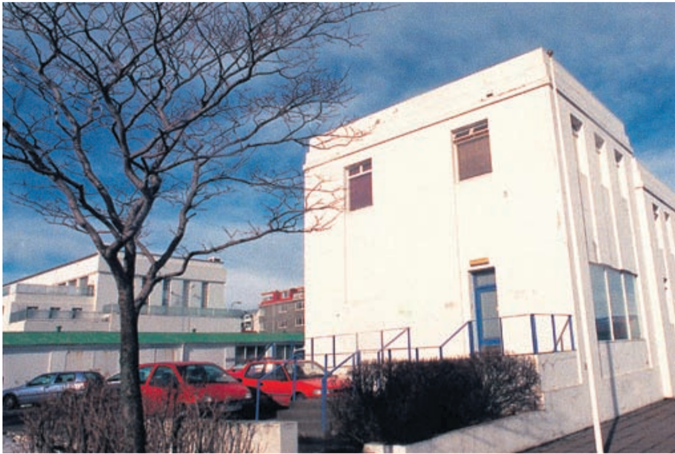
OZ VIÐ SNORRABRAUT Ljósleiðari tengdi saman hús höfuðstöðvanna hér á landi. Það þótti framúrstefnulegt og fékk heilmikla umfjöllun í fjölmiðlum.

Í kjölfarið tók við þrotlaus þróunarvinna. Árangurinn var sýndur á tölvusýningu í Asíu árið 1995 og stóðst væntingar. En fjármagn skorti. „Ég hafði heyrt af því að Japanir hugsuðu lengst fram í tímann. Þeir voru einir á þessum tíma sem fjármögnuðu rannsóknir og þróun á flötum