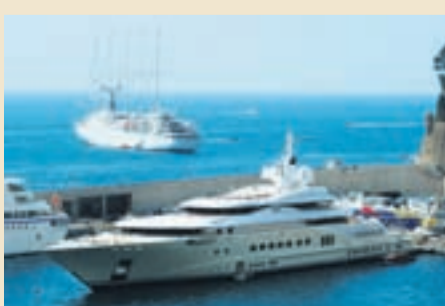
AUÐMANNASNEKKJA Nokkur af bestu lánunum Kaupþings Singer & Friedlander voru til kaupa á glæsilegum skonnortum.

Ármann segir Singer & Friedlander hafa stundað þess háttar viðskipti í mörg ár áður en Kaupþing keypti bankann. „Þetta var traustur business. Yfirleitt var verið að lána mjög traustum einstaklingum – ríkustu mönnum heims. Tryggingar á bak við lánin voru mjög góðar,“ segir hann og bendir á að heimtur af snekkjulánunum séu hátt í hundruð prósent í þrotabúi KSF.