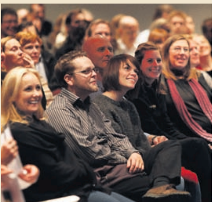
GLATT Á HJALLA Gestir skemmtu sér vel á ráðstefnunni eins og sjá má.