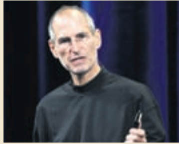
FORSTJÓRINN Tæknirísinn Apple segir bandaríska verslunarráðið ekki nógu framsækið.