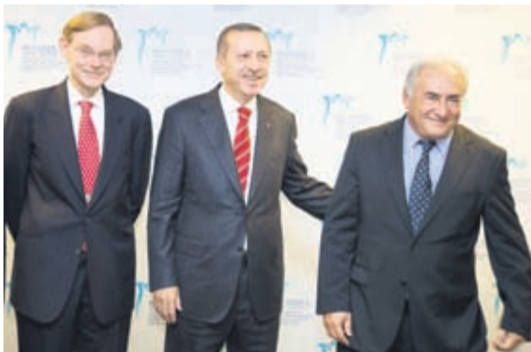
ÁRSFUNDUR Í TYRKLANDI Gestgjafinn, Recep Tayyip Erdogan, forsætisráðherra Tyrklands, stendur á milli þeirra Roberts Zoellicks, forseta Alþjóðabankans, og Dominique Strauss-Khans, framkvæmdastjóra Alþjóðagjaldeyrissjóðsins.

Umræðan þar hefur einkum snúist um tvennt: annars vegar um nauðsynlegar umbætur á þessum tveimur stofnunum og hins vegar hvernig best megi tryggja að ríki heims nái sér upp úr kreppunni.