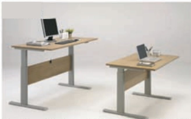
Hæðarstillanleg skrifborð frá kr. 69.700