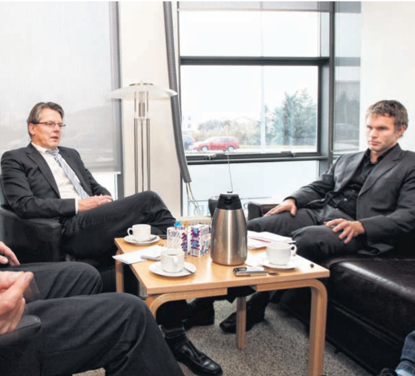
ferli, að mati skuggabankastjórnar Markaðarins. Bankastjórnin telur mjög jákvætt að kröfuhafar taki ráðandi hlut í bönkunum enda muni þeir geta rekið þá vel. Skráning þeirra á markað er um hreyfingar á eignarhlutum í bönkunum.