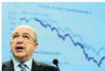
JOAQUIN ALMUNIA Framkvæmdastjóri efnahags- og peningamála.