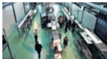
MAREL Fyrirtækið skilaði meiri hagnaði en búist var við á þriðja ársfjórðungi ársins.

Þótt hagnaður Marel Food System sé minni nú en fyrir ári er hann talsvert yfir væntingum stjórnenda Marel's sem bjuggust