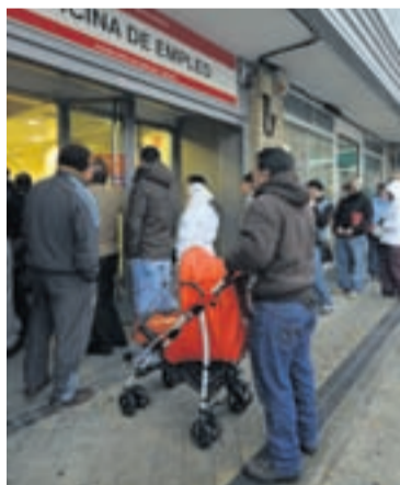
ATVINNULAUSIR Á SPÁNI Fjöldunin er minni en í október í fyrra.