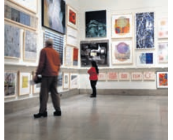
ÁHUGASAMIR SKOÐA VERKIN Troðið var út úr dyrum á uppboði á verkum í eigu þrotabús fjárfestingarbankans Lehman Brothers um helgina.

Afrakstur uppboðsins, 1,34 milljónir dala, geng-