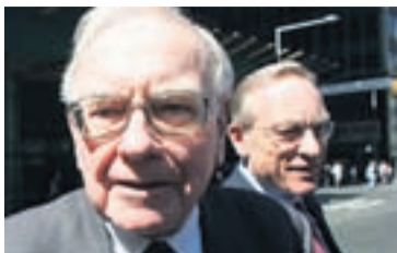
WARREN BUFFETT Hann ætlar að veðja á að hækking verði á eldsneyti muni verða til þess að járnbrautir verði hagkvæmari flutningsmáti en vörubílar.

Fyrir utan Burlington hefur Buffett verið að byggja upp eignarhlut í Fort Worth járnbrautar-