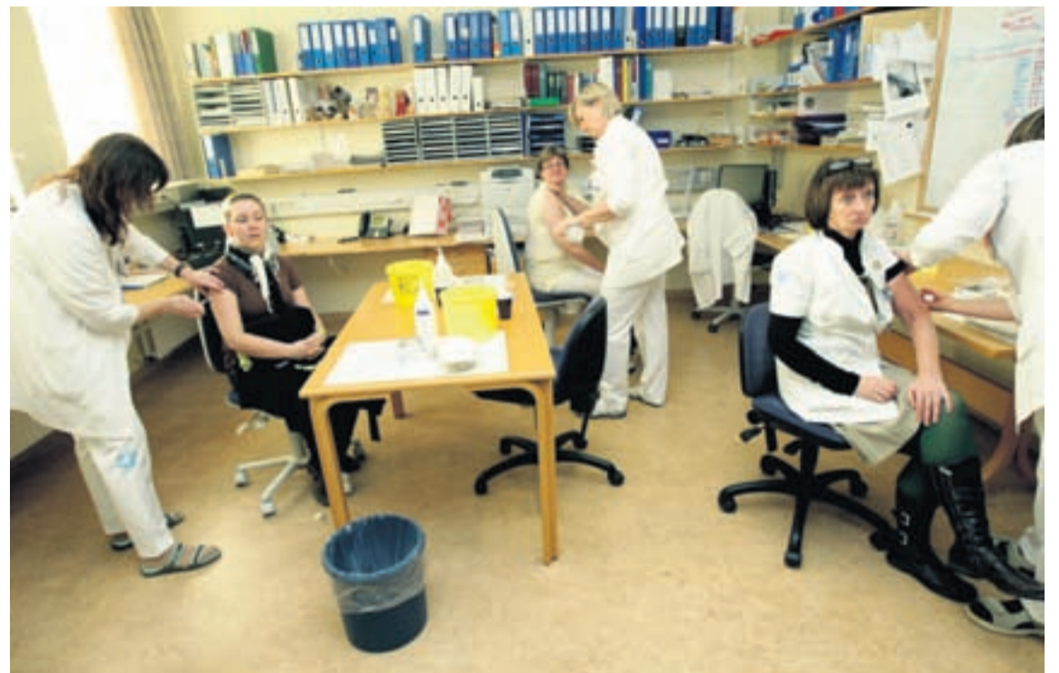
BÓLUSÉTNING GEGN SVÍNAFLENSU Samkvæmt útreikningum Vísbendingar verður heildarkostnaður við svínaflensubóluefni hér 380 milljónir króna.

Einnig verða í grunninn upplýsingar um kvótakerfið; eigendur fiskveiðheimilda og sölu og leigu aflaheimilda milli aðila.