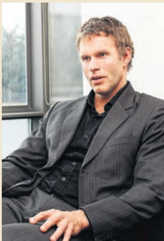
INGÓLFUR BENDER SKUGGABANKASTJÓRN

Frá síðasta vaxtaákvörðunarfundi peningastefnunnar Seðlabankans hefur ýmislegt áunnist sem ætti að auka trúverðugleika íslensks efnahagslífs. Má þar nefna áfangasigra í uppbyggingu fjármálakerfisins og samþykkt Alþjóðagjaldeyrissjóðsins á fyrstu endurskoðun efnahagsáætlunar sjóðsins og íslenskra stjórnvalda. Þá hefur verið stigið fyrsta skrefið í afnámi gjaldeyrishafta, friður hefur verið tryggður á vinnumarkaði til árs og lagt hefur verið fram frumvarp til fjárlaga fyrir næsta ár þar sem boðað er talsvert aðhald. Síðan hefur verðbólga hjaðnað nokkuð þó að það hafi verið öllu minna en spáð var. Einnig hafa vextir á milli-bankamarkaði með krónur hækkað í takti við það sem ráð var fyrir gert með ákvörðun um útgáfu innistæðu á síðasta fundi peningastefnunnarinnar. Þannig hefur trúverðugleikinn verið aukinn á sama tíma og aðhaldsstig peningastefnunnar hefur farið vaxandi. Hvorutveggja gefur tilefni til lækkunar vaxta Seðlabankans nú.