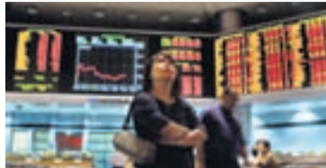
RÝNT Í MARKAÐURINN Sumir kjósa að sveipa hlutabréfaviðskipti sín leyndarhjúp.

Breska dagblaðið Financial Times segir aukið eftirlit með hlutabréfaviðskiptum valda því að sumir fjárfestar kjósi að fela