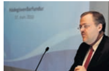
GYLFI MAGNÚSSON iðskiptaráðherra og fleiri vilja að bankarnir birti fjárhagsupplýsingar fyrirtækja í þeirra umsjón oftar en þeim er skylt að gera.

Hann mælti með því á fundi Félags viðskiptafræðinga og hagræðinga á dögum að bankarnir birti bæði ársreikning og sex mánaða uppgjör fyrirtækja í þeirra umsjá ekki seinna en þremur mánuðum eftir lok árs. Annað geti skekkt samkeppnisstöðuna.