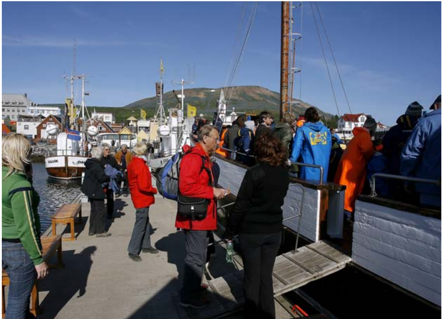
Á LEIÐ Í HVALASKOÐUN Á HÚSAVIK Hvalaskoðun er hægt að stunda árið um kring og hafa meðal annars verið gerðar út ferðir frá Reykjavík í allan vetur. Samtök ferðaðjónustunnar leggja áherslu á að byggja upp afþreyingu og þjónustu fyrir ferðamenn utan þess tíma sem hingað til hefur verið háannatími. Með því og auknum stuðningi megi laða hingað erlenda ferðamenn og auka gjaldeyrstekjur þjóðarinnar árið um kring.