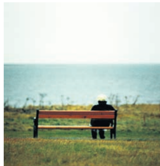
ÁHYGGJULAUST ÆVIKVÖLD Lífeyrir hefur hækkað undanfarin ár, enda verðtrygður. Fram undan er hins vegar skerðing greiðslna til lífeyrisþega hjá fjölmörgum sjóðum.

Við þær aðstæður, sem eru í innlendu efnahagslífi, segja heimildir Markaðarins að forsvarsmenn sjóðanna hefðu viljað nýta sér heimildir til erlendra fjárfestinga í mun meiri mæli en gert var að jafnaði fyrir hrún. Miðað við það sé sennilegt að sjóðirnir