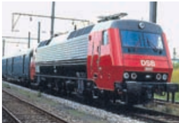
DÖNSK LEST Á HRADFERÐ Starfsmenn Applicon hér og í Danmörku munu vinna við hagræðingu á dönsku ríkisjárnbraut-

Dönsku jarnbrautirnar flytja 168 milljónir farþega á ári og er með áttatíu prósent af lestarsam-