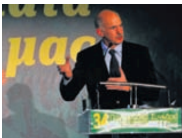
MÁLIN RÆDD George Papandreou, forsætisráðherra Grikklands, ræddi um stöðu efnahagsmála á fundi samtaka grískra fyrirtækja um miðjan síðasta mánuð.

Bláðið hefur eftir sérfræðingi hjá greiningarfyrirtækinu Credit-Sights, að grískir bankamenn hafi