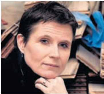
SVAVA Þrjú fyrrverandi starfsmenn Actavis hafa verið ráðnir til lyfjafyrirtækis sem Róbert Wessman stýrir.