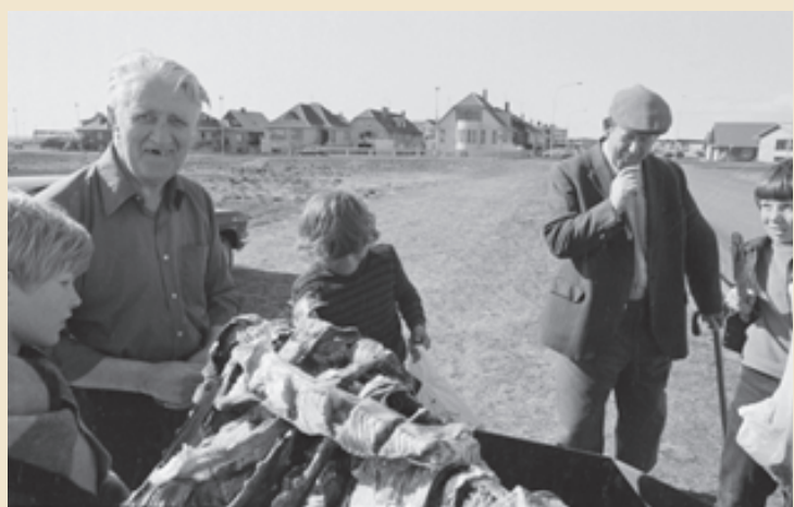
HÖNDLAÐ MEÐ FISKINN Ungir piltar námu af þeim eldri að selja signa grásleppu og annan afla á árum áður. Sala sem þessi heyrir nú sögunni til.