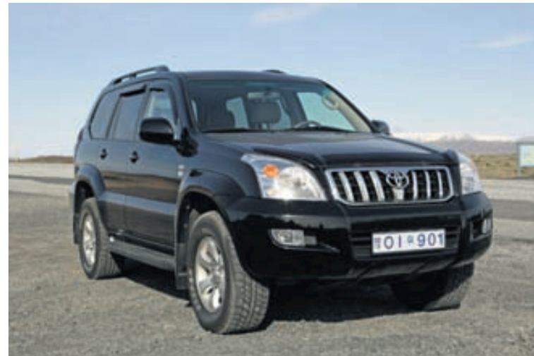
TOYOTA LAND CRUISER 120 Kolbikasvartur og vel við haldinn jeppinn veur athygli þar sem á honum er komið. Bíllinn er verulega lipur í akstri þótt ökumaður glati samt aldrei tilfinningunni sem því fylgir að vera undir stýri á jeppa.

Þá er skemmtilegt að hafa meðal mælitækja í mælaborði hæðar- og loftþrýsingsmæli, en að auki er vitanlega hægt að sjá upplýsingar