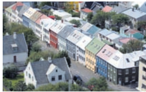
REYKJAVÍK Í FYRRASUMAR Fasteignamarkaðurinn er almennt að taka við sér víða á meginlandi Evrópu, samkvæmt samantekt Financial Times um þróun á alþjóðlegum fasteignamarkaði.