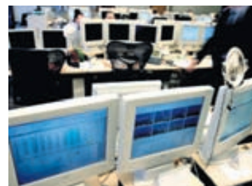
MARKAÐSUPPLÝSINGAR Mörg fyrirtæki hafa áhuga á skráningu á hlutabréfamarkað á Norðurlöndunum.

Lítið hefur verið um nýskráningar á Norðurlöndunum á árinu. Aðeins fjögur fyrirtæki hafa verið skráð hjá Nasdaq OMX á Norðurlöndunum á þessu ári að Danmörku undanskilinni. Þar hefur ekkert félag verið skráð. Skráning færseyska fiskeldisfélagsins Bakkafrósts í norsku kauphöllina nú í mars er önnur skráningin þar.