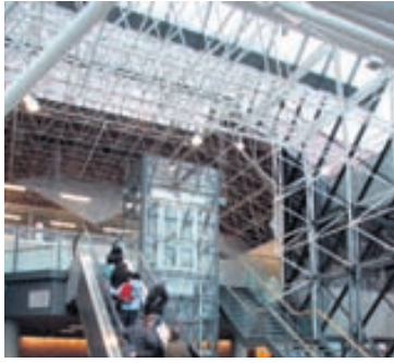
LEIFSTÖÐ Umferð um Flugstöð Leifs Eiríkssonar hefur aukist mikið á undanförunum árum.

Ferðamönnum frá Norður-Ameríku hefur fjölgað töluvert á árinu miðað við árið í fyrra en ferðamönnum frá flestum öðrum markaðssvæðum hefur fækkað. - mþl