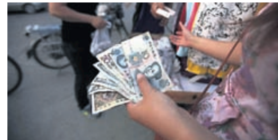
AUKINN KAUPMÁTTUR Kínverskur almenningur mun njóta góðs af styrkingu júansins með auknum kaupmátti.

Ástæður þess að Kínverjar vilja að júanið styrkist eru fjölbreyttar. Mestu skiptir að næstum tíunda hluta landsframleiðslu er nú varið í að kaupa erlend ríkisskuldabréf (aðallega bandarísk) til þess að koma í veg fyrir að júanið styrkist borið saman við dollaran. Margt annað er hægt að gera fyrir þá peninga eins og gefur að skilja. Gengisstyrkingin mun einnig auka kaupmátt kínverskra neytenda og gera bensín og aðrar innfluttar vörur ódýrari. Hún gagnast þó fleiri þjóðum en Kínverjum. Styrkist gengið munu vörur frá öðrum löndum að lokum verða sam-