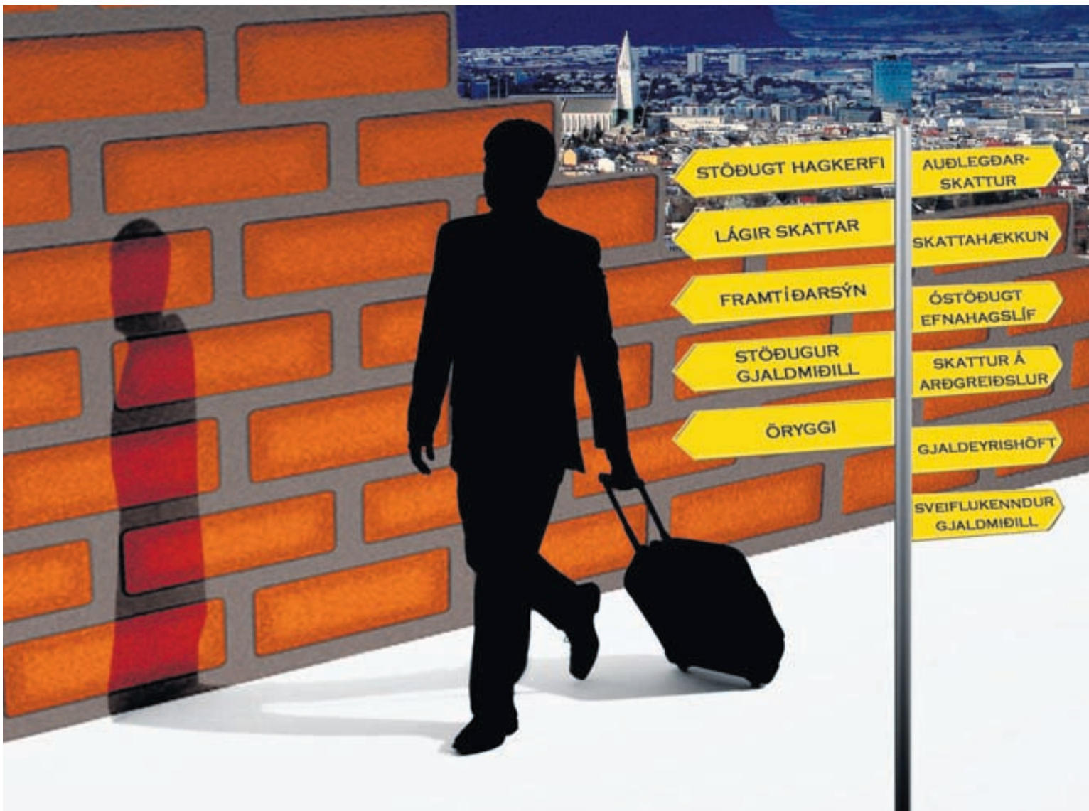
BLESS ÓSTÖÐUGA UMHVÆRFI Rekstrarumhverfi íslenskra stórfyrirtækja í alþjóðlegum rekstri er ótryggt sökum illa ígrundaðra skattabreytinga. Líklegt að hluti fjárfesta sem hafa fært lögheimili sitt í annað land séu að flýja stóreignaskatta. Stjórnendur stærstu fyrirtækja landsins hafa fengið skattasérfræðinga sína til að fara yfir kosti og galla skattkerfisins.