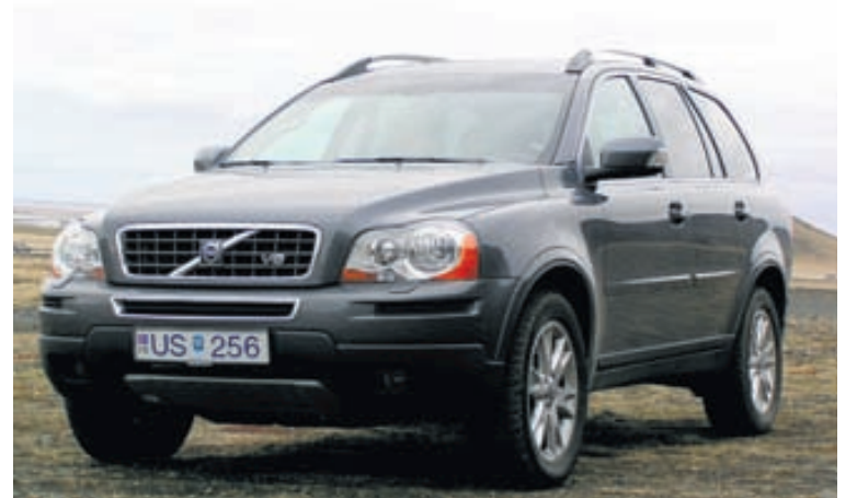
VOLVO CX90 SE+ Volvoinn er í stærðarflokki með jepplingum frá BMW og Audi. Prufueintakið er með 18 tommu álfelgur og 315 hestafla skrimslí undir húddinu.

Þá er vert að nefna að bíllinn er líka með rauf fyrir farsíma-