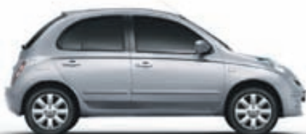
NISSAN MICRA - Verð frá 2.490.000 kr.