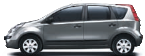
NISSAN MICRA - Verð frá 2.740.000 kr.