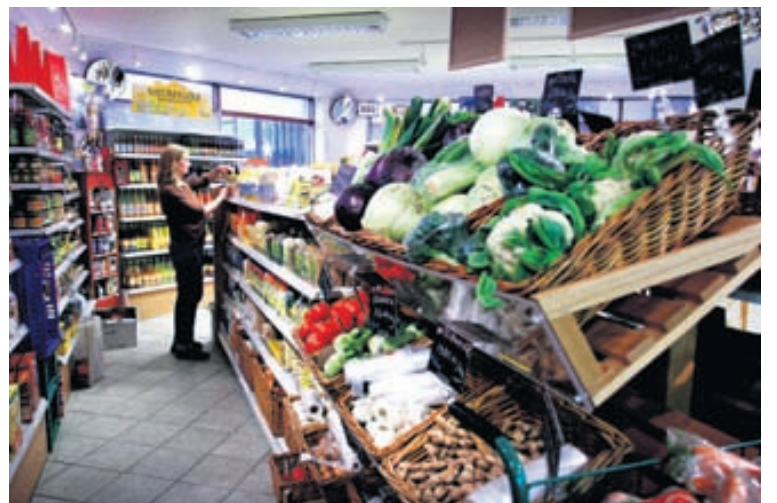
ÚR VERSLUN YGGDRASILS Lífeyrissjóðir eru stórir innflytjendur á lífrænum matvælum í gegnum fagfjárfestingarsjóð Auður Capital.

Kaupverð 19,5 milljarðar króna Heildarverðmæti eigna Framtakssjóðsins (auk Vestia): 22,5 milljarðar króna