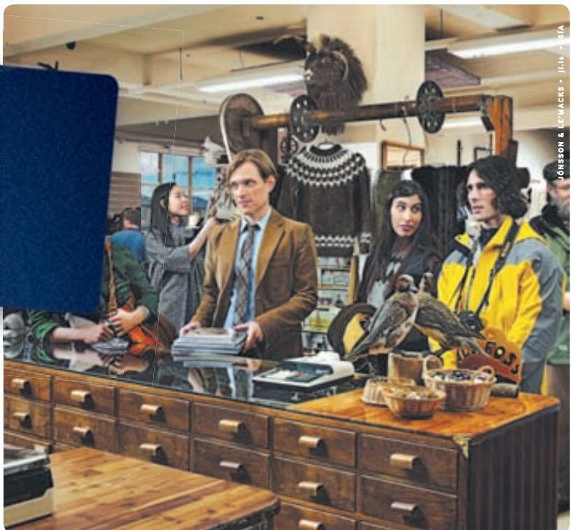
JÓHANSSON & LEWIS - Jóns - SÍ