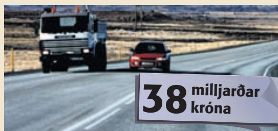
LITLI OG STÓRI Á GÖTUM ÚTI Á meðal fyrirhugaðra verkefna lífeyrissjóðanna er breikkun Suðurlandsvegur að hluta á milli Selfoss og Reykjavíkur.

Samið var um aðkomu lífeyrissjóðanna að byggingu sjúkrahússins í nóvember í fyrra. Spítali