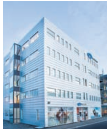
NÝHERJAHÚSIÐ Nýherji hefur gert samning um fimm títán ára leigu á húseign sem félagið hefur selt.

ÞESSAR TVÆR BRÉFAKLEMMUR ERU EKKI ALVEG EINS