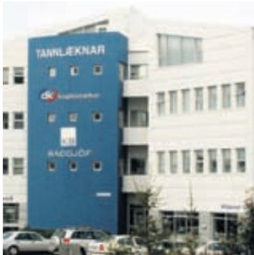
KB RÁÐGJÖF Sér um lífeyrissparnaðarleiðina Vista fyrir Arion banka.

Holder sagði fyrirtækin hafa haldið neytendum í gíslingu, en nú eigi að snúa því við og neytendur eigi að hagnast. - gb