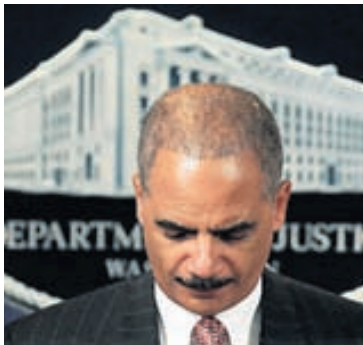
ERIC HOLDER Dómsmálaráðherra Bandaríkjanna.