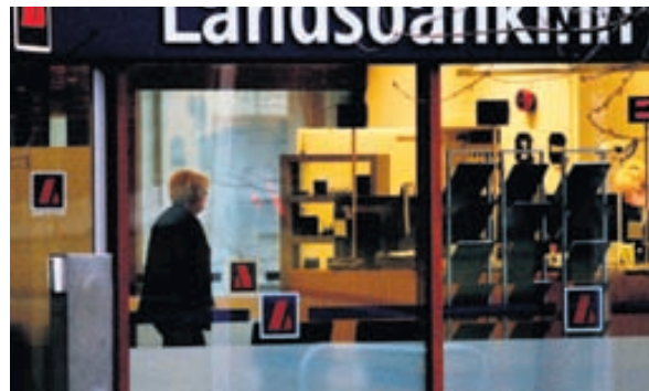
NÝRÁÐNINGAR Landsbankinn réði til sín átta nýja framkvæmdastjóra í gær. 300 manns sóttu um stöðurnar.