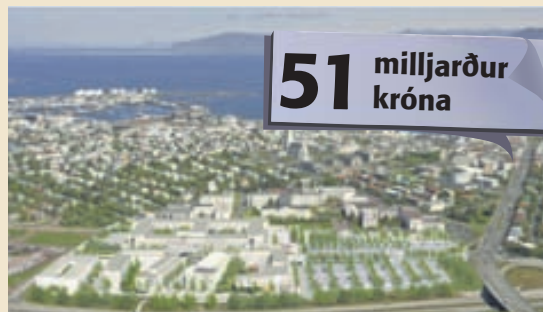
SJÚKRAHÚS FRAMTÍÐARINNAR Þessi tölvuteiknaða mynd af nýju háskólasjúkrahúsi sýnir hvernig það mun líta út. Lífeyrissjóðirnir munu eiga húsið en hafa af því leigutekjur.

hönnunarhópurinn hafði betur í samkeppni um tilögur að byggingunni í júlí í sumar og hefur verið samið við hann um frumhönnun og gerð alútbodsgagna. Frumhönnun mun í fullum gangi og fer hún hljóðlega þótt samstarf við lífeyrissjóðina sé lítið enn sem komið er.