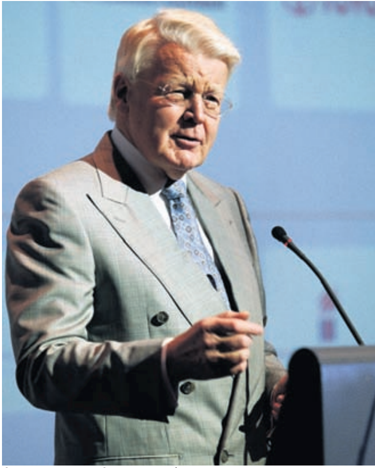
ÓLAFUR RAGNAR GRÍMSSON Forseti Íslands segir Reykjavík geta orðið fyrstu borg í heimi til að verða 100 prósent vishæf, með því að húshitun byggji á jarðvarma og bílar aki um á vishæfu innlendu eldsneyti.

„Kína ætlar sér að taka í notkun eina milljón bíla sem nota vishæfa orku innan fárra ára,“ benti Ólafur Ragnar á í ræðu sinni, en hann var við setningu ráðstefnunnar nýkominn frá Kína. Hann