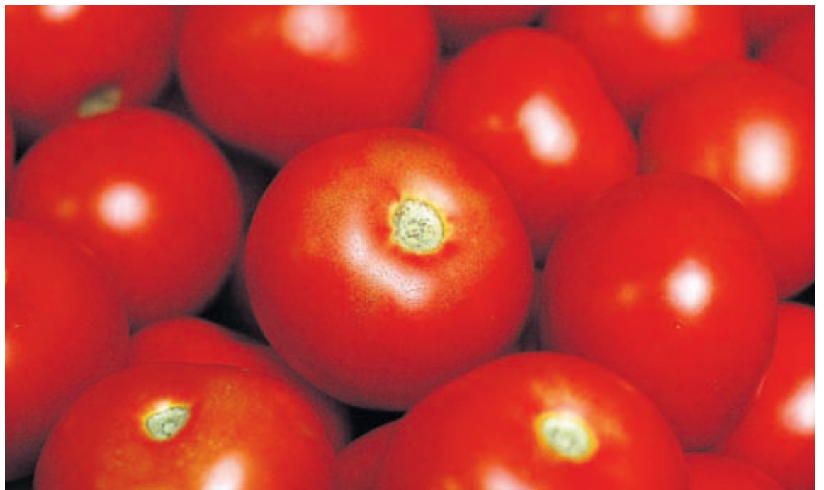
TÓMATAR Sumar undirgreinar íslenskrar garðyrkju gætu liðið fyrir afnám verndartolla með inngöngu í Evrópusambandið, samkvæmt niðurstöðu skýrslu Hagfræðistofnunar Háskóla Íslands.