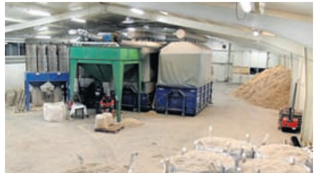
FENGUR Fyrirtækið framleiðir spón fyrir íslenskan landbúnað og hyggur á frekari vörubrúun.