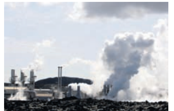
HS ORKA Eignir félagsins nema nú 41,7 milljörðum króna, þar af er hlutfé 17,5 milljarðar. -fri

Ef þriðji ársfjórðungur er skoðaður kemur í ljós að hagnaður á honum hefur þrefaldast milli ára. Er 3,6 milljarðar króna í ár en var rúmlega 1,2 milljarðar króna í fyrra.