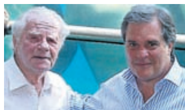
STJÓRNENDUR SKEMMTIGARÐA Rekstur skemmtigarða er ekki alltaf dans á rósum. Eigandi Parques Reunidos á í basli með að losa sig við garðinn.

Candover var á meðal helstu fjárfestingarsjóða Evrópu en lenti í vandræðum eins og önnur félög sem stunduðu skuldsettar yfirtökur í aðdraganda fjármálakreppunnar. Félagið gat ekki staðið við skuldbindingar og hafa