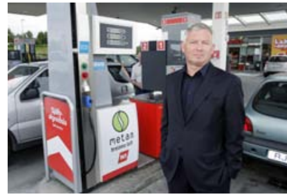
HERMANN Skuldir N1 lækka verulega með yfirtöku kröfuhafa á félaginu. Eiginfjárlutfallið verður tvöfalt herra en áður.

Hermann sagðist í samtali við Fréttablaðið í september í fyrra litlar áhyggjur hafa af skuldabyrði félagsins. Hún sé ekki meira áhyggjuefni en hver önnur endurfjármögnun. Spurður þá að því hvernig N1 geti borið alla þá byrði svaraði hann því til að farið verði að vinna í endurfjármögnun skuldabréfaflokksins þegar nær dragi áramótum. Um skuldir eigendanna sagði hann: „BNT gæti selt N1 og greitt upp skuldir sína. Það er valkostur en hefur ekki verið skoðaður í neinni alvöru.“