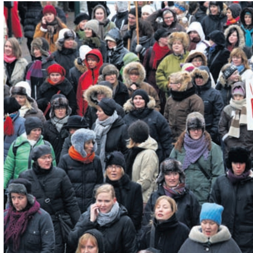
KVENNAFRÍÐAGURINN Í FYRRA Margt hefur unnist í réttindabaráttu kvenna hér á landi. Konur frá borði á vinnumarkaði. Enn er að finna kynbundinn launamun og konur eru færri í en karlar í stjórn fyrirtækja. Konur létu sig hafa leiðindaveður 25. október síðastliðinn og mótmæltu í miðbæ Reykjavíkur ójafnrétti frá fyrsta kvennafrídegningum.

Ráðuneytin leggja þá á áramót með sérstöku átaki Viðskiptaráðs Íslands, Félagi kvenna í atvinnurekstri og fleiri sem hófu í maí 2009 sérstakt átak að sama marki.