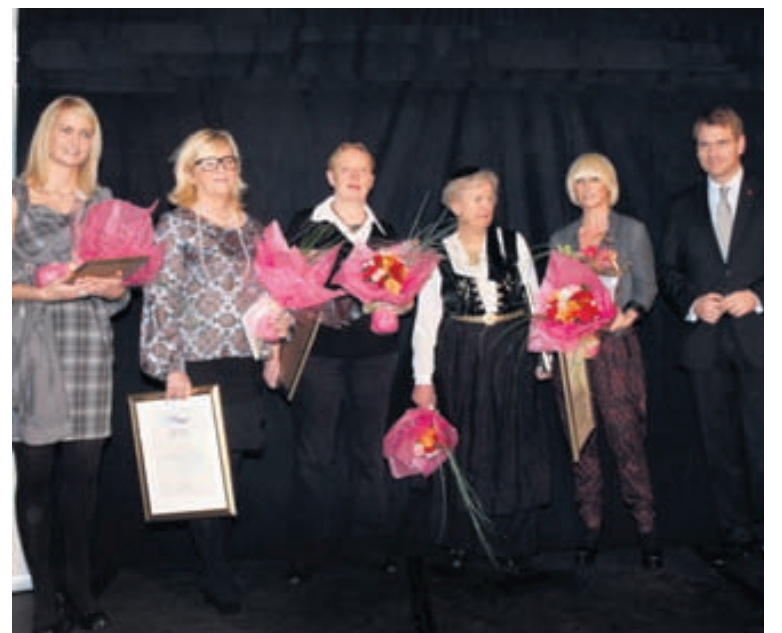
VERÐLAUNAAFHENDING FKA veitti viðurkenningar sínar í janúarlök. Þá fékk Íslandsbanki „Gæfusporið“ fyrir að auka hlut kvenna í stjórnnum bankans.