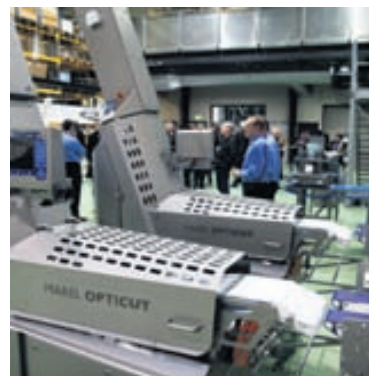
TÆKJABÚNAÐUR MARELS Samkomulag hefur náðst um lífeyrissjóð fyrrverandi starfsmanna Stork í Hollandi.