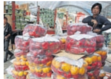
BEIÐ EFTIR VIÐSKIPTAVINI Matvöruverð hefur hækkað mikið í Kína. Landsmenn virðast hafa nóg fé á milli handanna.