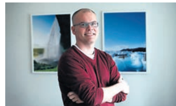
STÝRIMADUR INSPIRED BY ICELAND Íslenska auglýsingastofan hefur fengið fjölda verðlauna, bæði hér heima og erlendis, fyrir auglýsingaherferðina Inspired by Iceland.

Herferðirnar sem tilnefndar eru til Global Effie-verðlaunanna eiga það sammerkt að hafa náð til