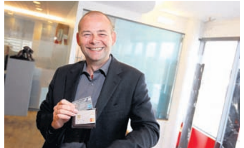
TILTEKT Tal og Vodafone vildu meina að Tal væri fyrirtæki á fallanda fæti þegar þau ætluðu að sameinast. Þeim rökstuðningi var hafnað. Forstjórinn segir viðsnúning hafa átt sér stað á þessu ári.

Tal hefur verið starfandi frá árinu 2006 en þorra þess tíma var félagið endursöluaðili á þjónustu Vodafone. Í fyrra komu nýir eigendur að félaginu og það gerði kaupleigusamning um farsíma-stöð við Símann. Frá þeim tíma hefur Tal innheimt 12,5 krónur á mínútu í lúkningargjöld. Það er sjö krónum meira en Vodafone og