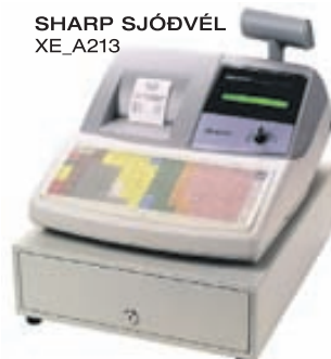
SHARP SJÓDVÉL XE_A213

Allt að 99 vöruflokkar Allt að 1200 PLU númer Sjálfvirk dagsetning og tími Hitaprentun Íslenskur strimill Raftrænn innri strimill Mjög auðveld í forritun