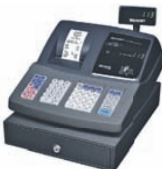
SHARP SJÓDVÉL XE_A113B

32 vöruflokkar Allt að 200 PLU númer Sjálfvirk dagsetning og tími Hitaprentun Íslenskur strimill Raftrænn innri strimill Mjög auðveld í forritun