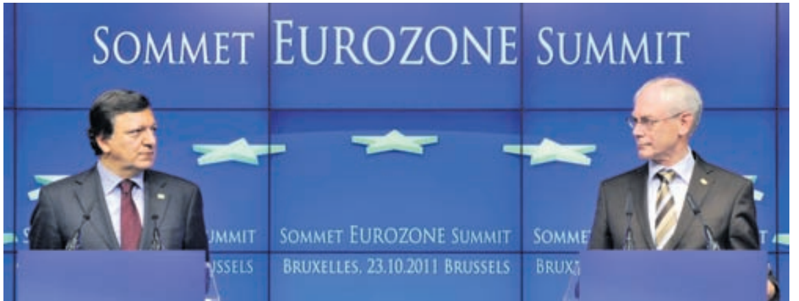
ERFIÐIR TÍMAR Mikið hefur mætt á José Manuel Barroso, forseta framkvæmdastjórnar ESB, og Herman Van Rompuy, forseta leiðtogaráðsins, síðustu daga vegna skuldavanda evrusvæðisins.

Eigið fé félagsins er 32,4 milljarðar króna og eiginfjárlutfallið 74%. Horn var stofnsett í árslok 2008 sem nokkurs konar fjárfestingaarmur Landsbankans. Tilkynnt hefur verið opinberlega að til standi að skrá Horn í Kauphöll Íslands árið 2011.