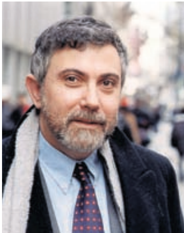
NÓBELSVERÐLAUNAHAFI Krugman verður á ráðstefnunni á morgun.

Ekki er í spánni gert ráð fyrir stórum framkvæmdum á næstu árum. Verði framkvæmdir við álver í Helgúvík og orku- og iðjuver á Norðurlandi að veruleika yki það hins vegar hagvöxt árána um 3 prósentustig.