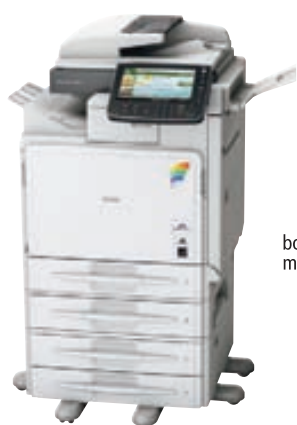
Aukabúnaður á mynd: 3 skúffueiningar

Vínlandsleið 6-8, S. 588 9000 www.optima.is