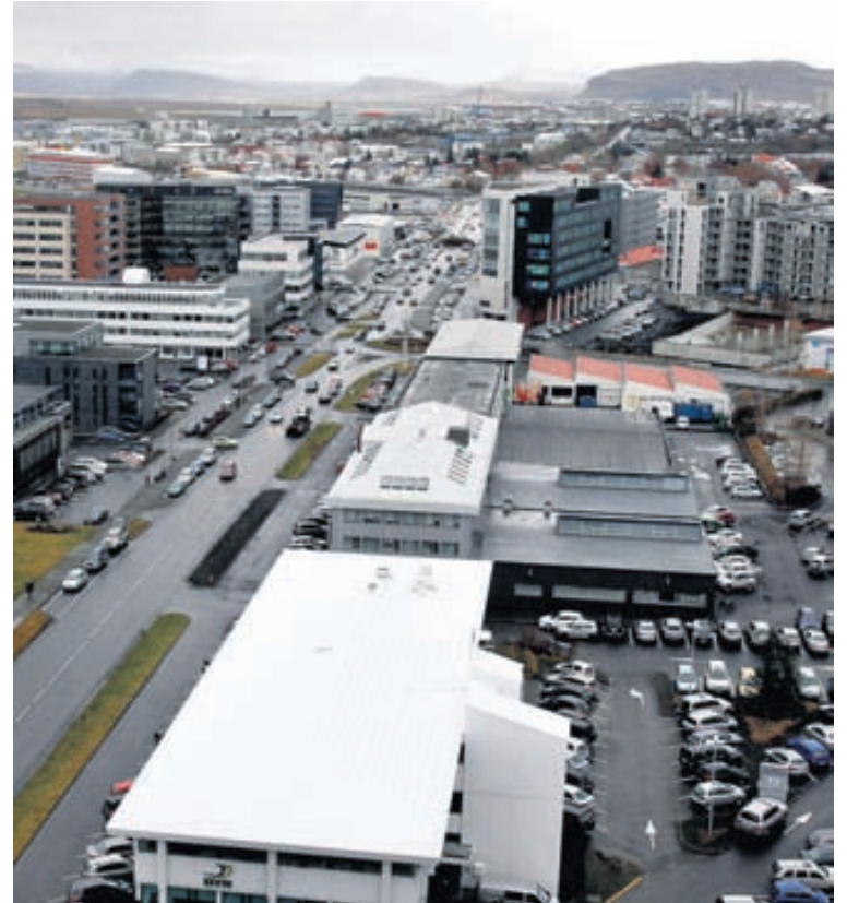
ALMANNATENGL Að mati formanns Almannatengslafélagsins er samanlögð velta fyrirtækja sem starfa við almannatengsl á bilinu 550 til 700 milljónir króna. Hann telur mikil tækifæri vera í greininni fyrir ungt fólk, þar sem lítil endurnýjun hafi orðið í stéttinni síðustu ár.

Andrés segist ekki upplifa mikla samkeppni milli fyrirtækja í greininni. „Menn rekast ekki mikið á horn hvers annars í þessum bransa. Þetta er eitt af