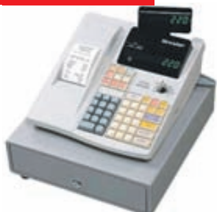
SHARP SJÓDVÉL XE-A220

15/30 vöruflokkar Allt að 500 PLU númer Sjálfvirk dagsetning og tími Hitaprentun Íslenskur strímill Rafrænn innri strímill Sérstaklega fyrirferðalítill skúffa