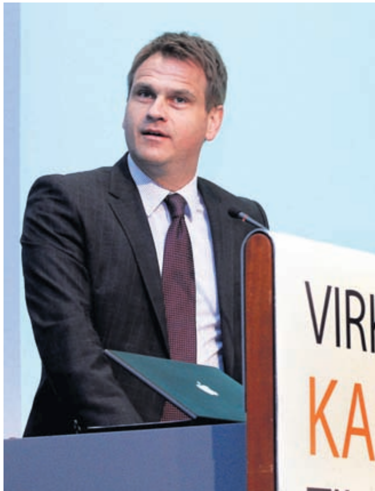
RÁÐHERRA Árni Páll Árnason segir nauðsynlegt að ábyrgð nýs kerfis verði í „ein- hverju samræmi við það sem er í sjóðnum“.

Geir H. Haarde, þáverandi forsætisráðherra, tryggði, með yfirlýsingu í október 2008, allar innstæður í innlendum bönkum og sparissjóðum að fullu. Sú yfirlýsing var endurnýjuð 3. febrúar 2009 og er enn í gildi. Árni Páll segir enga ákvörðun hafa verið tekna um að fella hana úr gildi. „Það hefur engin breyting orðið á því og hún verður í gildi þar til annað verður ákveðið.“