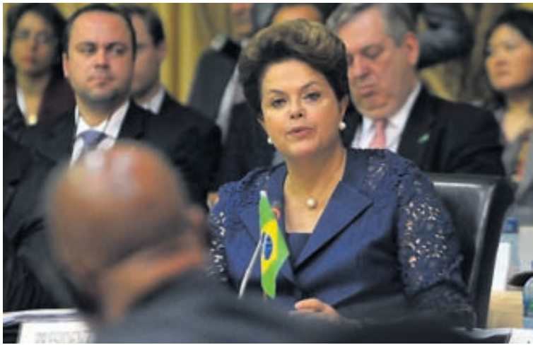
DÖKKAR HORFUR Dilma Rousseff, forseta Brasilíu, bíður erfitt verkefni að kynda aftur undir efnahagsvexti landsins. Hagvöxtur hefur stöðvast, meðal annars vegna vanda evrusvæðisins, en verðbólga setur stjórnvöldum þröngar skorður.