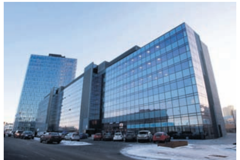
HÖFÐATORG Eigið fé félagsins var neikvætt um 10,6 milljarða króna í fyrra. Viðræður við lánardrottina hafa staðið yfir frá lokum árs 2008.

Pétur Guðmundsson segir það vera hluta af ofangreindu samkomulagi að Höfðatorg var sett í formlegt nauðasamningsferli. Það var gert 10. nóvember síðastliðinn og við það missti Pétur yfirráð