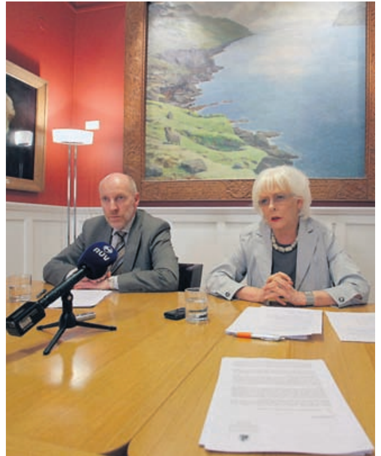
RÍKISSTJÓRN Greinargerðin var unnin fyrir ríkisstjórnina eftir að formaður Hagsmunasamtaka heimilanna afhenti forsætisráðherra undirskriftalista með nöfnum 33.525 einstaklinga þar sem krafist var almennra leiðréttinga á stökkbreyttum lánum heimilanna.

Ítrekað hefur verið haldið fram að sækja megi stóran hluta þess kostnaðar sem almennar skuldaniðurfærslur myndu fela í sér í þann afslátt sem nýju bankarnir hafi fengið á lánasöfnun sínum þegar þau voru færð yfir frá gömlu bönkunum. Höfundar