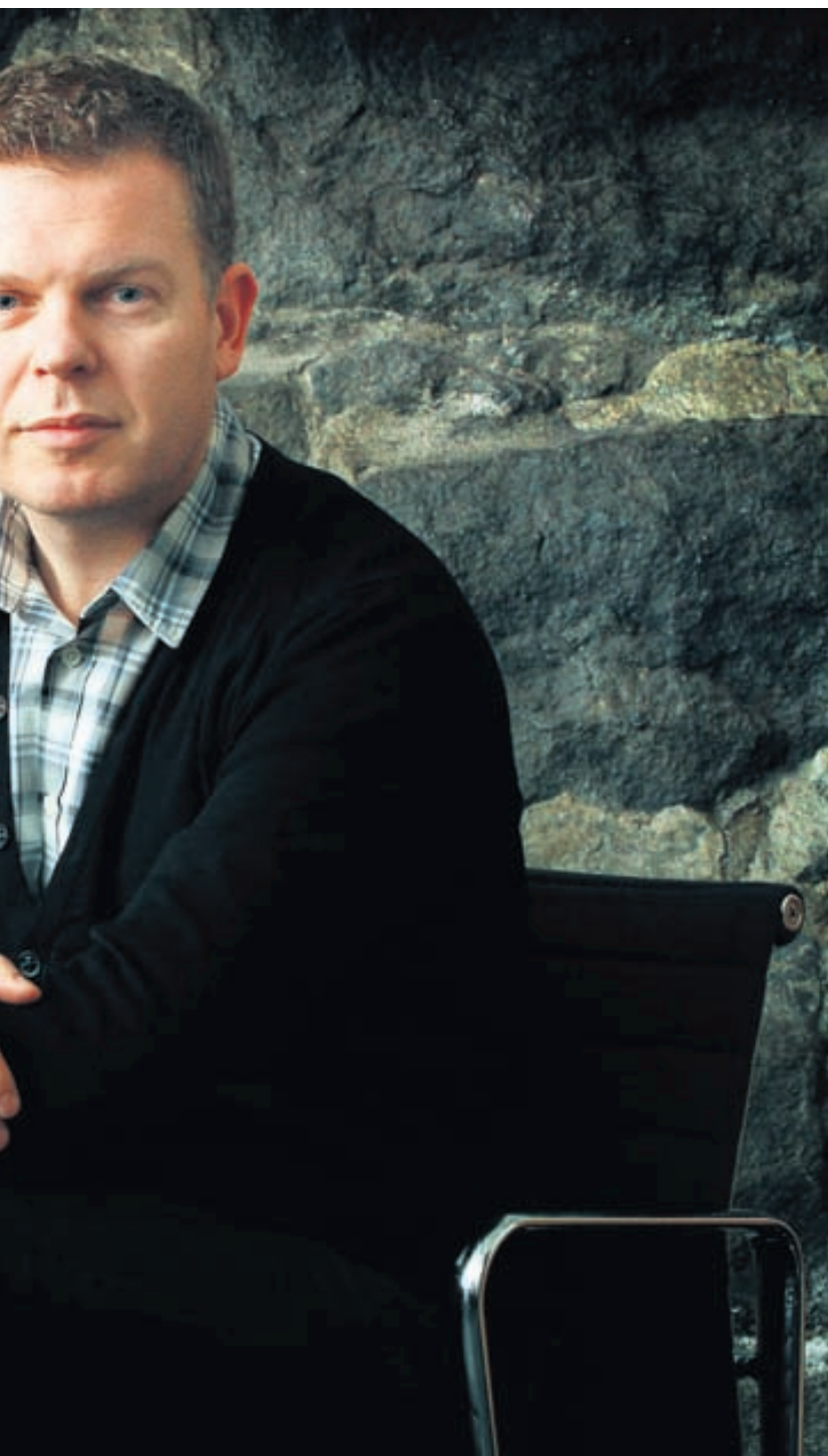
bransanum. Stofan hefur þegar tryggt sér viðskipti WOW air og Nýherja.