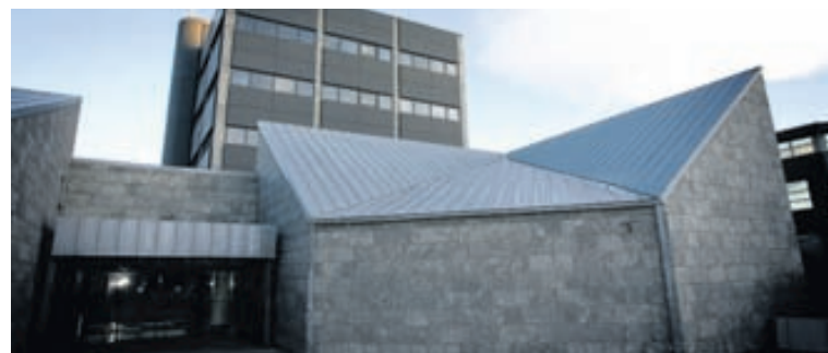
SEÐLABANKINN Bankinn lánaði kaupendum FIH bankans fyrir stórum hluta af kaupverðinu. Það seljendalán er að öllum líkindum tapað.

Þegar Pandora var skráð á markaði í október 2010 var skráningargengi bréfanna 210 danskar krónur á hlut. Bréfin fóru hæst í 386 danskar krónur á hlut en hrundu síðan sumarið 2011 eftir að tilkynnt var um að áætlan-