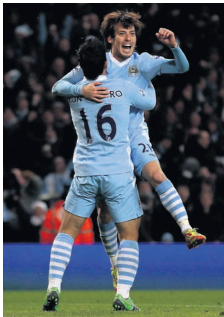
MANCHESTER CITY Enska meistaramir hafa verið allra liða duglegastir við dýr leikmannakaup síðustu ár í krafti gríðarlegra auðæfa eiganda síns, Sheik Mansour frá Sameinuðu arabísku furstadæmunum.

Það er því að mörgu leyti enn óljóst hvort fjármálalegar háttvísireglur UEFA muni skila tilætluðum árangri en flestir innan fótboltaheimsins í Evrópu telja tilraunina þó klárlega þess virði.