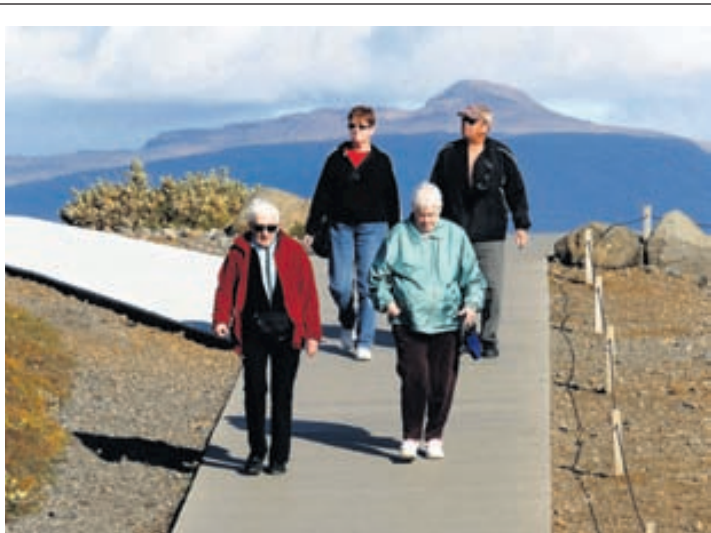
FJÖLGUN Alls fjölgaði erlendur ferðamönnum sem fóru frá Íslandi í gegnum Leifsstöð um 17,2 prósent á fyrstu sjö mánuðum ársins.

Eins og stendur stefnir því í tugmilljarða króna tap Seðlabankans vegna veitingar lánsins. Bankastjóri FIH bankans, Bjarne Graven Larsen, lét enda hafa eftir sér í dönskum fjölmiðlum í júní síðastliðnum að seljendalánið væri tapað.