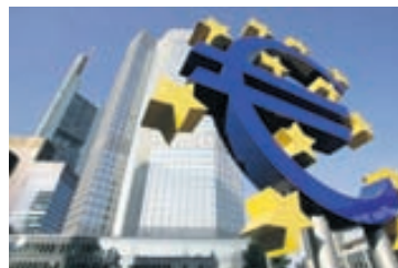
SEDLABANKI EVRÓPU Margir binda vonir við að Seðlabanki Evrópu yti undir hagvöxt á evrusvæðinu á næstunni.

Til samanburðar var 0,4% hagvöxtur í Bandaríkjunum á öðrum ársfjórðungi og á sama tímabili var 0,3% hagvöxtur í Japan. Hagstofa Íslands mun í september