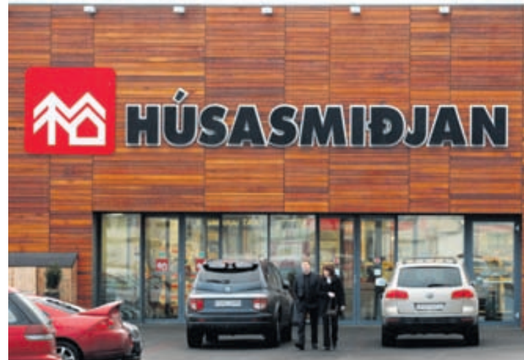
ENDURSAMIÐ Stærsti einstaki leigutaki Eikar er Húsasmiðjan. Endursamið var um leigu fyrirtækisins þegar það var endurskipulagt. Forstjóri Eikar segir það auðvitað hafa haft áhrif á greiðslufæði félagsins.

Garðar segir að Eik hafi verið heimilt að selja enn meira, en ákveðið hafi verið að gera það ekki. „Við erum mjög sáttir með niðurstöðuna. Við erum síðan að fara að ráðast í endurfjármögnun á næstunni þar sem vaxtaþröskulur