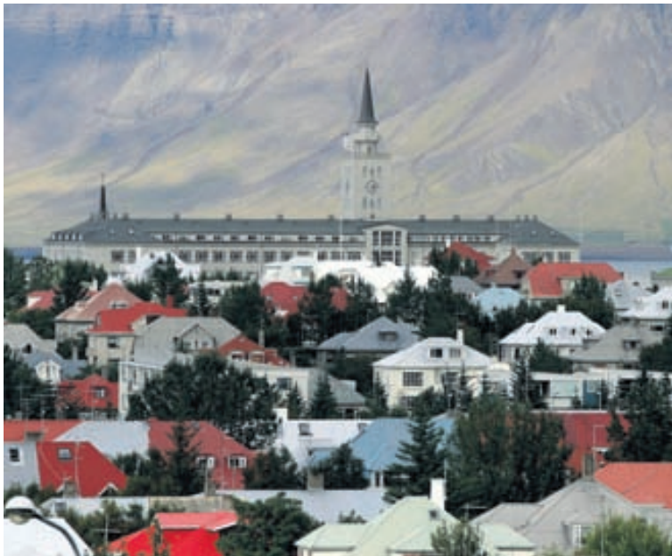
REYKJAVÍK Íbúðalánasjóður hefur veitt talsvert færri íbúðalán það sem af er þessu ári en á sama tímabili í fyrra. FRÉTTABLAÐIÐ/STEFÁN

Alls 716 íbúðalán verið veitt frá áramótum: