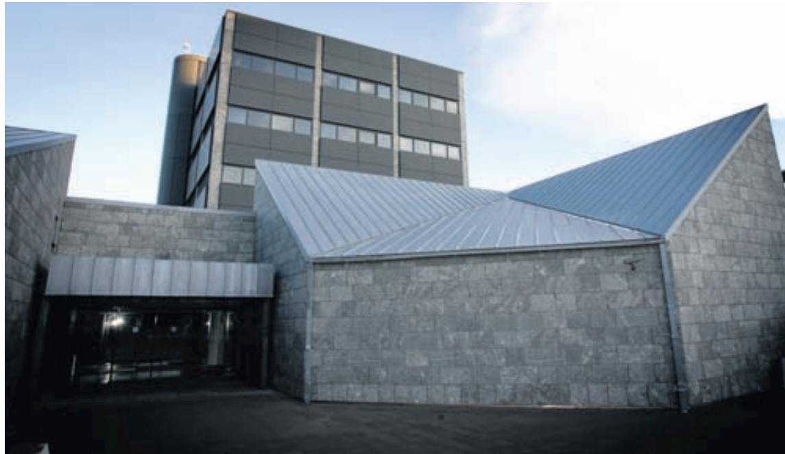
SEÐLABANKINN Lög gera ráð fyrir því að höftin verði afnumin fyrir lok árs 2013. Rúmlega 800 milljarðar króna hið minnsta eru fastir inni í höftunum.

Þá stendur einfaldlega eftir sú spurning hvernig eigendur þessara krónueigna muni taka í það að fá ekki að fara með eignir sínar út úr íslensku hagkerfi að fullu fyrr en eftir áratugi, og fá fyrir það greidda vexti sem eru einhliða ákvarðaðir af útgefendum bréfanna sem þeir yrðu neyddir til að kaupa. Sumir þessara aðila eignuðust nefnilega