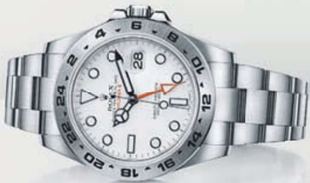
OYSTER PERPETUAL EXPLORER II