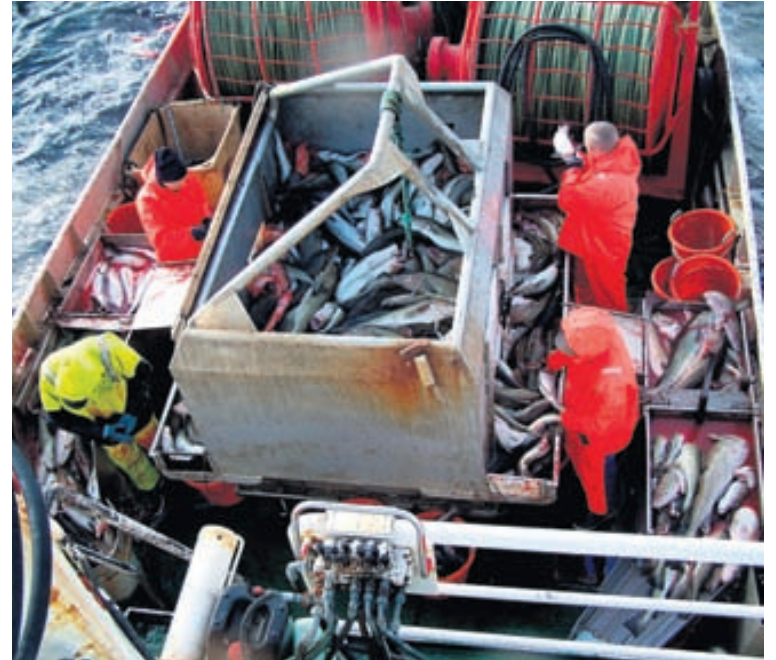
ARDBÆRT Hagnaður sjávarútvegsfyrirtækja hefur verið mikill á síðustu árum. Stærstu fyrirtækin hafa nýtt sér góðærið til að greiða niður skuldir sínar við íslenska banka.