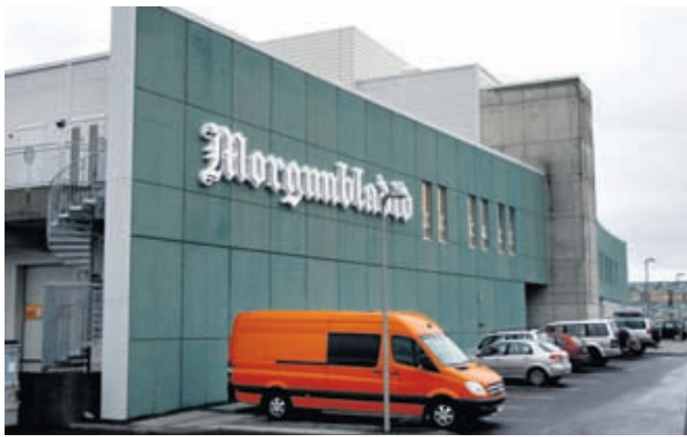
MINNKANDI VIRÐI Þórsmörkurhúpurinn keypti Árvakur í apríl 2009. Helsta eign félagsins er Morgunblaðið.