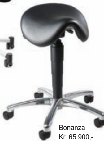
Bonanza Kr. 65.900,- svart leður