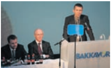
STÆRSTIR Bræðurnir eru orðnir stærstu einstöku eigendur Bakkavarar á ný eftir uppkaup síðustu mánaða.

Bræðurnir hafa keypt upp mikið af kröfum á matvælarisann Bakkavör, sem þeir stofnuðu á níunda áratugnum. Þeir höfðu misst stóran eignarhlut við fjárhagslega endurskipulagningu fyrirtækisins. Í dag eiga þeir um 40 prósentu hlut. Fyrir hann hafa þeir greitt meira en átta milljarða króna.