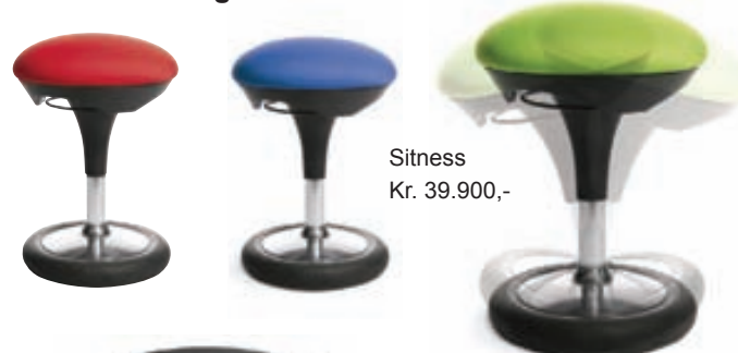
Sitness Kr. 39.900,-