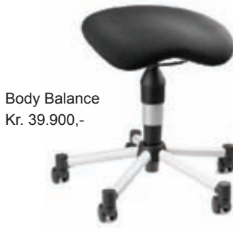
Body Balance Kr. 39.900,-