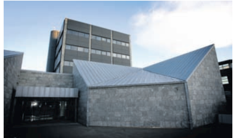
SEÐLABANKINN Fjárfestingarleið Seðlabankans var sett af stað snemma árs í fyrra en alls fóru ríflega 45 milljarðar króna í gegnum leiðina á síðasta ári.