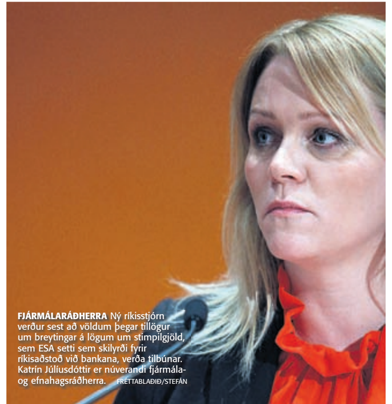
FJÁRMÁLARÁÐHERRA Ný ríkisstjórn verður sest að völdum þegar tillögur um breytingar á lögum um stimpilgjöld, sem ESA setti sem skilyrði fyrir ríkisaðstoð við bankana, verða tilbúnar. Katrín Júlíusdóttir er núverandi fjármála- og efnahagsráðherra.

Samkvæmt skilyrðum ESA áttu íslensk stjórnvöld einnig að skipa nefnd til að endurskoða neytendavernd á íslenskum fjármálamarkaði, með sérstaka áherslu á að auðvelda neytendum að skipta um viðskiptabanka. Nefndin var skipuð í lok október 2012 og átti að ljúka störfum eigi síðar en 15. janúar síðastliðinn. Samkvæmt upplýsingum frá forsætisráðuneytinu hefur nefndin fengið frest til að skila niðurstöðu fram til 1. mars næstkomandi.