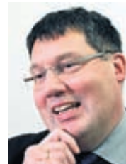
ÓLAFS ÞÓRS HAUSSONAR

frávik. Á þeim geta svo reynst fullkomlega eðlilegar skýringar. Eðlilegt er því að tala um ábendingu í þessu sambandi. Ábendingar geta svo í einhverjum tilvikum leitt til rannsóknar.“