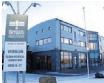
SELT Öryggismiðstöðin hefur skipt um hendur.