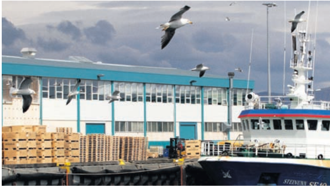
HÚS SJÁVARKLASANS Innan Sjávarklasans eru tugir fyrirtækja sem vinna saman að því að auka virði fyrirtækjanna.

Samkvæmt úttekt sjávarklasans, sem byggir á upplýsingum frá tæknifyrirtækjunum sjálfum og tilraunum sem gerðar hafa verið með búnað þeirra og hönnun, má áætla að hægt sé að spara að minnstu kosti fimmtung af olíukostnaði, eða um fjóra milljarða króna.