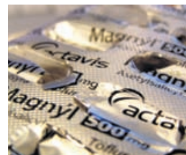
NOTAD TÖFLUBRÉF Actavis áætlar að tekjur fyrir 2013 nemi um 8,6 milljörðum bandaríkjadala og hagnaður á hlut verði 9,26 til 9,39 dalir.

Hagnaður án afskrifta (EBITDA) jókst um 61 prósent og nam 489,2 milljónum dala á þriðja fjórðungi samanboreið við 304,6 milljónir á sama tíma 2012. - óká