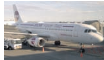
Á LEIÐ Í LOFTIÐ Wow er nú formlega orðið flugfélag.

Hagstofa Íslands birtir tölur um raforkunotkun og flokkar eftir stórnotendum og almenna notkun svo sem eins og heimilin í landinu o.fl. Myndin sýnir mánaðarlega raforkunotkun frá janúar 1995 til júní 2013. Raforkunotkun heimila (bláa línan) er árstíðabundin, hæst í desember en lægst í júní og júlí ár hvert. Raforkunotkun stórnotenda (brúna línan) hefur vaxið mikið á tímabilinu, úr 200 gigawattstundum (GWst) á mánuði árið 1995 í 1.150 Gwst.