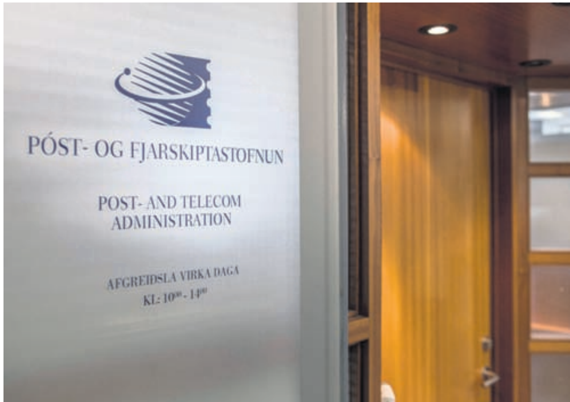
FARA YFIR MÁLIN Starfsmenn Póst- og fjarskiptastofnunar fara nú yfir athugasemdir sem stofnuninni bárust vegna fyrirhugaðra breytinga.

„Allir þeir sem ákveða að fara í rekstur þurfa að fjárfesta í því að fara í rekstur. Allt frá því að Já var stofnað höfum við náð samningum við öll starfandi fjarskiptafyrirtæki um afhendingu símanúmeraupplýsinga, líkt og aðrir geta gert. Það eru því