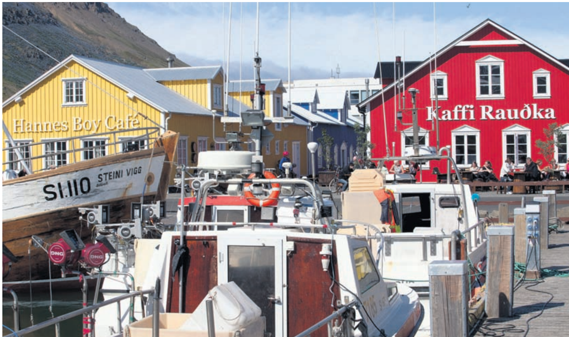
FJÁRFESTA Í FERÐAÞJÓNUSTU Við smábátahöfnina á Siglufirði standa nú veitingahús, kaffihús, skemmtistaður og gallerí Rauðka. Líftækni fyrirtækið Genís er einnig með aðstöðu þar og nýtt hótél bætist í hópinn vorið 2015.