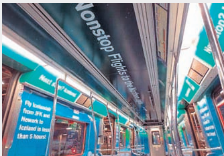
ALMERKTUR ICELANDAIR Þessi lestarvagn er einn fimmtán vagna sem merktir eru Icelandair að innan.

„Við sjáum tækifæri á þessum markaði milli Ameríku og Evrópu, sérstaklega á hinum svokölluðu „secondary markets“, utan stóru miðstöðvanna, til að flytja farþega yfir hafið. Til dæmis er aðeins eitt flugfélag að fljúga milli