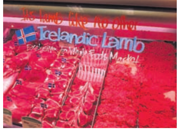
ÚTRÁS Bandaríska verslanakeðjan Whole Foods Market selur meðal annars íslenskt lambakjöt.