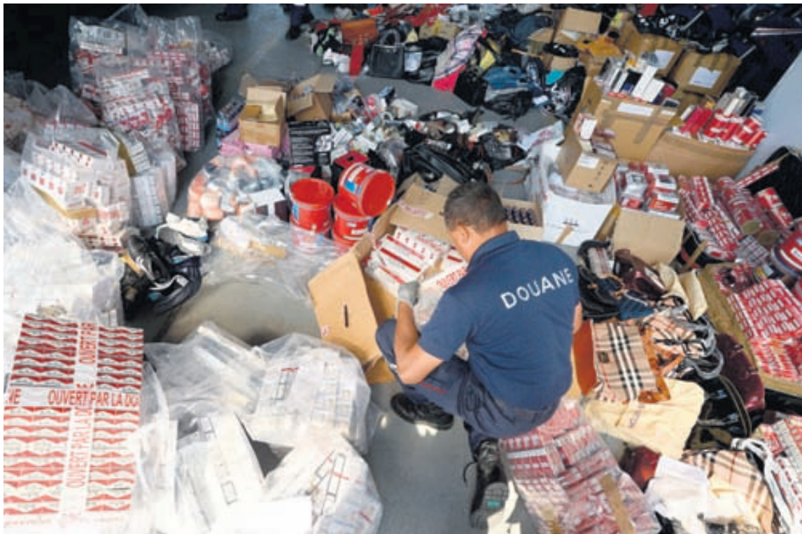
FARGAÐ Baráttan gegn sölu á falsaðri merkjavöru fer fram úti um allan heim. Þessi mynd er tekin í Frakklandi fyrr á þessu ári þar sem yfirvöld skáru upp herör gegn fölsunum.

„Þetta er falsað að einhverju leyti og einhverju ekki,“ segir