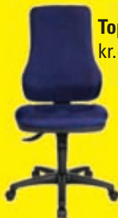
Top Point kr. 44.900,-