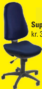
Support kr. 32.900,-