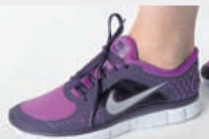
VINSÆLIR Nike Free Run-skór hafa notið mikilla vinsælda hér á landi síðustu mánuði, en mikið hefur einnig borið á fölsunum hér á landi.

„Á meðan kemur þetta niður á viðskiptavinum okkar sem finna fyrir þessu, sérstaklega litlu búðirnar úti á landi.“