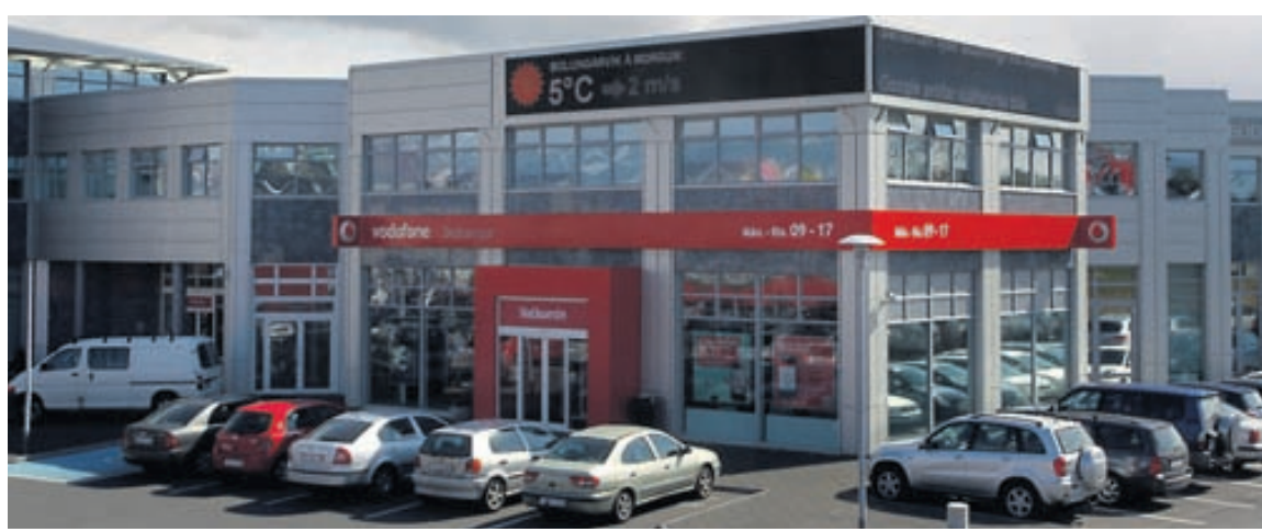
HÖFUÐSTÖÐVARNAR Tekjur Vodafone hækkuðu um eitt prósentustig á þriðja ársfjórðungi miðað við sama tímabil í fyrra.

Myndin sýnir þróun stýrivaxta Seðlabanka Íslands í samhengi við þróun vaxta á eftirmarkaði þ.e. ávöxtunarkröfu á Ríkisbréfum til 1 árs, 3 ára og 5 ára. Stýrivextir eru vextir af lánum sem Seðlabankinn veitir fjármálastofnunum til skamms tíma og geta haft umtalsverð áhrif á vexti inn- og útlána banka og sparisjóða og markaðsvexti á peninga- og skuldabréfamarkaði. Ríkisbréf eru óverðtrygg skuldabréf útgefin af Ríkissjóði Íslands og ganga kaupum og sölu á eftirmarkaði. Myndin sýnir þróun ávöxtunarkröfu á Ríkisbréfum og hvaða vexti markaðsaðilar eru ásáttir um næstu 1-5 árin með hliðsjón af verðbólguvæntingum. Stýrivextina notar bankinn sem stjórnæki til að hafa áhrif efnahagslífs þ.e. verðlag og eða gengi krónunnar.