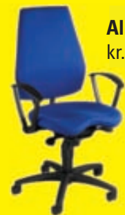
Alu Basic kr. 53.800,-