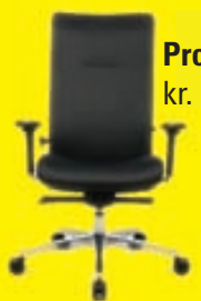
Profi Star kr. 129.900,-

Hirzlan Smiðsbúð 6, 210 Garðabæ Sími 564 5040 www.hirzlan.is