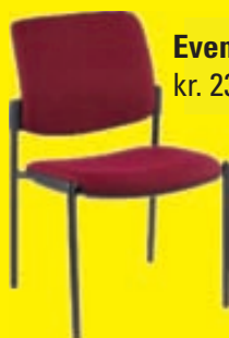
Event kr. 23.900,-