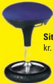
Sitness kr. 42.700,-