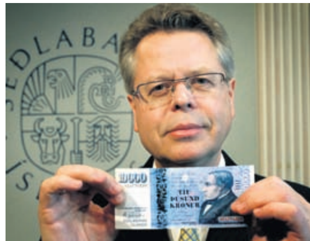
BRAKANDI NÝR Már Guðmundsson seðlabankastjóri kynnti tíu þúsund króna seðilinn í síðasta mánuði.

Markmiðið með því að taka upp nýjan tíu þúsund króna seðil var að sögn bankans að fækka seðlum í umferð. Það hefur nú tekist því þrjú hundruð þúsund fimmþúsundkallar hafa borist bankanum frá því nýi seðillinn fór í umferð 24. október síðastliðinn.