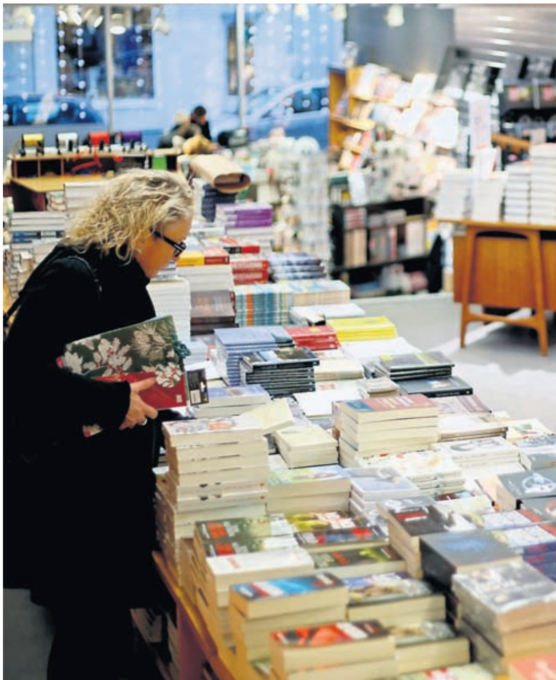
JÓLABÓKAFLÓÐIÐ HAFIÐ Um sjö hundruð bókartitlar eru til sölu fyrir þessi jól samkvæmt skráningu Félags íslenskra bókaútgefenda.