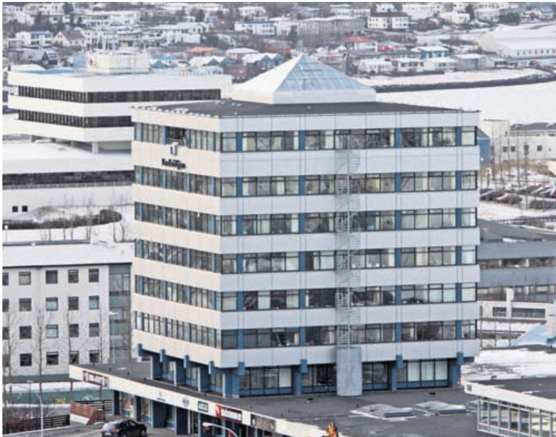
HÖFUÐSTÖÐVARNAR Viðskiptaráð Íslands leggur til að ríkið selji lífeyrissjóðunum minnihlutaeign í Landsvirkjun.

*fyrsta verð 8. maí 2013 **fyrsta verð 24. apríl 2013