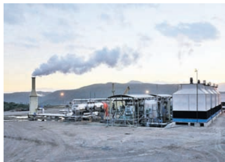
Í AFRIKU Verkis er eitt þeirra fyrirtækja sem sinna ráðgjafarverkefnum í Afríku. Fyrirtækið kemur nú að byggingu orkuvers í Kenía.

Einungis eitt íslenskt fyrirtæki, Jarðboranir, sinnir erlendum borverkefnum vegna jarðhitanytingar. Starfsmenn fyrirtækisins hafa á þessu ári unnið á áður nefndri Biliran-eyju, á eyjunni Dómíníku í Karíbahafi og Nýja-Sjálandi.