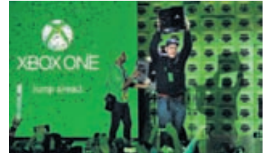
ÚTGÁFUHÁTIÐ Fyrstu Xbox One-vélarinnar í Bandaríkjunum voru afhentar á útgáfuhátíð í New York síðastliðinn föstudag.

Svipuð þjónusta sem nefnist Twitch, þar sem fólk getur spjallað og deilt skráum, er tengd nýju Playstation 4-tölvunni sem fer í sölu hér á landi eftir áramót og í Bret-