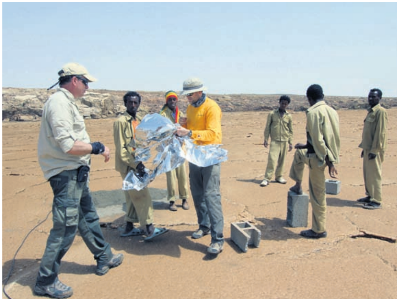
ADSTÆÐUR SKOÐAÐAR Starfsmenn ÍSOR koma meðal annars að jarðvarmaverkefni nálægt eldfjallinu Dallol í Eþíópíu.