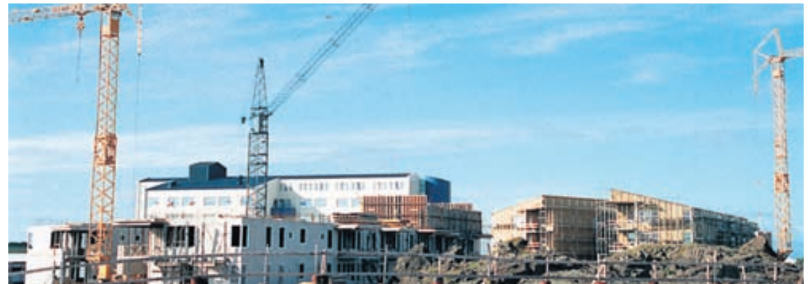
HÚSBYGGINGAR Um nokkurt skeið hefur verið talað um ládeyðu í íslensku afhafnalífi og fátt um ný verkefni.

landi í lok mánaðarins. Þar er líka eftirlit með því efni sem notendur deila. - óká