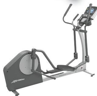
Fjölpjálfi X1 Sérlega hljóðlátur og vandaður fjölpjálfi í fullri stærð með Go stjórnborði Verð kr. 495.000.- Verð nú aðeins kr. 396.000.-