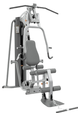
Æfingastöð G4 Sérstaklega þægileg og fjölhæf æfingastöð, sterk og stöðug Verð kr. 445.000.- Verð nú aðeins kr. 378.250.-