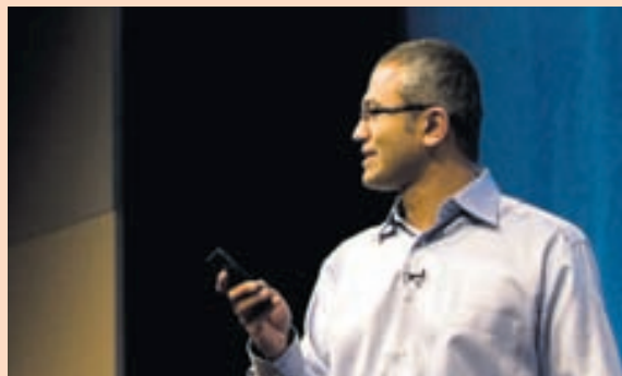
MANNABREYTINGAR Nadella hóf störf hjá Microsoft árið 1992.

Á Íslandi er það vel þekkt að íbúar á landsbyggðinni hafa minni menntun og þeim bjóðast fábreyttari störf en íbúum á höfuðborgarsvæðinu. Enn skortir þó á að hugsa um höfuðborgarsvæðið út frá öðrum borgum í heiminum. Hvar stendur Reykjavík í alþjóðlegum samanburði? Er nýsköpunarkerfi borgarinnar nægilega öflugt til þess að keyra áfram hagvöxt framtíðarinnar?