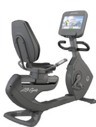
Prekhjól Platinum Club Mjög vandað sitjandi prekhjól úr nýjustu og öflugustu línunni frá Life Fitness. Achieve skjár. Verð kr. 895.000.- Verð nú aðeins kr. 698.100.-