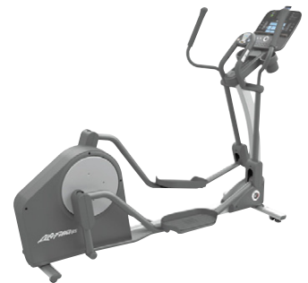
Fjölpjálfi X3 Sérlega hljóðlátur og vandaður fjölpjálfi í fullri stærð með Go stjórnborði Verð kr. 545.000.- Verð nú aðeins kr. 463.250.-