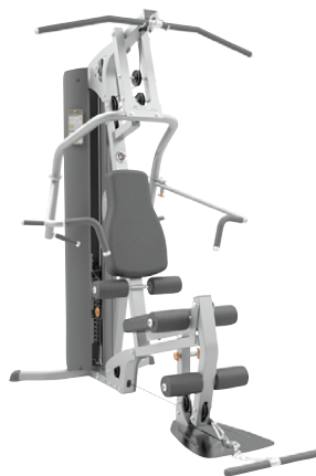
Æfingastöð G2 Sérstaklega þægileg og fjölhæf æfingastöð, sterk og stöðug Verð kr. 295.000.- Verð nú aðeins kr. 250.750.-