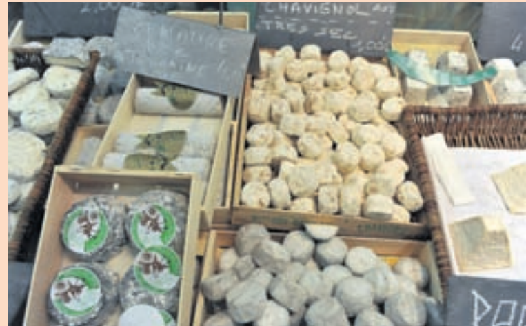
OSTAR Framleiðsla á innlendum buffala-, geita- og ær mjólkurostum er sögð engin eða hverfandi.

Í bréfi Haga til ráðuneytisins færir fyrirtækið þau rök fyrir