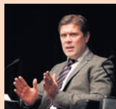
RÁÐHERRA Bjarni Benediktsson skipaði nefndina.