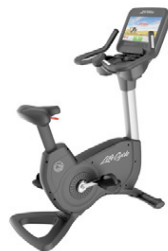
Prekhjól upright Platinum Club Mjög vandað prekhjól úr nýjustu og öflugustu línunni frá Life Fitness. Engage skjár. Verð kr. 1.195.000.- Verð nú aðeins kr. 991.850.-